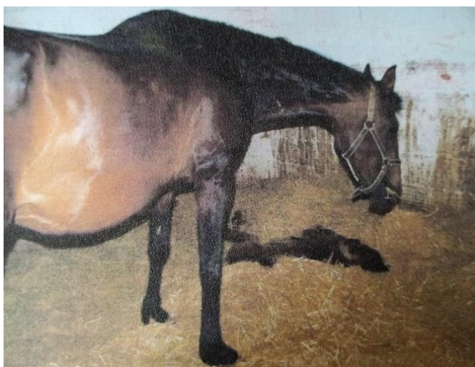
Slika 16. Hrvatska toplokrvna kobila sa ždrebetom

Najmlađi uzgojni tip, uzgaja se na području cijele Hrvatske, naročito u Slavoniji. Broj grla u Vukovarsko-srijemskoj županiji je 12, a broj vlasnika 10. Pripadaju tipu jahaćih konja, a koriste se i za turnirske jahačke sportove i rekreaciju. Glava im je plemenita, ravnog profila, vrat mišićav i dug, imaju izražen greben. Leđa su nešto kraća, a sapi dobro mišićave. Uglavnom je dorate boje, a u manjoj mjeri se može javiti i kao vranac, rjeđe kao siva, odnosno alat. Broj ovih konja je stalno u porastu i u Hrvatskoj ih ima oko 450 grla.