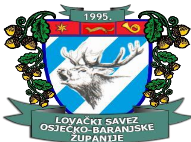
Slika 6. Grb Lovačkog saveza Osječko-baranjske županije

U županiji od 1995. godine djeluje Lovački savez Osječko-baranjske županije. Članice Saveza su s područja bivših općina Beli Manastir, Valpovo, Našice, Donji Miholjac, Osijek i Đakovo. U Lovačkom savezu Osječko-baranjske županije djeluje ukupno 109 članica. Trenutno u Savezu ima 2812 lovaca i 47 lovnih pripravnika. Lovačka društva uglavnom lovišta koriste za odmor i rekreaciju što ne daje značajnu dobrobit u smislu lovnog gospodarstva.