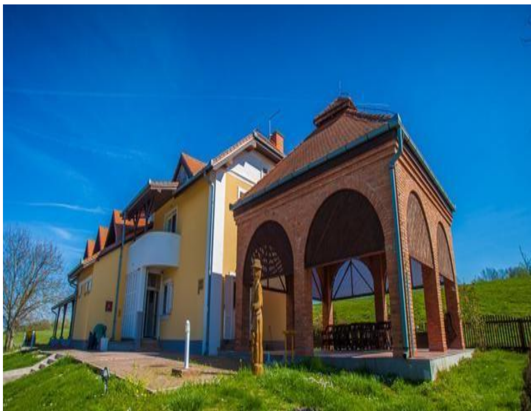
Slika 3. Lovački dom Zlatna greda

Lovački dom Zlatna greda, jedan od najljepših lovačkih domova u vlasništvu Hrvatskih šuma. Smješten je u Baranji uz sam dunavski nasip u Lovištu Podunavlje-Podravlje koje predstavlja jedno od najvažnijih europskih lovišta poznato po ritskim šumama uz Dravu i Dunav te po bogatstvu krupne divljači posebno jelena i divlje svinje te predstavlja biser hrvatske lovne ponude. Posebno je upečatljiva rika jelena u ritu, te skupni lov na divlje svinje. Udaljen je 3 km uskom asfaltnom cestom od Zlatne Grede u Baranji. Otvoren je 2000. godine i od tada njime uspješno gospodari Uprava šuma podružnica Osijek, šumarija Tikveš.