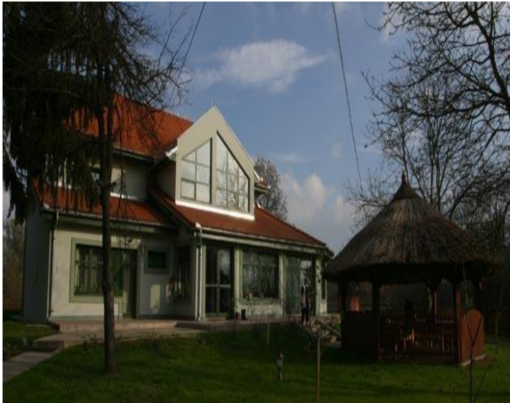
Slika 4. Lovački dom Čošak šume

Nedaleko poznatog dvorca Tikveš iz austrougarskog doba, u lovištu Podunavlje-Podravlje, poznato po bogatstvu krupne divljači, posebno jelena i divlje svinje, smješten je lovački dom Čošak Šume, okružen neponovljivim šumskim krajolikom. Gostima se na jelovniku nude nadaleko poznati i priznati baranjski specijaliteti u mirnoj i ugodnoj domaćoj atmosferi.