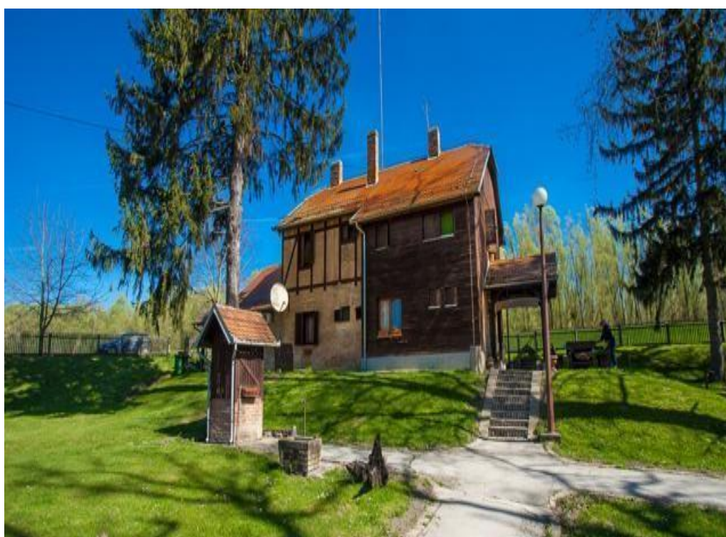
Slika 5. Lovački dom Monjoroš Zmajevac

Lovački dom Monjoroš, iz 19. stoljeća, smjestio se nedaleko baranjskog mjesta Zmajevac u opuštajućem šumskom krajoliku. Ekskluzivno lovište nalazi se u trokutu između Dunava i Drave, jedno od najvažnijih u Europi. Smješteno je u tipično nizinskom panonskom području, osobite plodnosti, a obuhvaća ritske šume bogate krupnom divljači, posebno jelenom i divljom svinjom. Smještaj za 8 do 10 gostiju. U ponudi se nalaze vrhunska autentična baranjska jela i pića.