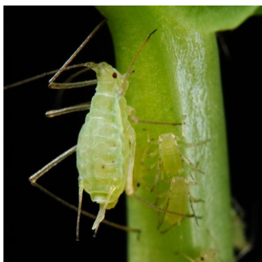
Slika 19 . Myzus persicae

Grinja crvenog pauka ( Tetranychus urticae ) najopasniji je štetnik karanfila. Hrani se na naličju lista gdje sisaju sokove. Napadnuto lišće blijedi i vene, a biljka postaje iskrivljena i usporava rast. Najveće štete nastaju u vrijeme suhих i vrućih uvjeta (Varvodić, 2015.).