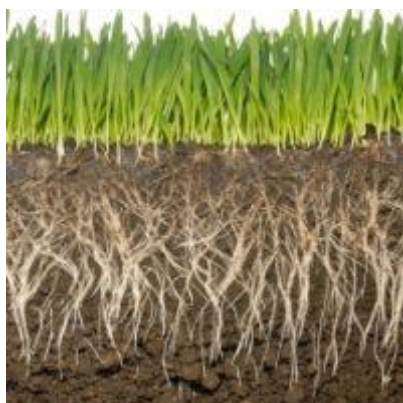
Slika 1: Korijen pšenice.