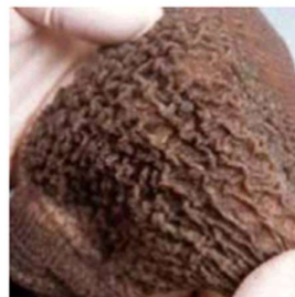
Slika 2. Prikaz razvoja papila buraga ovisno o režimu hranidbe