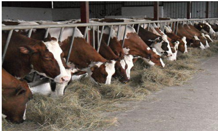
Slika 4. Voluminozna hrana