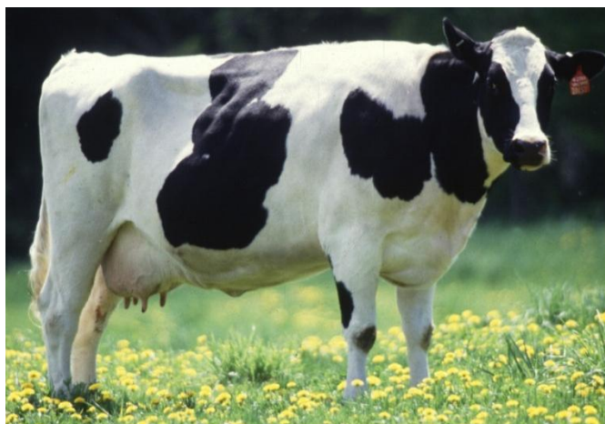
Slika 2. Holštajn pasmina ( genetski podložnija dislokaciji sirišta )