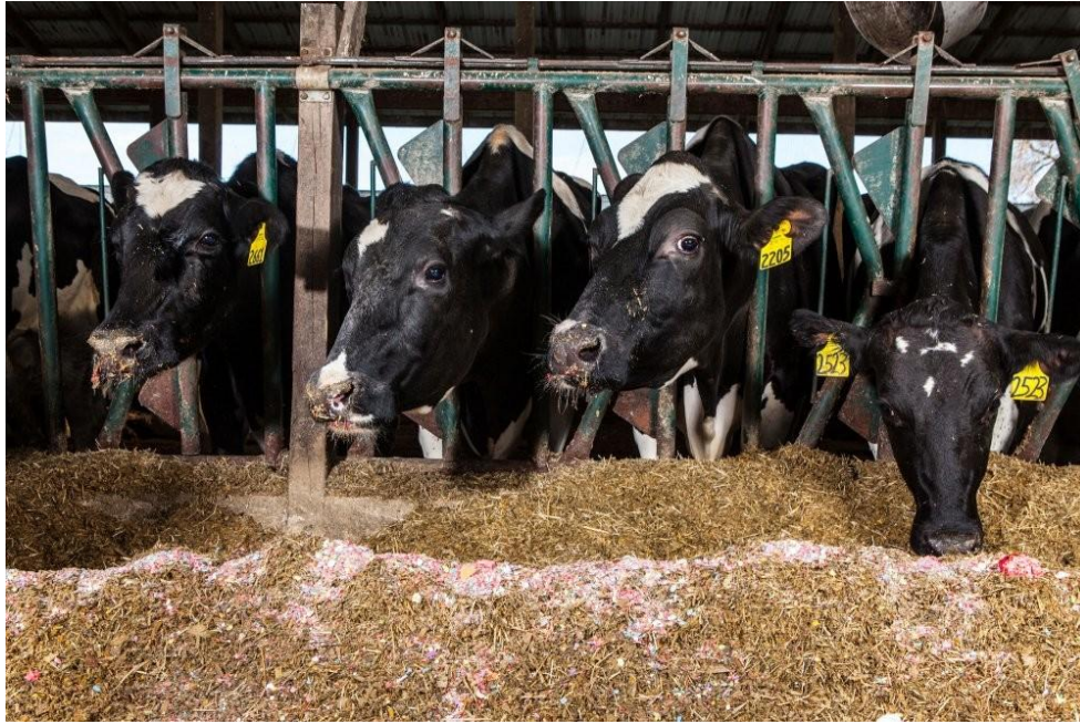
Slika3. Koncentrirana hrana