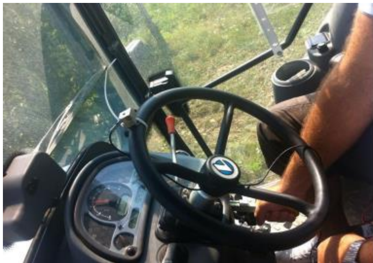
Slika 7. Senzor uređaja za mjerenje razine vibracija

Prema europskoj direktivi (2002/44/EC) određene su granične vrijednosti i upozoravajuće vrijednosti izloženosti za vibracije šaka - ruka su sljedeće: