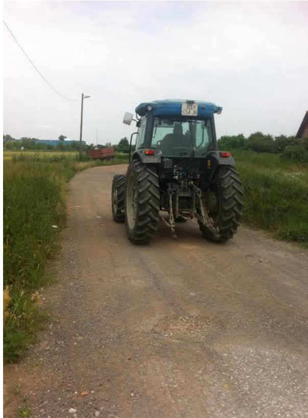
Slika 5. Mjerenje razine traktorskih vibracija na makadamu