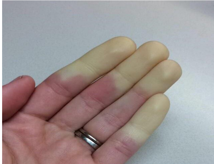
Slika 2. Vibracijski sindrom šake i ruke