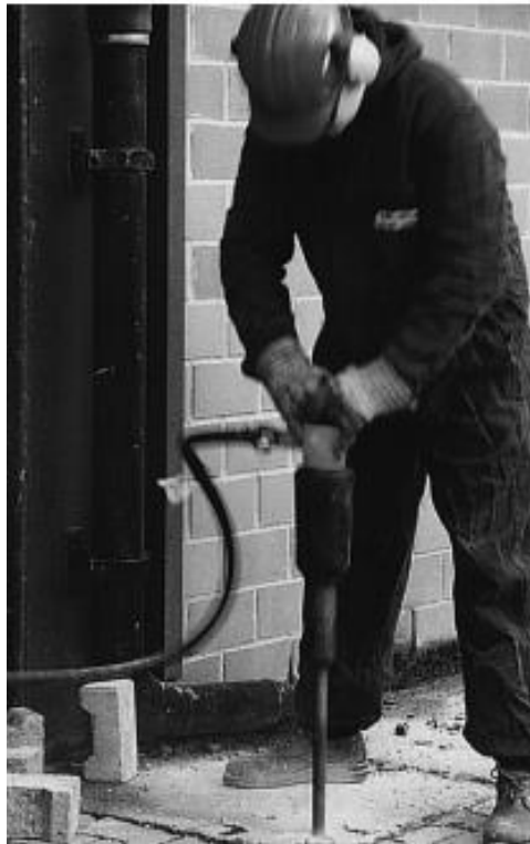
Slika 1. Izvođenje građevinskih radova korištenjem vibrirajućeg alata