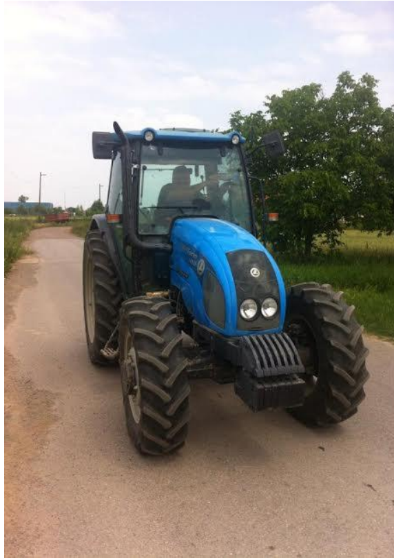
Slika 4. Mjerenje razine traktorskih vibracija na asfaltu