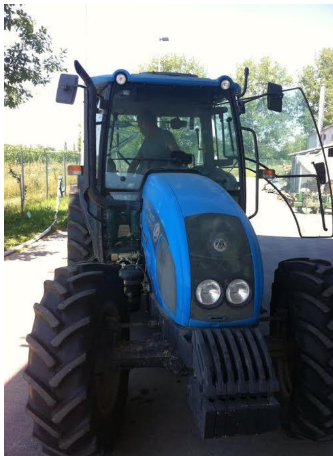
Slika 3. Traktor LANDINI, tipa POWERFARM DT 100

Mjerenja su obavljena na proizvodnim površinama i pristupnim cestama srednje Poljoprivredne i veterinarske škole Osijek. Mjerene su proizvedene vrijednosti traktorskih vibracija koje utječu na sustav ruka- šaka rukovatelja (po x, y i z osi). Vrste podloga na kojima su obavljena mjerenja su makadam, asfalt i trava. Svako mjerenje trajalo je trideset minuta i ponovljeno je tri puta. Na osnovu tri mjerenja izračunata je srednja vrijednost koja je korištena dalje u radu.