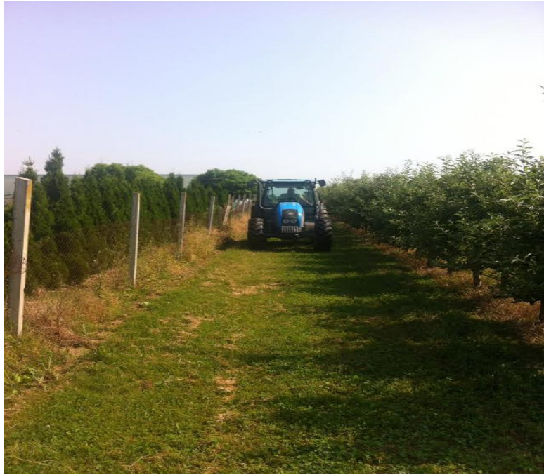
Slika 6. Mjerenje razine traktorskih vibracija na travi