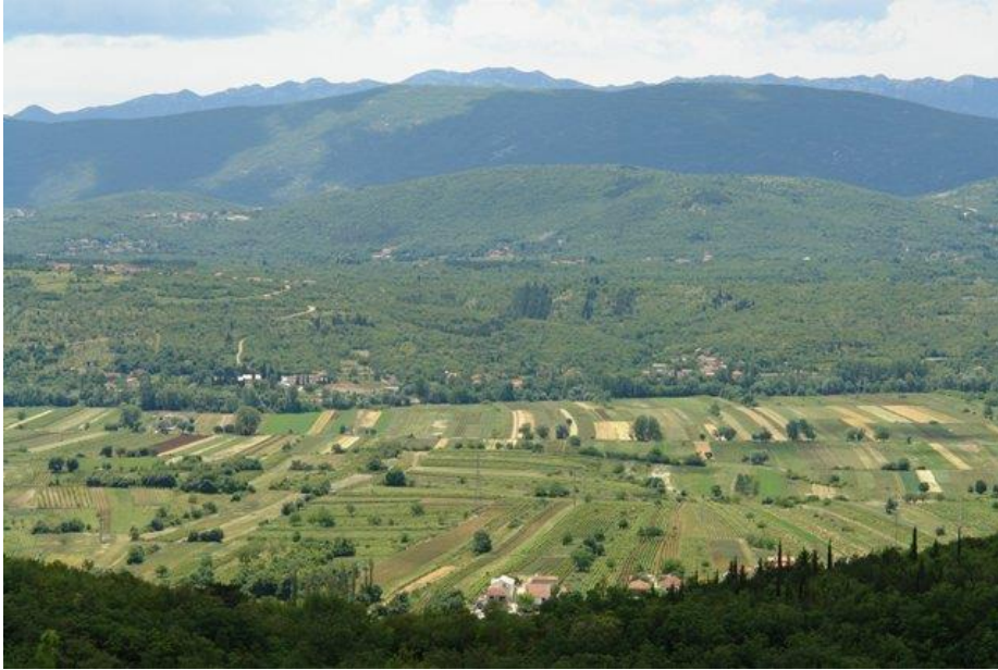
Slika 1. Imotsko polje