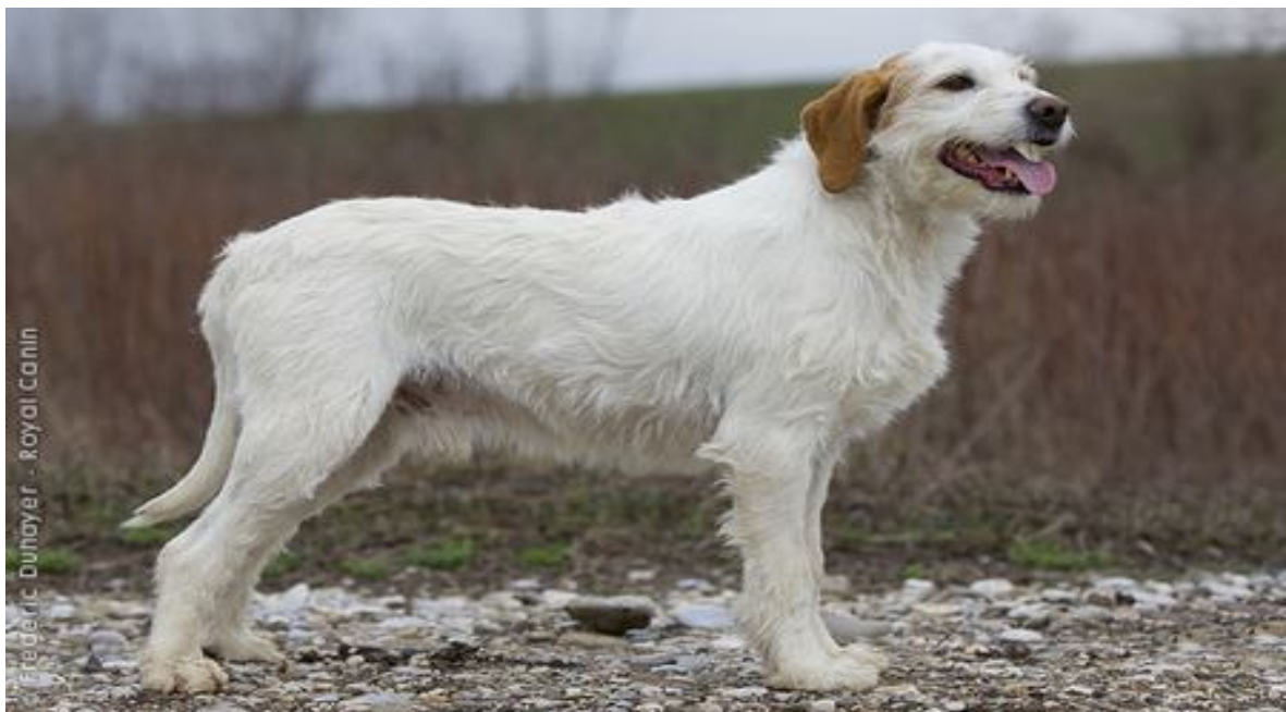
Slika 4. Istarski oštrodlaki gonič, izvor: www.rujanajeger.com pristup stranici: 17.05.2017. u 10:30 sati