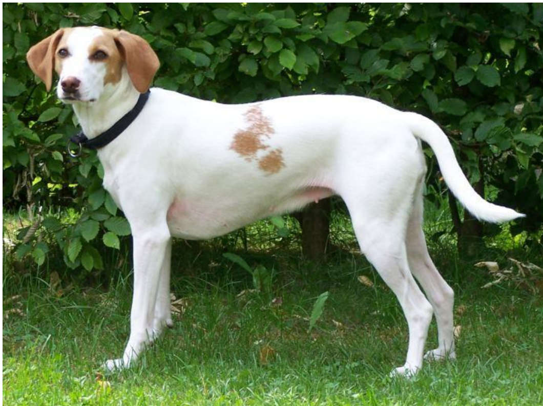
Slika 2. Istarski kratkodlaki gonič

istarskog oštrodlakog goniča objavio 1949. godine. Prvi standard ove pasmine pasa datira iz 1969. godine, a danas važeći standard objavljen je 03. studenog 2014. godine.