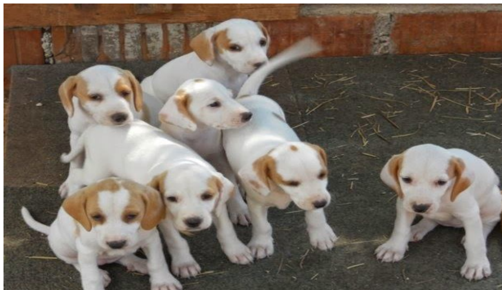
Slika 7. Štenci kratkodlakog varijeteta