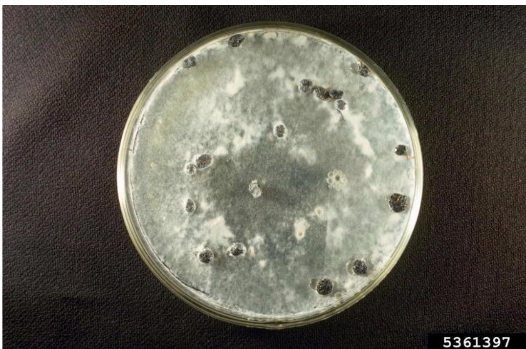
Slika 2. Sklerocije na krumpir dekstroznom agaru

sklerocijom zaraženih stabljika rajčice koje su pokazivale tipične simptome bijele truleži. Površinski dezinficirane sklerocije stavljene su na krumpir-dekstrozni agar u Petrijeve zdjelice (slika 2.) (PDA, Merck, Germany) i dopunjene antibioticima (streptomycin sulfat i rifampicin). Zdjelice su 5 do 7 dana inkubirane na temperaturi od 20 °C da bi se micelij dobro razvio. Mali uzorak agara s razvijenim micelijem gljive odvojen je od kolonije i prebačen na novu hranjivu podlogu (PDA). Te su zdjelice inkubirane na temperaturi od 20 °C. Izolatom gljive ponovno su zaražene presadnice rajčice čime je utvrđeno da je on izrazito patogen. Kultura je održavana na PDA pri temperaturi 4 °C, a jednom mjesečno je obavljeno precjepljivanje na novu hranjivu podlogu. Čista kultura patogena pohranjena je u zbirci kultura.