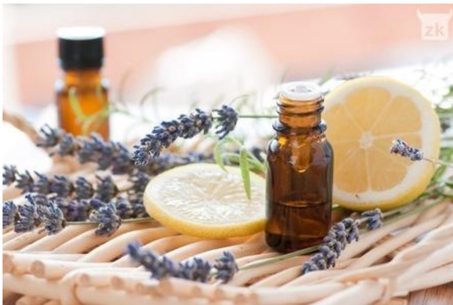
Slika 1. Eterična ulja ( https://www.google.hr/search?q=eteri%C4%8Dna+ulja )

primjeni na nesteriliziranim zrnima kukuruza. Ulje origana povećava proizvodnju zearlenona te iako sva ulja inhibiraju proizvodnju deoksinivalenola na višim temperaturama i pri većoj količini vode, ulja origana i palmarose povećavaju proizvodnju mikotoksina pri niskoj količini vode u zrnju.