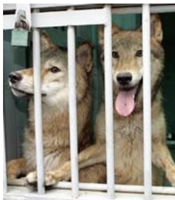
Slika 4. Klonirani vukovi Snuwolf i Snuwolffy