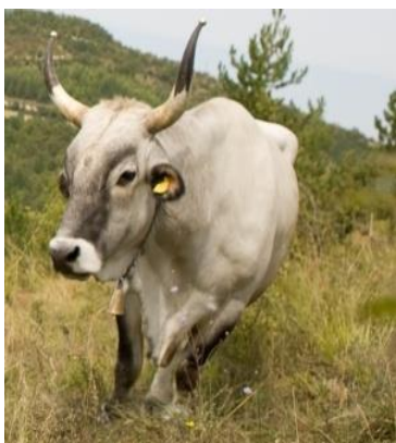
Slika 6. Istarki boškarin

Saborski Odbor za poljoprivredu izjasnio se u ožujku 2014. godine protiv kloniranja domaćih životinja, konkretno goveda, svinja, ovaca, koza i konja te protiv upotrebe klonova u prehrani ljudi. Time je Hrvatska podržala restriktivne mjere, no istaknut je i problem eventualne nemogućnosti stavljanja na tržište potomaka klonova ugroženih pasmina, a kao primjer naveden je istarski boškarin. (Slika 6.)