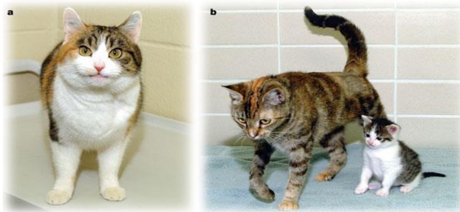
Slika 3. Mačka donor i surogat mačka sa kloniranim mačićem