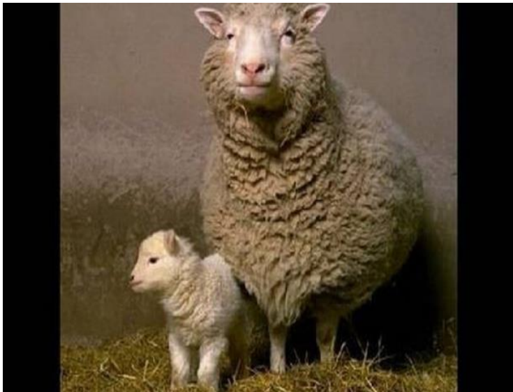
Slika 2. Ovca Dolly i njeno prvo janje Bonnie

O prvom uspješnom kloniranju životinja izvijestio je Institut Roslin u Škotskoj. Ovca Dolly doživjela je šest godina, a danas se čuva preparirana u Kraljevskom muzeju u Škotskoj. (Slika 2.) EFSA (2010) izvještava kako je kloniranje farmskih životinja u svijetu uspješno obavljeno na 22 različite vrste životinja, koje uključuju goveda, svinje, ovce, koze i ekvide.