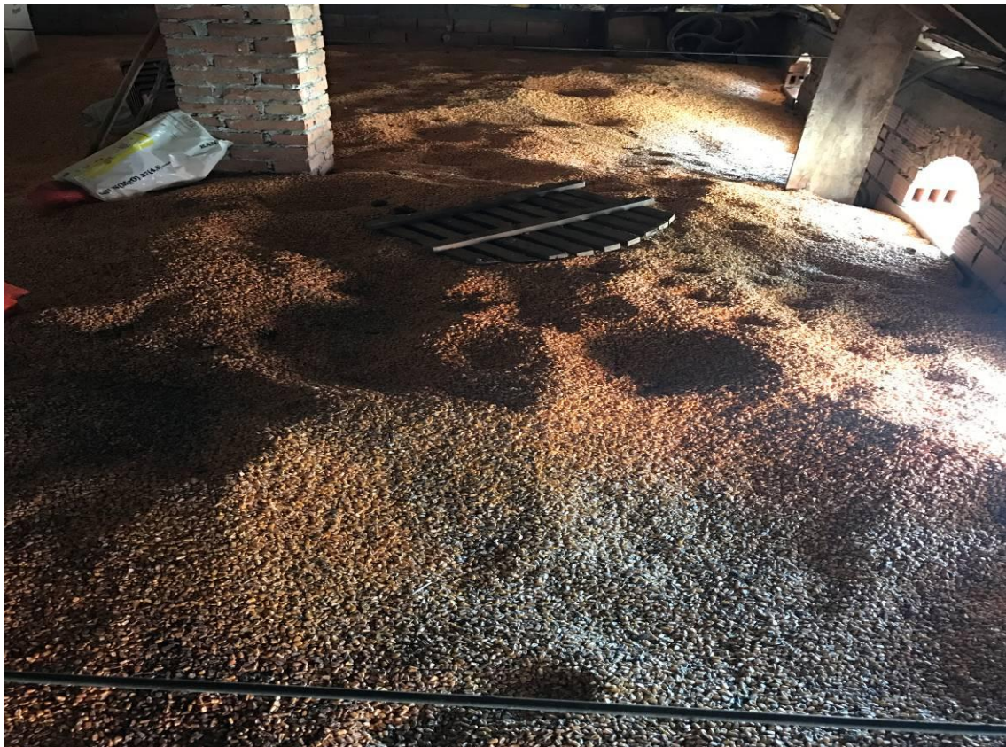
Slika 3. Skladištenje zrna kukuruza