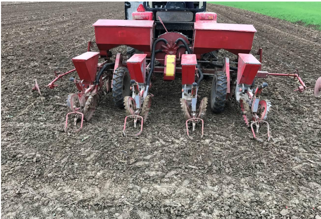
Slika 1. Sjetva kukuruza na OPG-u (foto: V. Strepački, 2017.g.)