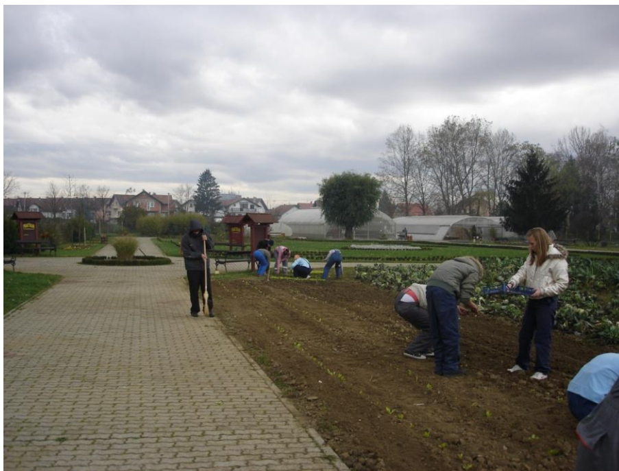
Slika 13. Eko-vrtlari učeničke zadruge „Tkanica“

Učenici uspješno sudjeluju u planiranju aktivnosti, samostalni su i aktivni u ostvarivanju planova, te postaju aktivni sudionici projekta „Sjeme – Panj – Umjetnost – Život“, u suradnji sa braniteljskom zadrugom SPUŽ, iz Slavonskog Broda. Projekt je zamišljen i ostvaruje se u učionici na otvorenom u vrtu škole.