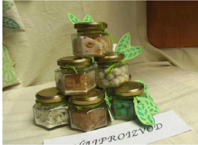
Slika 8. Biljni bomboni, UZ Lavanda, OŠ Mejaši, Split