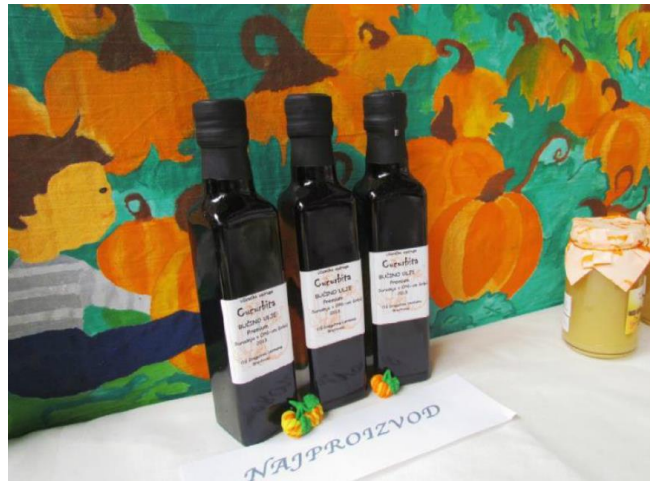
Slika 5. Bučino ulje, UZ Cucurbita, OŠ Dragutin. Lerman, Brestovac