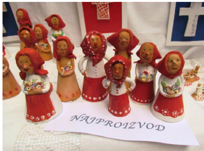
Slika 6. Snašice, UZ Tkanica, OŠ Milan Amruš, Slavonski Brod