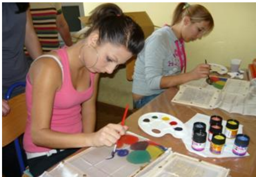
Slika 16. Slikanje na svili

Projekt uređenja etno-kutka namijenjen je učenicima Srednje škole M. A. Reljkovića, uključenima u rad učeničke zadruge „Tkanica“, pogotovo članovima sekcije „Zlatne ruke“, za ostvarenje ideje očuvanja hrvatske narodne baštine i prezentacije vlastitog proizvoda – ženske narodne nošnje; koju su izradile mlade zadrugarke tehnikom zlatoveza. Također, namijenjen je učenicima u zanimanju Agroturistički tehničar i većoj promociji turističke ponude Brodsko – posavske županije.