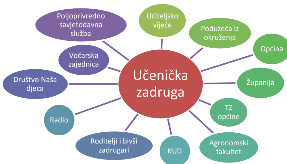
Slika 2. Učenička zadruga i lokalna zajednica

Učeničko zadrugarstvo se u današnje vrijeme potvrdilo kao nositelj očuvanja biološkog i kulturnog nasljeđa, prepoznaje duh kulturne baštine i tradicije kraja, koje njeguje kroz rad svojih sekcija. Mnoge su učeničke zadruge tako postale i važan član svoje lokalne zajednice, te joj daju prepoznatljivost, i sastavni su dio njezine ponude, te iz toga možemo zaključiti da učenička zadruga ne može, ili teško opstaje bez pomoći i suradnje sa lokalnom i mjesnom zajednicom.