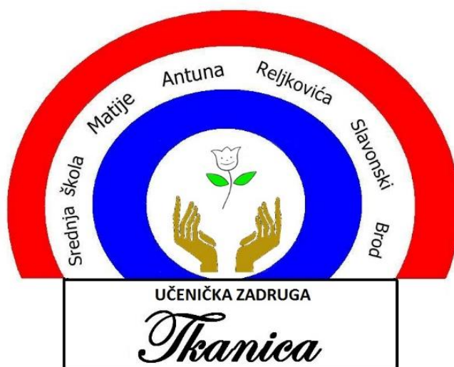
Slika 11. Logotip učeničke zadruge „Tkanica“

Učenička zadruga „Tkanica“ osnovana je 1989. godine u Srednjoj školi Matije Antuna Reljkovića u Slavonskom Brodu. Sa radom je prekinula već 1990.godine uslijed ratnih zbivanja, a prekid je potrajao do 2000.godine. Rad učeničke zadruge u potpunosti je obnovljen 2001.godine.