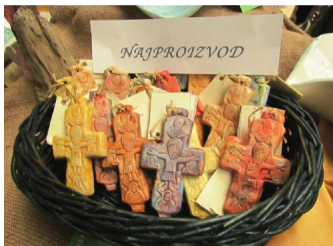
Slika 7. Čikin križić, UZ Mocire, OŠ Voštarnica, Zadar