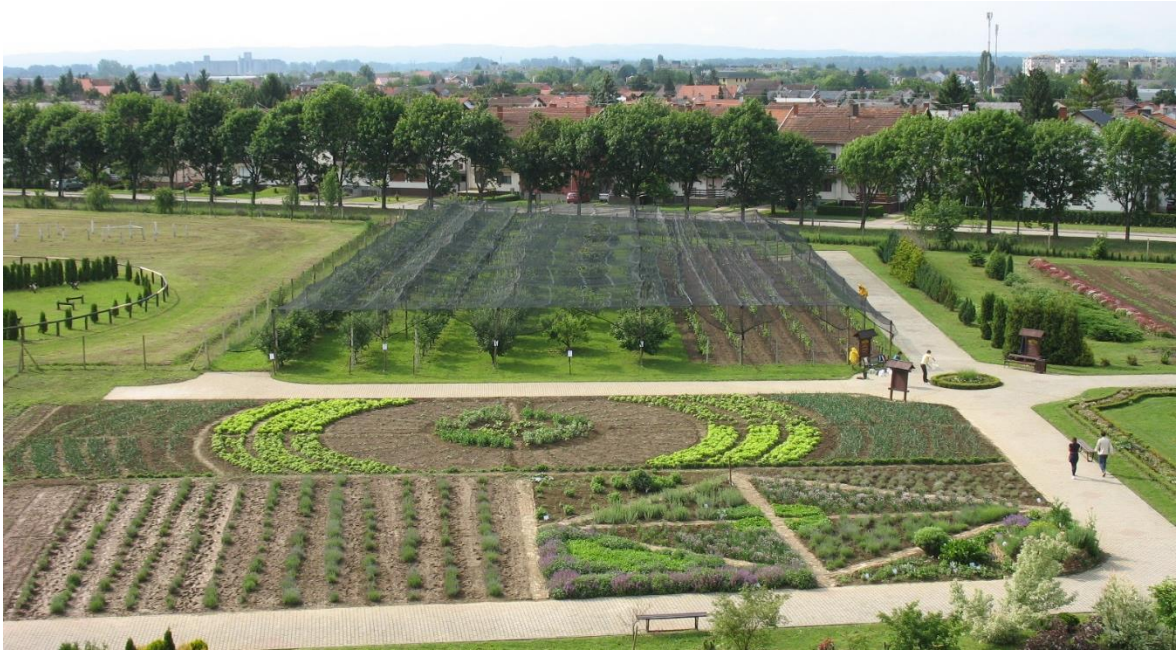
Slika 12. Školski vrt Srednje škole Matija Antun Reljković