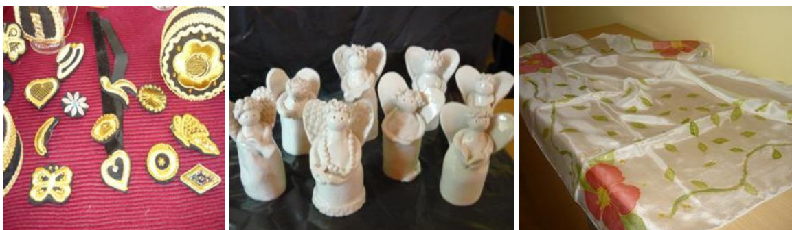
Slika 19. Proizvodi; zlatovez, anđeli od keramike, svilene marame

Slobodne aktivnosti pružaju velike mogućnosti odgojnog djelovanja, međutim one su vrlo često, zapostavljene u našim školama.