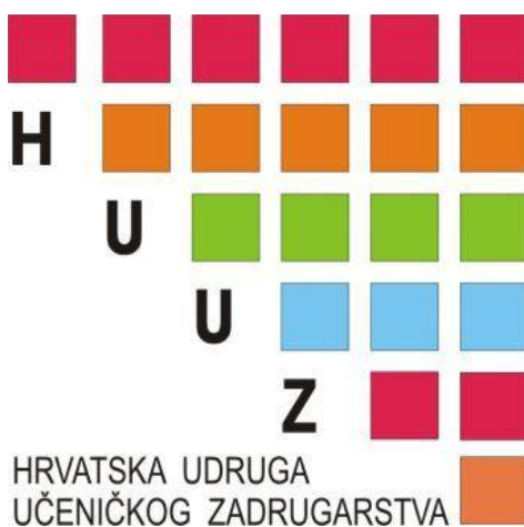
Slika 4. Logotip HUUZ

Hrvatska udruga učeničkog zadrugarstva (eng. Croatian Association of School Cooperatives) je strukovna, nevladina, nestranačka, neprofitna udruga u koju se slobodno udružuju osnovne i srednje škole, učenički domovi i druge ustanove u Republici Hrvatskoj koje imaju učeničku zadrugu kao oblik izvannastavne aktivnosti učenika. Hrvatska udruga učeničkog zadrugarstva (HUUZ) osnovana je u lipnju 2006. godine i kao neprofitna pravna osoba, članica je Hrvatske zajednice tehničke kulture 2 . HUUZ radi na razvoju i promicanju učeničkog zadrugarstva, te je suorganizator županijskih, međužupanijskih i državnih smotri učeničkog zadrugarstva u Republici Hrvatskoj, a u Registar udruga upisana je 1. rujna 2006. godine, pri Gradskom uredu za opću upravu grada Zagreba.