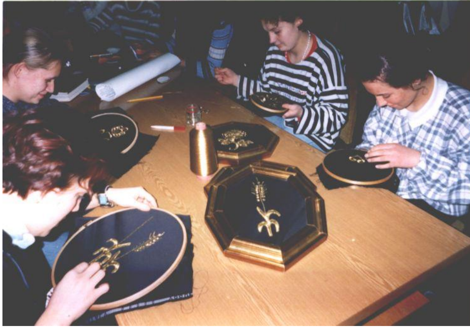
Slika 14. Zlatovezilje

Osnovni zadatak sekcije „Zlatne ruke“ je razvijanje svijesti o tradicijskim vrijednostima i njegovanje baštine. Posebna pozornost daje se upoznavanju i savladavanju različitih tehnika ručnog rada, posebice zlatoveza, te savladavanje tehnika slikanja na svili, izrade predmeta od keramike, te primjena stručnih znanja i vještina u svakodnevnome životu.