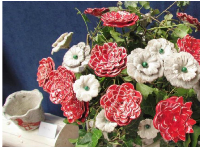
Slika 9. Vaza sa cvijećem, UZ Fijolica, Centar za odgoj i obrazovanje Čakovec