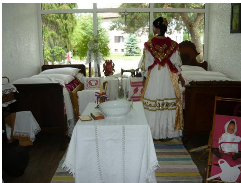
Slika 17. Narodna nošnja i etno kutak

Projekt uređenja etno-kutka namijenjen je učenicima Srednje škole M. A. Reljkovića, uključenima u rad učeničke zadruge „Tkanica“, pogotovo članovima sekcije „Zlatne ruke“, za ostvarenje ideje očuvanja hrvatske narodne baštine i prezentacije vlastitog proizvoda – ženske narodne nošnje; koju su izradile mlade zadrugarke tehnikom zlatoveza. Također, namijenjen je učenicima u zanimanju Agroturistički tehničar i većoj promociji turističke ponude Brodsko – posavske županije.