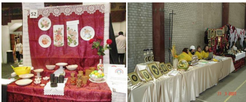
Slika 18. Predstavljanje proizvoda UZ „Tkanica“ na sajmovima

Svoje proizvode zadruga prodaje na raznim sajmovima, a prilikom prodaje koriste se paragon blokovima, te vode knjigu primitaka i izdataka. U slučaju da zadruga ne uspije prodati sve svoje proizvode, poklanja ih, pa tako proizvode iz vrta poklanjaju djelatnicima škole i mladim zadrugarima, a zlatovez, slike i marame (oslikana svila), poklanjaju se osobama u domovini i inozemstvu (škole, ministarstva, poslovni suradnici u Austriji, Italiji, Francuskoj, Nizozemskoj, Izraelu, itd.).