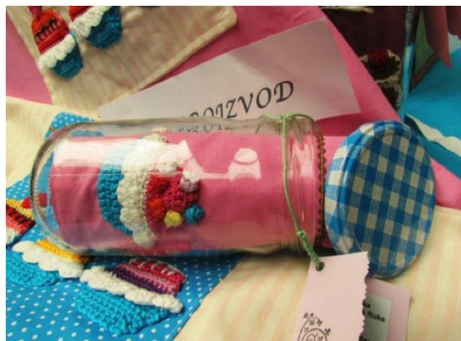
Slika 10. Pregača u staklenci, UZ Ruke, OŠ Žitnjak, Zagreb