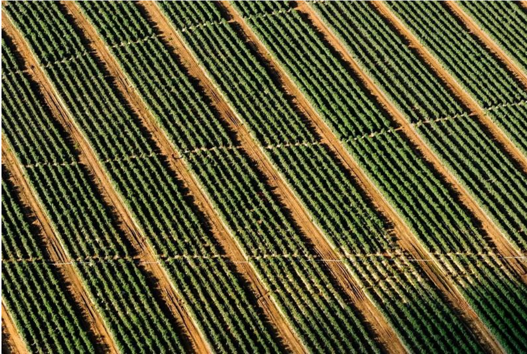
Slika 2. Komascija poljoprivrednog zemljišta