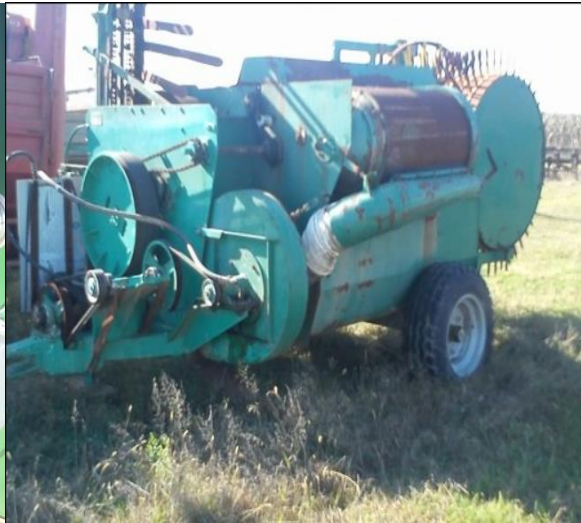
Slika 4. - Slika pogona za ekstrakciju