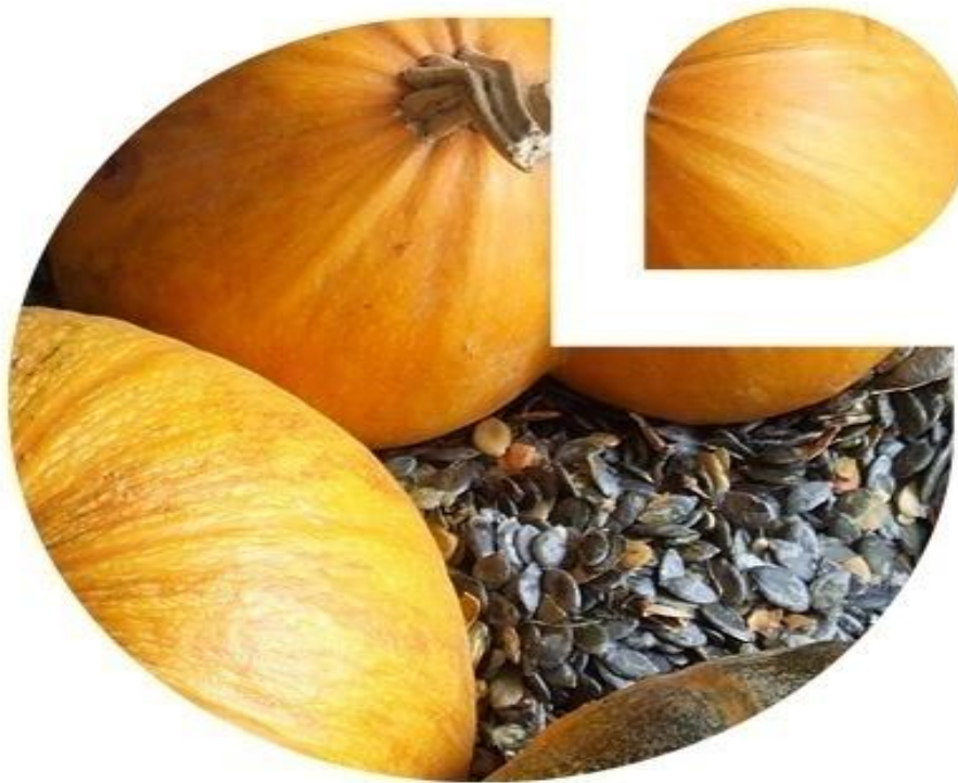
Slika 1. - Bučine sjemenke

Osim toga oleinska kiselina važan je dio mediteranske prehrane koja služi u prevenciji kardiovaskularnih bolesti. 3 Bučino ulje sadrži obilje E vitamina, osobito gama tokoferola (oko 30 mg/100 g) što je izuzetno važno u antioksidacijskom obrambenom mehanizmu, ali i skupinu karotenoida koji su također zaštitni čimbenici organizma. Stručnjaci bučine koštice po sadržaju mikrominerala uspoređuju s orasima iz razloga što bakar i mangan koji sudjeluju u brojnim kofaktorima tjelesnog enzimskog sustava važnog u borbi protiv stresa (superoksid dismutaza).