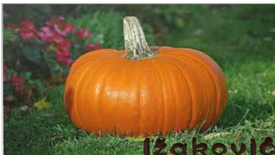
Slika 3. – Figurativni žig OPG Ižaković