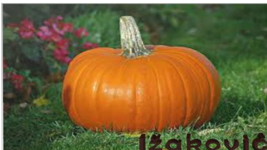
Slika 3. – Figurativni žig OPG Ižaković