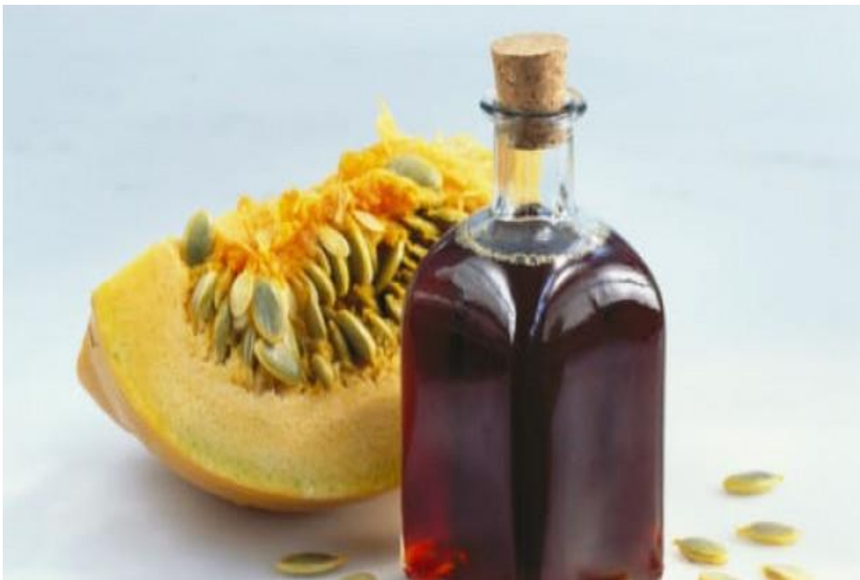
Slika 2. - Bučino ulje