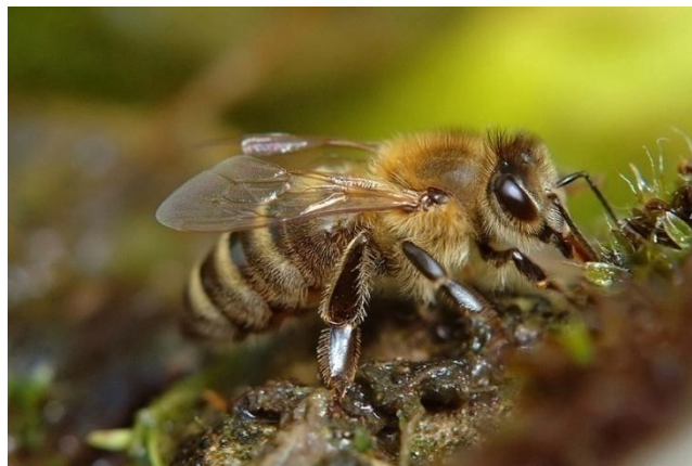
Slika 2. Apis mellifera mellifera L.