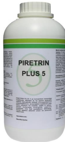
Slika 4: Komercijalni proizvod Piretrin Plus 5

S obzirom na to da piretrin, ukoliko se koristi prema uputama za uporabu, ima minimalni utjecaj na ljudsko zdravlje te jako dobru djelotvornost na kukce (najprije brza paraliza kukca), piretrin je danas jedini biljni insekticid koje se primjenjuje u zaštiti uskladištenih poljoprivrednih proizvoda. Smrtna (letalna) doza (LD) koja izaziva uginuće 50% testirane populacije štakora iznosi 1500 \text{ mg kg}^{-1} ( https://www.ecfr.gov/cgi-bin/text-idx?node=se40.24.180_1127&rgn=div8 , 12.05.2017.)