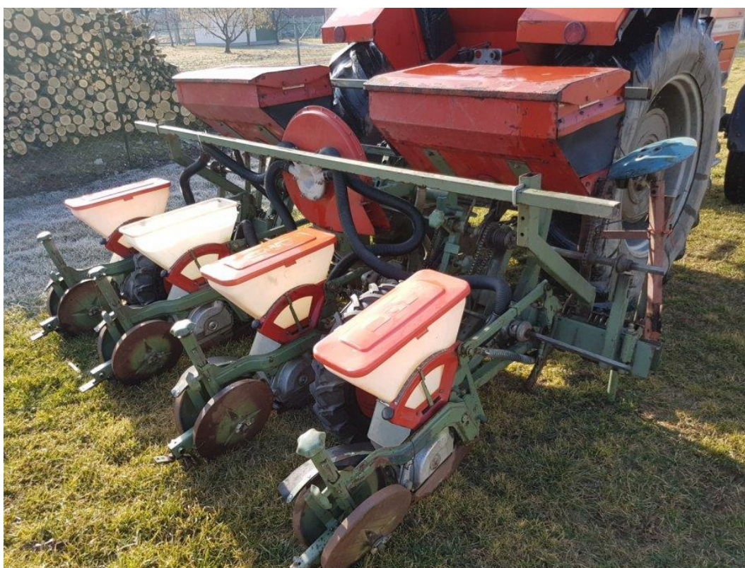
Slika 10. Četveroredna pneumatska sijačica marke OLT

Sjetva kukuruza obavljena je 10.04.2017. godine četverorednom pneumatskom sijačicom marke OLT na dubinu 4-5 cm. Među redni razmak bio je 70 cm, a sijalo se na razmak unutar reda 18 cm, te je ostvaren sklop od 79 000 zrna/ha, Za sjetvu su korišteni hibridi sjemenarske kuće KWS. Zasijane su dvije parcele svaka površine po 1 ha sa hibridom KWS Mikado FAO grupa 620. Na slici 10. možemo vidjeti sijačicu koja je korištena u pokusu.