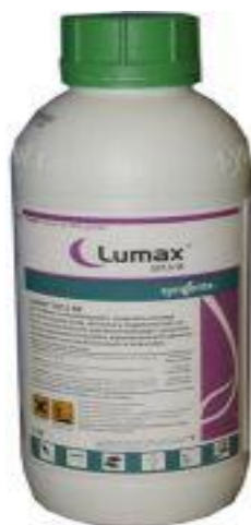
Slika 11. Lumax; zaštitno sredstvo u proizvodnji kukuruza