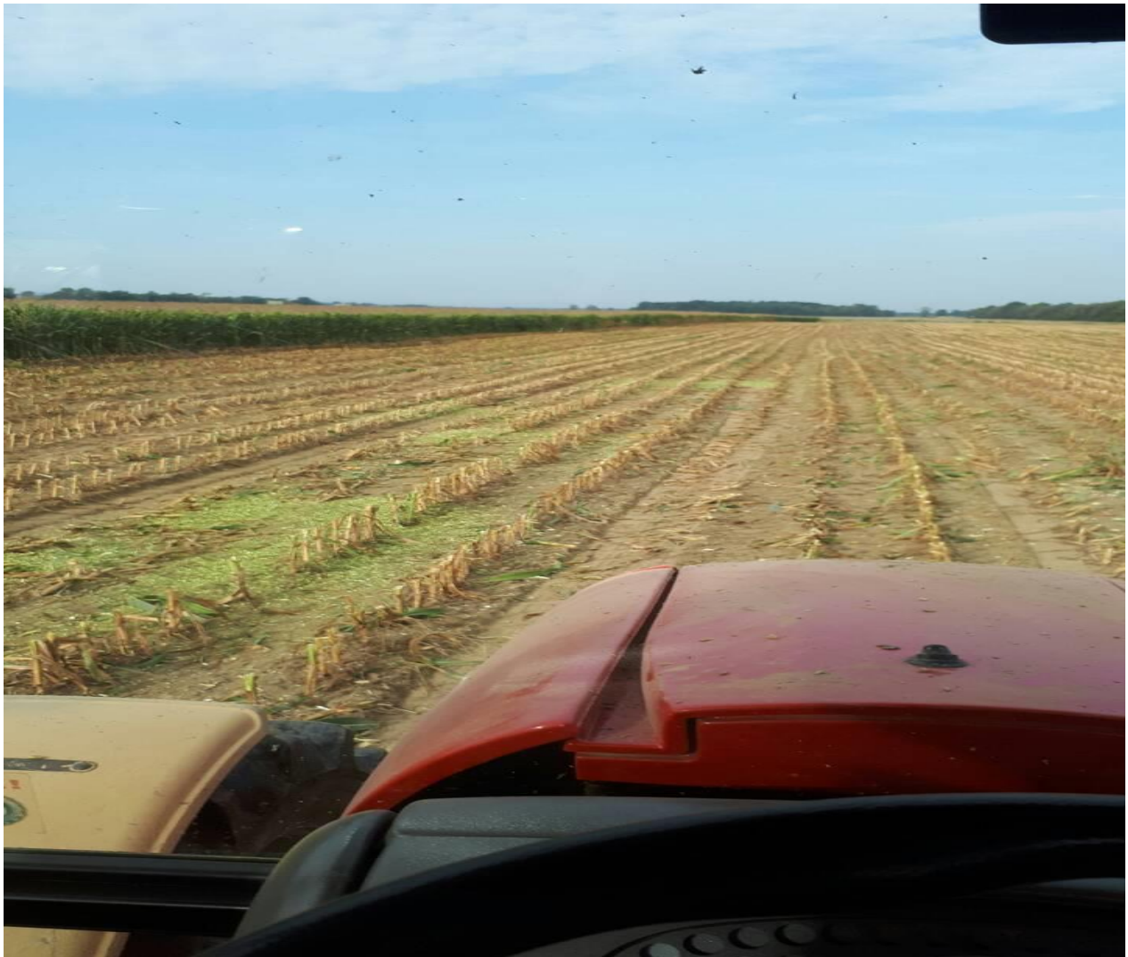
Slika 17. Odvoz kukuruzne silaže s njive

polja do bioplinskog postrojenja obavljen je sa 7 traktora i prikolica, siliranje kukuruza i transport silaže je obavljen od strane vanjskog pružatelja usluge i taj trošak je uračunat u tablici troškova i prihoda u proizvodnji silažnog kukuruza. Na ulazu u bioplinsko postrojenje svaka prikolica je posebno vagana, zatim je zelena masa istovarena u horizontalne silose i opet se išlo na vagu, kako bi se dobila točna neto količina istovarene zelene mase. Svakom prikolicom je prosječno dovezeno 10-12 tona zelene mase. Budući da nije bilo kvarova niti zastoja u logistici, siliranje na OPG Siniša Glatki obavljeno je u jednom danu. Cijena 1 kilograma zelene mase bila je 24 lipe, a isplaćivanje otkupljene zelene mase silaže kukuruza se plaća u roku od 60 dana nakon ispostavljenog računa za predanu silažu, a na temelju vagarinki.