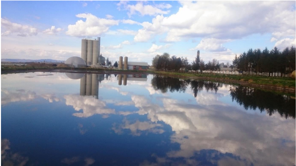
Slika 8. Laguna sa tekućim digestatom- Bioplinsko postrojenje Gradec