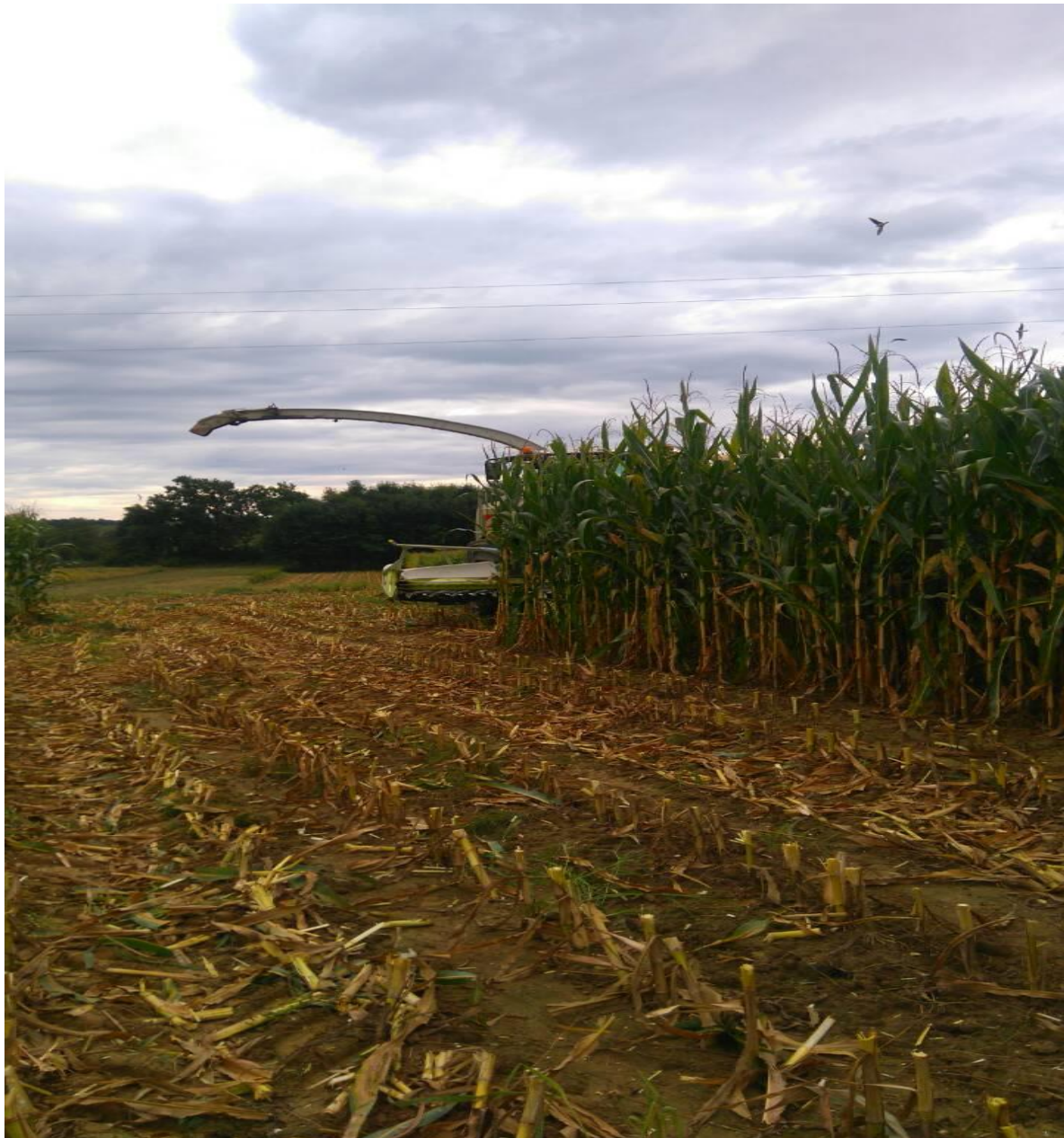
Slika16. Košnja kukuruza za silažu