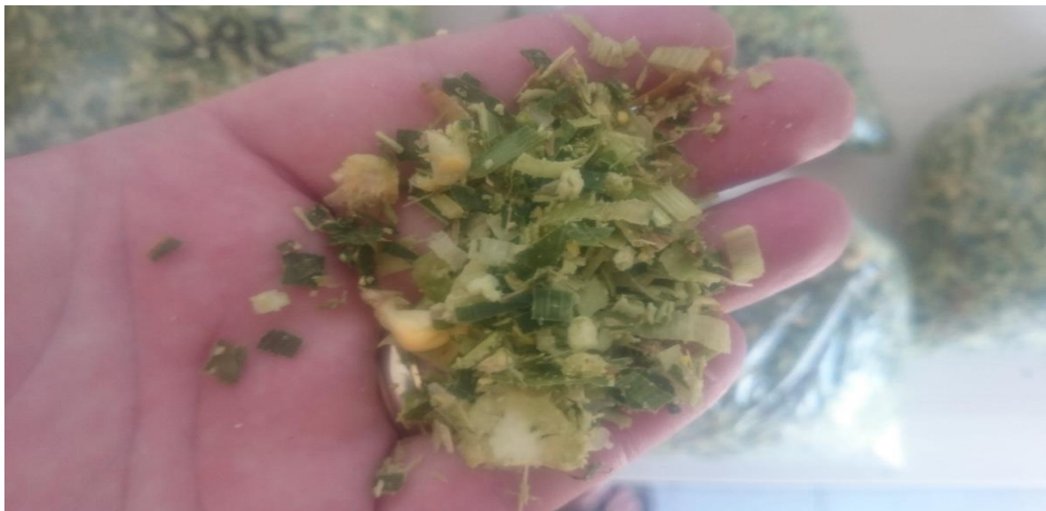
Slika 15. Sječka kukuruzne silaže

Na slici 14. možemo vidjeti presjek klipa kukuruza na taj način vizualnim pregledom se utvrđuje mliječna linija i eventualna spremnost za početak siliranja, a na slici 15. vidimo sječku kukuruzne silaže koja će biti podvrgnuta analizi suhe tvari, kako bi se utvrdilo stanje suhe tvari čitave stabljike i kako bi analizom mogli utvrditi početak kampanje siliranja silažnog kukuruza.