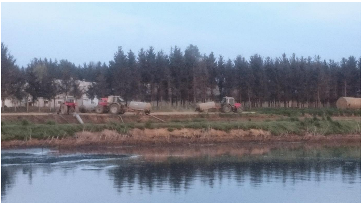
Slika 9. Odvoz digestata sa bioplinskog postrojenja Gradec