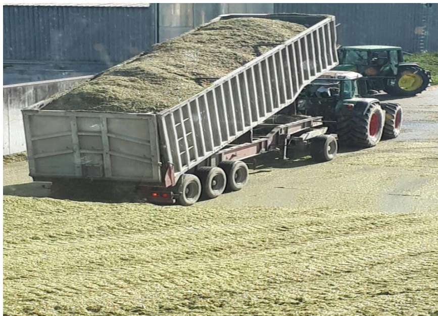
Slika 19. Istovar kukuruzne silaže na trenč silosu bioplinsko postrojenje Gradec