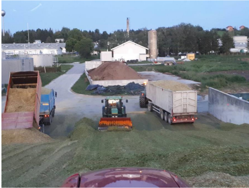
Slika 20. Istovar kukuruzne silaže na trenč silosu bioplinsko postrojenje Gradec

Na slici broj 20. možemo vidjeti kako se na trenč silosu bioplinskog postrojenja, istovaruje silažna masa čitave stabljike kukuruza iz kamiona i traktora sa prikolicama, te isto tako možemo vidjeti traktor sa ralicom za razguravanje silaže po trenč silosu i traktore koji gaze silažu na silosu.