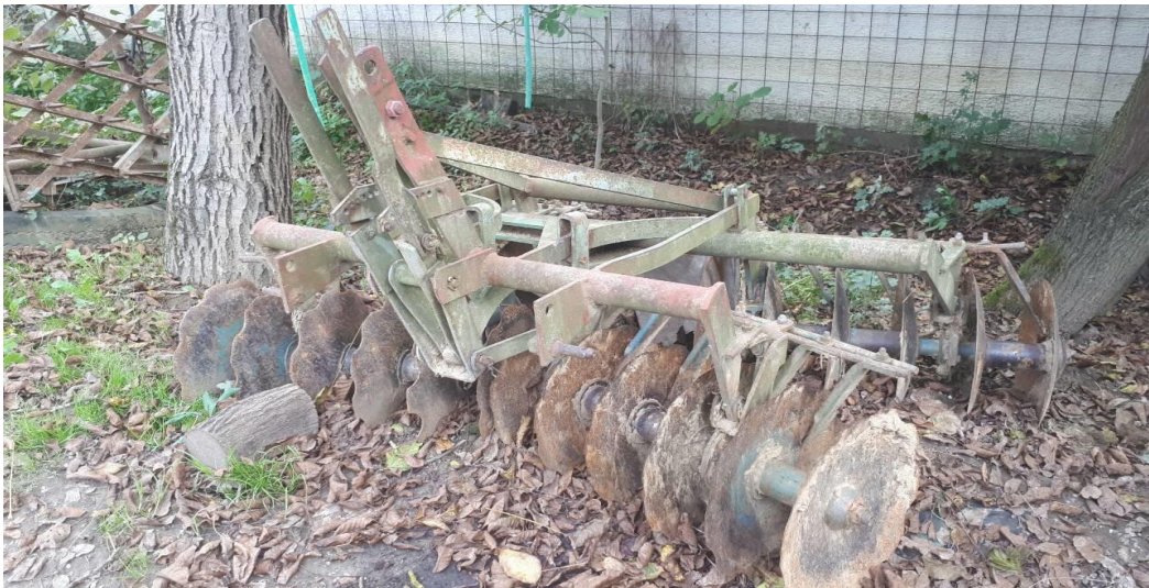
Slika 3. Tanjurače marke OLT 24 diska