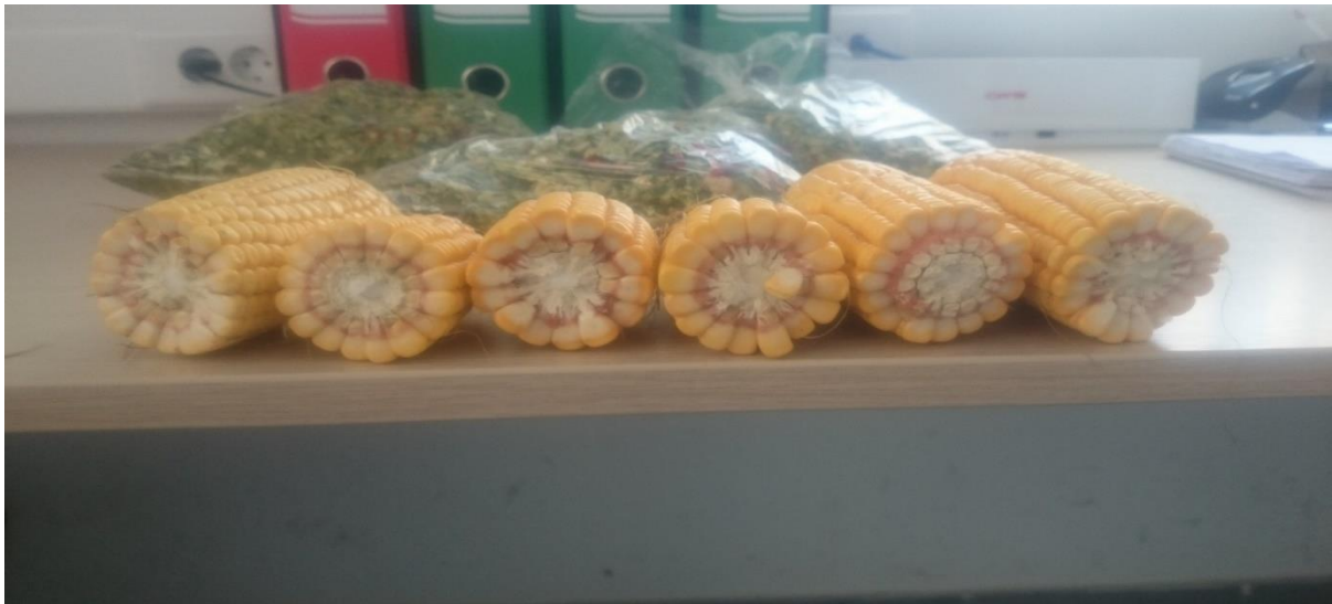
Slika 14. Presjek klipa kukuruza-utvrđivanje mliječne linije