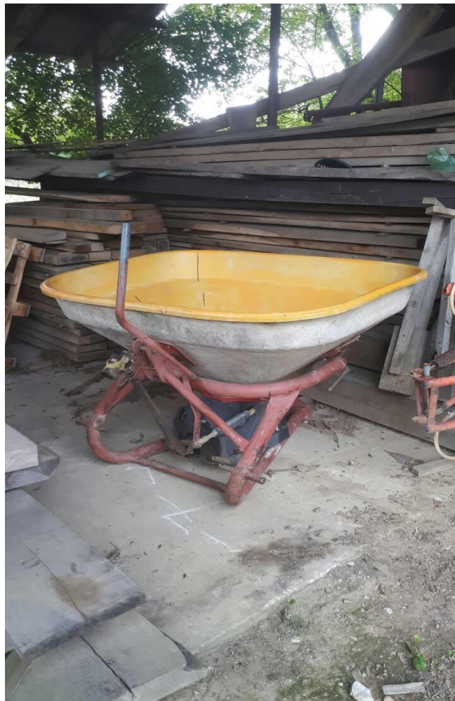
Slika 5. Rasipač za mineralno gnojivo