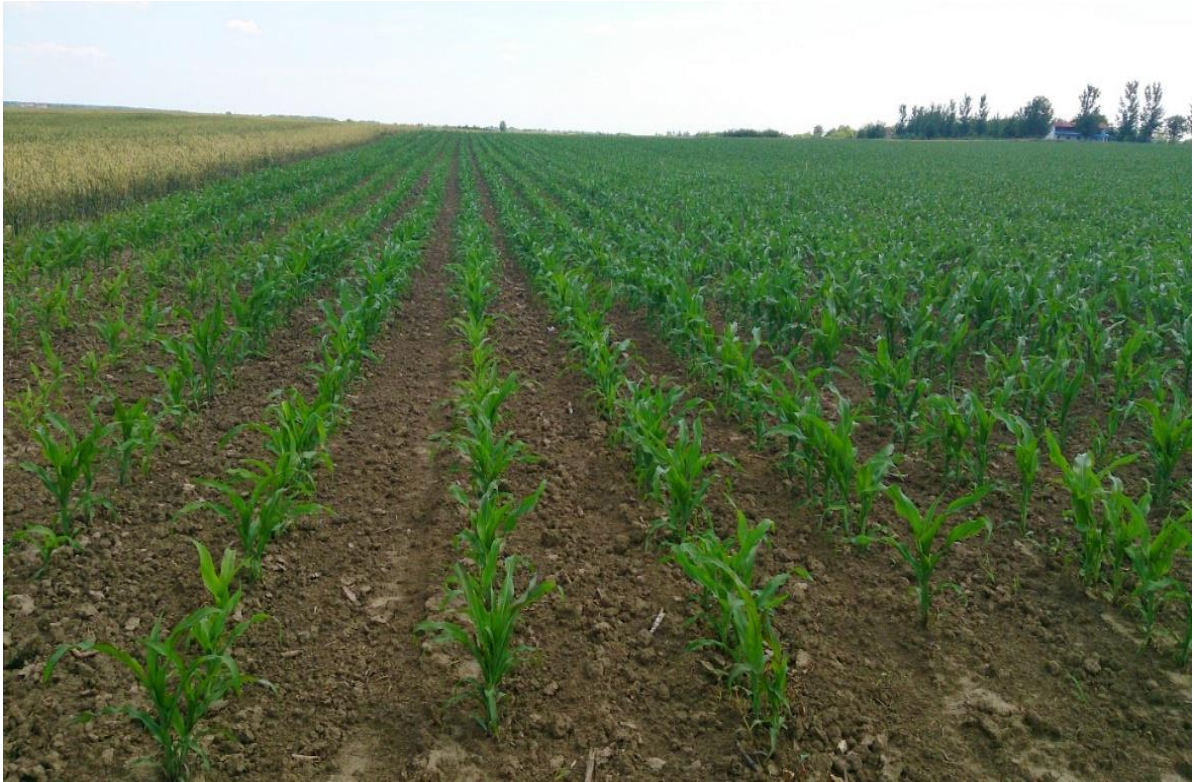
Slika 13. Kukuruz u porastu