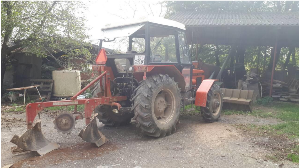
Slika 2. Plug marke IMT dvobrazni