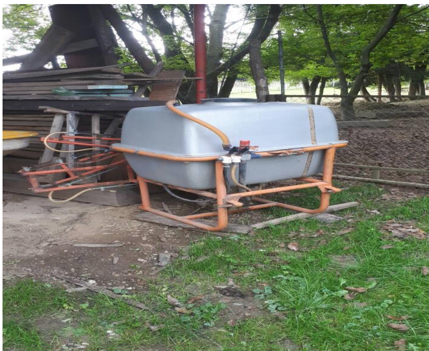
Slika 6. Prskalica KŽK Kranj 400 litara

Na slikama rednih brojeva od 1.-6. možemo vidjeti poljoprivrednu mehanizaciju koju posjeduje OPG Siniša Glatki i koja je korištena u materijalima i metodama provedenog pokusa.