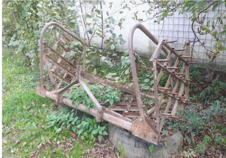
Slika 4. Drljača 4 metra širine