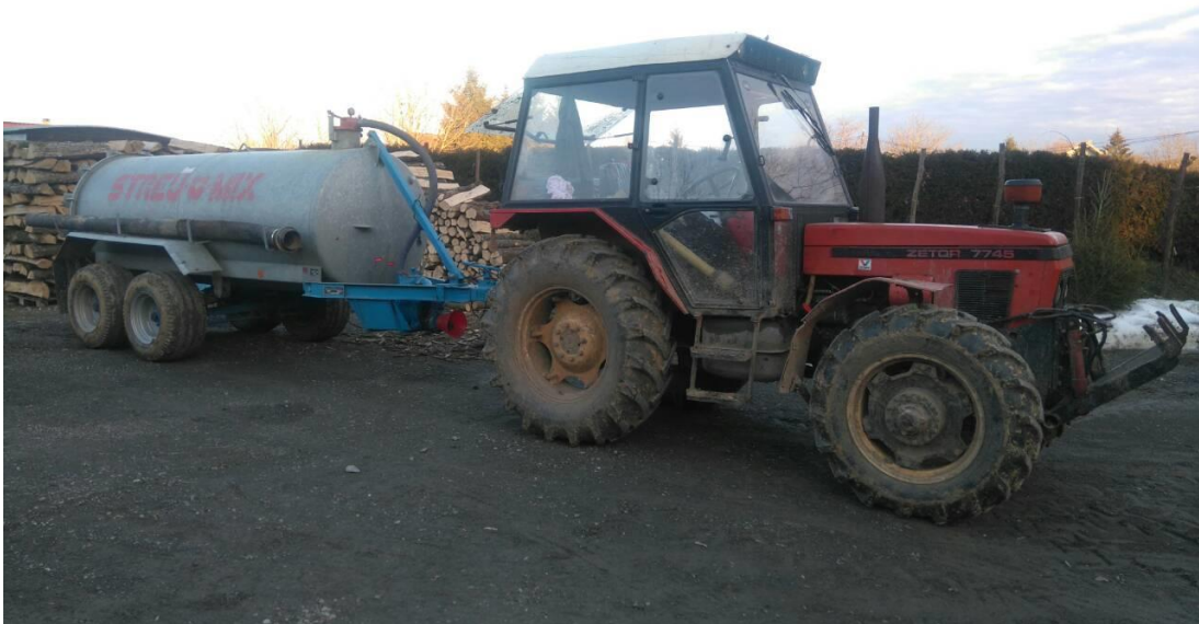
Slika 1. Traktor Zetor 7745 i cisterna Streu mix