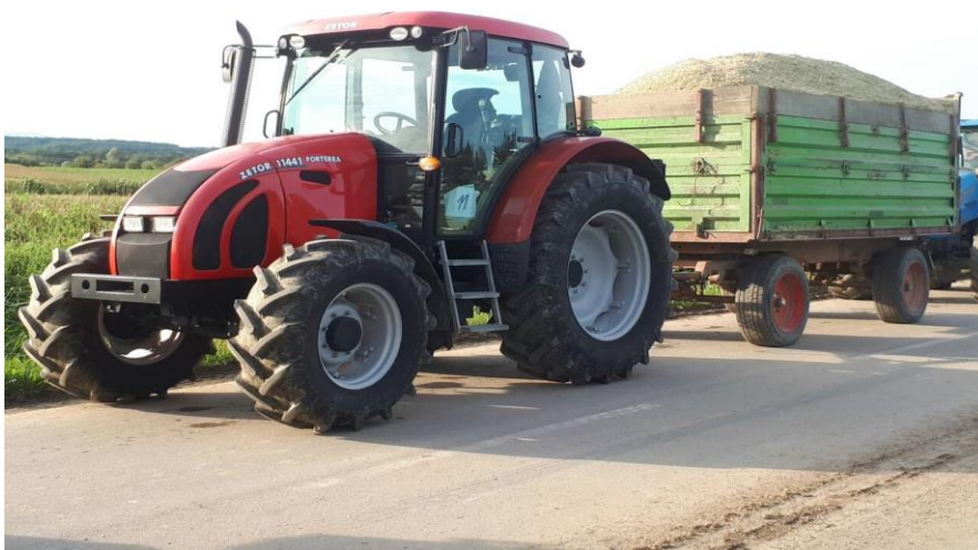
Slika 18. Čekanje na vaganje kukuruzne silaže bioplinsko postrojenje Gradec

Na slikama broj 16., 17.,18. i 19. vidimo cjelokupan logistički proces od siliranja kukuruza na njivi, dolaska traktora na njivu, čekanje traktora sa prikolicama na vagu bioplinskog postrojenja i istovara kukuruzne silaže na trenč silosu iz velikih „damper“ prikolica.