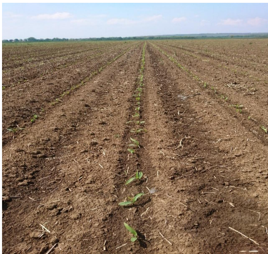
Slika 12. Nicanje kukuruza

U nicanju je bio ostvaren ravnomjerna sklop (Slika 12.).