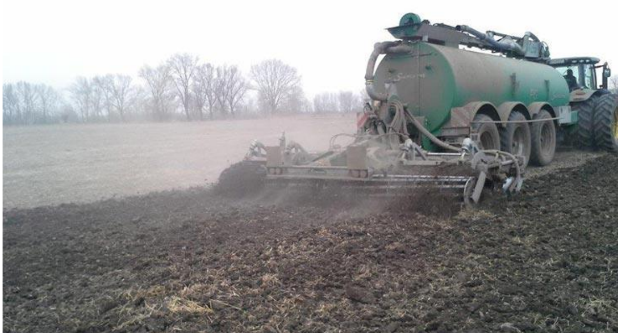
Slika 5. Gnojidba digestatom.

Gnojidba tla obavljena je u dvije ispitivane varijante: gnojidba mineralnim gnojivima i gnojidba digestatom. Kod obje varijante gnojidbe, gnojiva su primijenjena u proljetnom terminu (Slika 5).