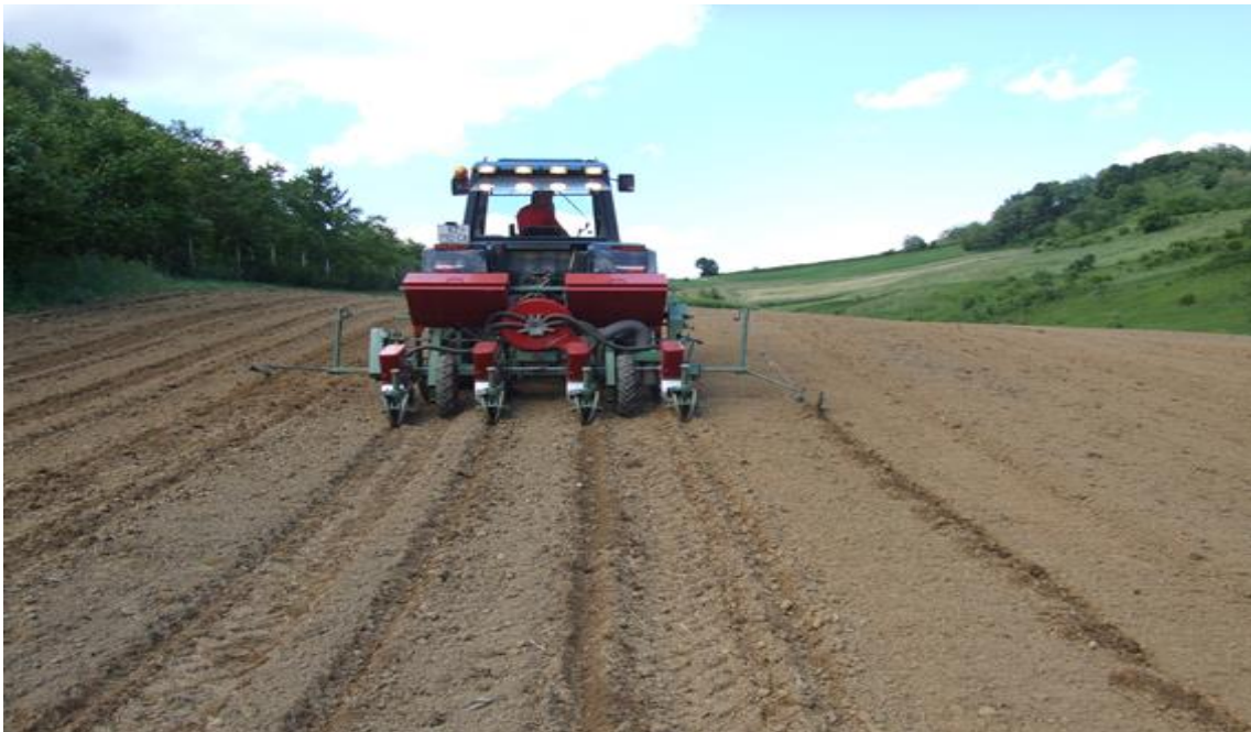
Slika 6. Sjetva sirka

Sjetva sirka (Slika 6.) obavljena je 10.05.2017.godine, četverorednom pneumatskom kukuruznom sijačicom, Gaspardo MTE. Međuredni razmak bio je 70 cm, a sijao se na razmaku unutar reda 5 cm. Ostvaren je sklop od 250 000 zrna/ha. Za sjetvu sirka korišten je hibrid Zerberus sjemenarske kuće KWS.