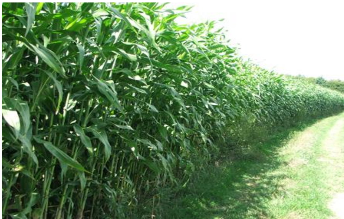
Slika 2. Nadzemna masa sirka

Prema kompilaciji literaturnih podataka o prinosima nadzemne mase sirka (Gantner i sur. (2017.)), prinosi su varirali pod utjecajem lokacije gdje je provedeno istraživanje i pod utjecajem razlike u vremenskim i klimatskim prilikama. Tako su u istraživanju Gantnera i sur. (2015.) prinosi suhe tvari nadzemne mase silažnih sirkova značajno su varirali ovisno o okolišnim uvjetima. Na lokaciji Dalj (istočna Hrvatska), unatoč kasnom roku sjetve (29. svibanj 2014.), kod jednokratne košnje u fazi voštane zrelosti zrna, ostvareni su visoki prinosi zahvaljujući iznimno povoljnim uvjetima: blago i kišovito ljeto i obilna osnovna gnojidba stajnjakom. U tim uvjetima, košnjom u fazi voštane zrelosti zrna, silažni sirak KWS Tarzan ostvario je prosječni prinos ST 28 t/ha, a sirak KWS Zerberus 24 t/ha, što je bilo više od kukuruza Drava 404 u istim uvjetima (22 t/ha ST). Prethodne godine, na istoj lokaciji, unatoč ranoj sjetvi 3. svibnja 2013., uslijed sušnoga ljeta i skromnije gnojidbe KWS Tarzan je dao prosječan prinos ST 17 t/ha, a KWS Zerberus 14,4 t/ha. U istim uvjetima silažni kukuruzi FAO skupine 500 dali su prinose 13 do 15,7 t/ha. Kod postrne sjetve (18. srpanj 2014.) i skromne gnojidbe u Tordincima (okolica Vinkovaca), KWS Tarzan dao je prosječni prinos 11,8 t/ha, a KWS Zerberus 9,4 t/ha ST (Slika 2.).