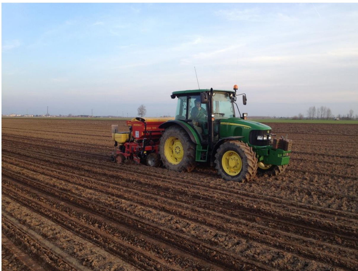
Slika 3. Četveroredna pneumatska kukuruzna sijačica.