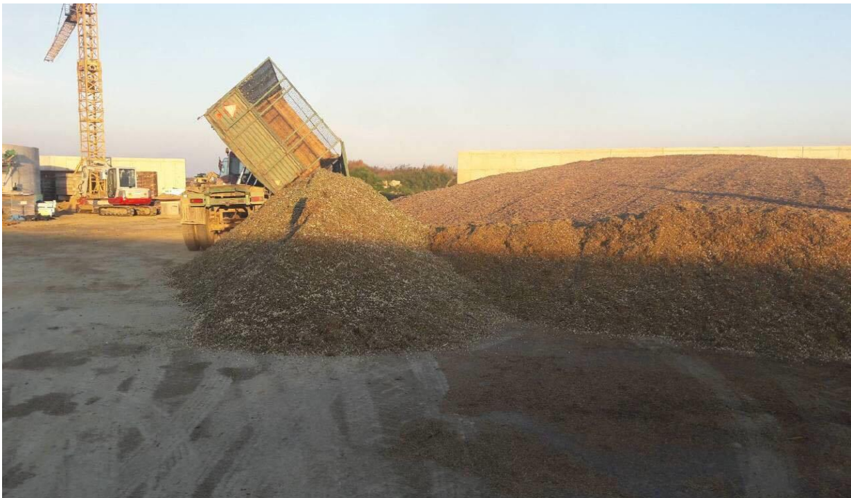
Slika 8. Spremanje nadzemne mase sirka

Pokošena nadzemna masa je isporučena u skladišni silos bioplinskog postrojenje (Slika 8.) na postupak siliranja i skladištenja do momenta ulaska u proces proizvodnje bioplina.