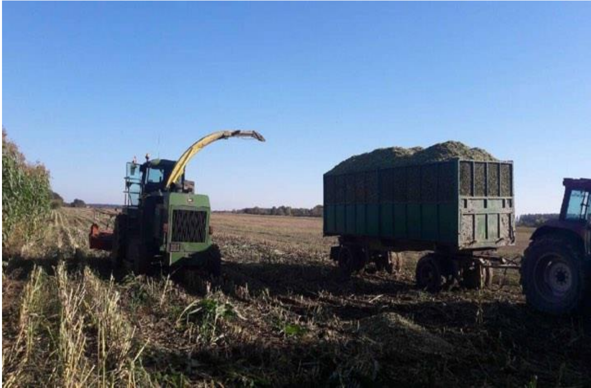
Slika 7. Košnja nadzemne mase

Pokošena nadzemna masa je isporučena u skladišni silos bioplinskog postrojenje (Slika 8.) na postupak siliranja i skladištenja do momenta ulaska u proces proizvodnje bioplina.