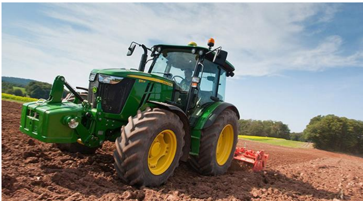
Slika 4. Obrada tla traktorom John Deere 5M