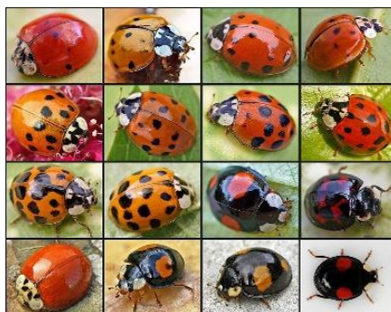
Slika 8. Razni pojavni oblici Harmonia axyridis Pallas