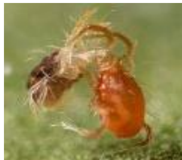
Slika 22. Phytoseiulus permisilis