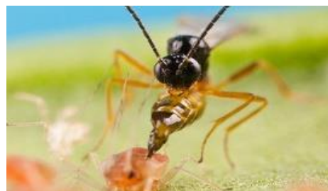
Slika 30. Aphidius matricariae