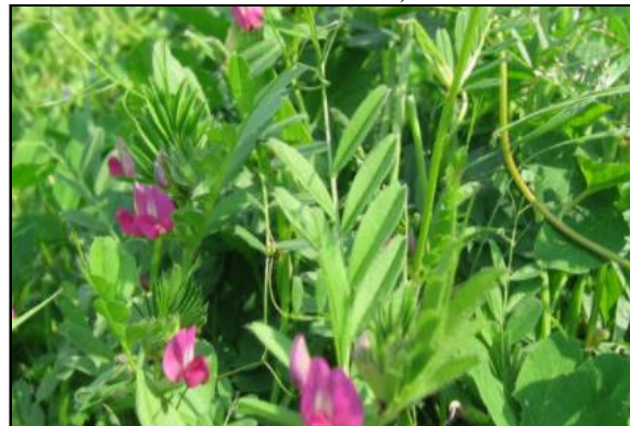
Slika 5. Grahorica