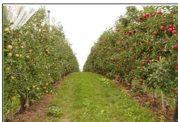
Slika 28. Zatravljivanje voćnjaka