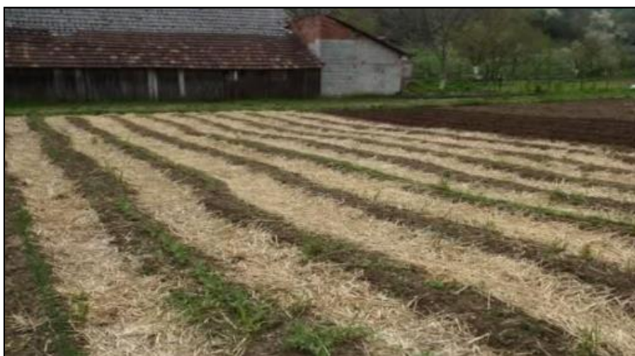
Slika 21. Malčiranje posliježetvenim ostacima

Za tu svrhu pogodni su usjevi iz roda Brassica : repica, gorušica i njihovi križanci – Rauola i Perko i dr. Kada usjevi za zelenu gnojidbu razviju dovoljno nadzemne mase, zaoravaju se zajedno sa slamom – malčem. Podrazumijeva se da je ovakav postupak sa slamom moguć jedino ako strnište u posliježetvenom razdoblju ostaje nezasijano, primjerice, ako se poslije pšenice uzgaja kukuruz, pa je tlo slobodno od srpnja do travnja iduće godine, odnosno ako tijekom ljeta bude dovoljno padalina za rast usjeva za zelenu gnojidbu (Slika 21).