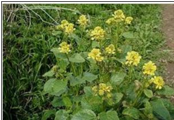
Slika 4. Gorušica