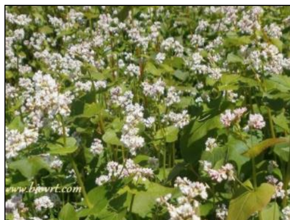
Slika 13. Heljda