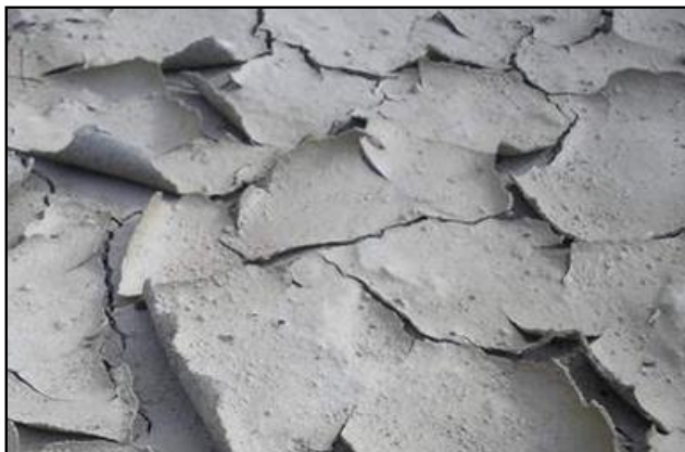
Slika 17. Izgled površine tla uslijed naglog isušivanja površinskog sloja, (Izvor: Bugarčić, 2013.)

Temperatura tla zaštićenog pokrovom od malča bit će ujednačena i time povoljna za rast i razvoj biljaka.