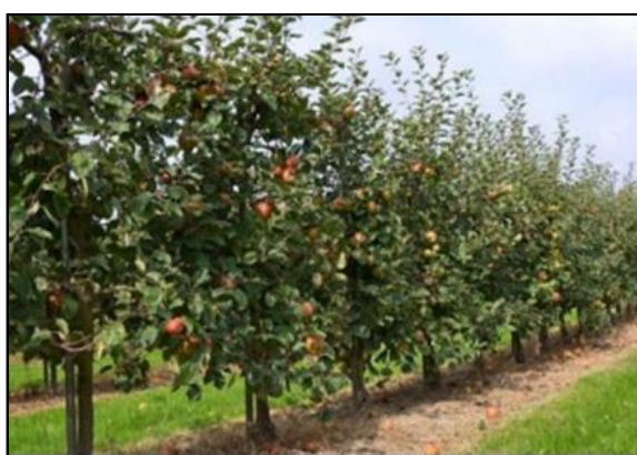
Slika 27. Zatravljivanje voćnjaka; (Izvor: http://agroinfotel.net/obrada-zemljista-u-voenjaku-ima-veliki-znacaj , 4.6.2017.)

Neki uzgajivači primjenjuju takav sustav održavanja voćnjaka u kojem se međuredni prostor zasije travom, a prostor između stabala ostavlja čistim, bez trave, što se postiže obradom pomoću bočnih freza. Košnja trave izvodi se 6 – 8 puta godišnje, odnosno u vrijeme kada trava narasta do visine 10 – 15 cm. Obavlja se rotacijskim kosačicama ili malčerima. Pokošena trava ostaje na mjestu ili se njome popunjava redni prostor oko stabala. Prednost ovog načina obrade jest u tome što omogućuje stabilniji vodozračni režim zemljišta, a praktična se strana sastoji u mogućnosti primjene mehanizacije tijekom cijele godine. Nedostaci se sastoje u troškovima formiranja travnog pokrivača sjetvom trave, te u naseljavanju raznih štetnika, glodavaca, koji vole obitavati u travnatom prostoru.