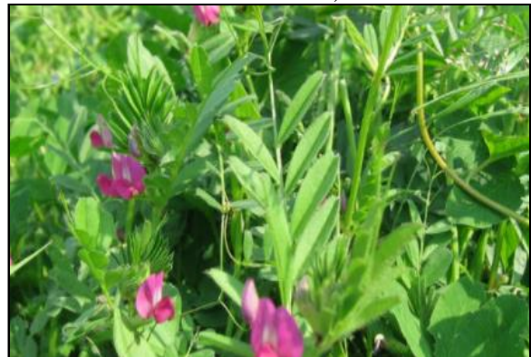
Slika 5. Grahorica