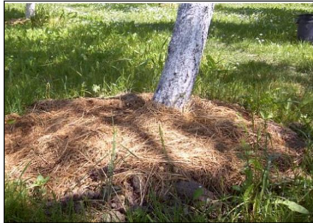
Slika 29. Organsko malčiranje voćaka u vruće dane

Malč ublažava variranje temperature tla, tj. temperaturne razlike između dana i noći, te ljeta i zime. Zato je malčiranje vrlo korisno na toplijim južnijim položajima i u kontinentalnim zonama gdje su temperaturne razlike vrlo visoke i gdje se tlo duboko smrzava. Ispod malča tlo je po danu hladnije, a po noći i zimi znatno toplije nego što je to pri ostalim sustavima odr-