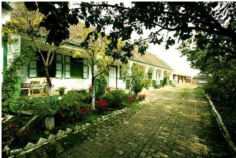
Slika 17. Sklepićeva "stara kuća", uređena za pružanje smještaja gostima

Gospodarstvo se sastoji od dva objekta: Panonske kuće iz 1910. godine, u kojoj se nude usluge noćenja u sedam dvokrevetnih soba, te seljačkog gospodarstva iz 1897. godine, u kojem je gospodin Sklepić tradicionalno uredio oveću sobu za izlaganje etno zbirke – oko 200 predmeta, zatim radionicu lončarstva, krušnu peć, tkalački stan, špajzu, „garavu“ kuću, štalu, čardak, pajtu, podrum, kovačnicu, opremu za konje i same konje, te duboki baranjski podrum s bačvama domaćeg vina i rakije.