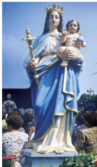
Slika 14. Kip Gospe od Utočišta u Crkvi u Aljmašu