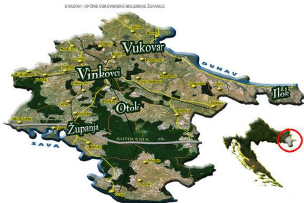
Slika 2. Vukovarsko-srijemska županija

Prostor Županije obuhvaća dio slavonsko-srijemskog međurječja na rubu Panonske nizine (Slika 2.). To je ravnica iz koje se središnjim prostorom dižu uzvišenja diluvijalnog prapora. Reljefno se ističu dva odvojena uzvišenja: vinkovačko-đakovački ravnjak i vukovarski ravnjak, koji istovremeno predstavljaju razvodnicu Dunava, tj. Vuke i Save. Đakovački ravnjak je nastavak slavonskog gorja i dopire sve do Vinkovaca. Vukovarski ravnjak se širi prema istoku do crte Šarengrad-Bapska-Šid, odakle počinje Fruška Gora. Sjeverno i južno od ravnjaka prostiru se doline s razgranatom riječnom mrežom. Nadmorska visina prostora Županije se kreće od 78 – 204 m, pa je visinska razlika 126 m. (Medić, 2006.).