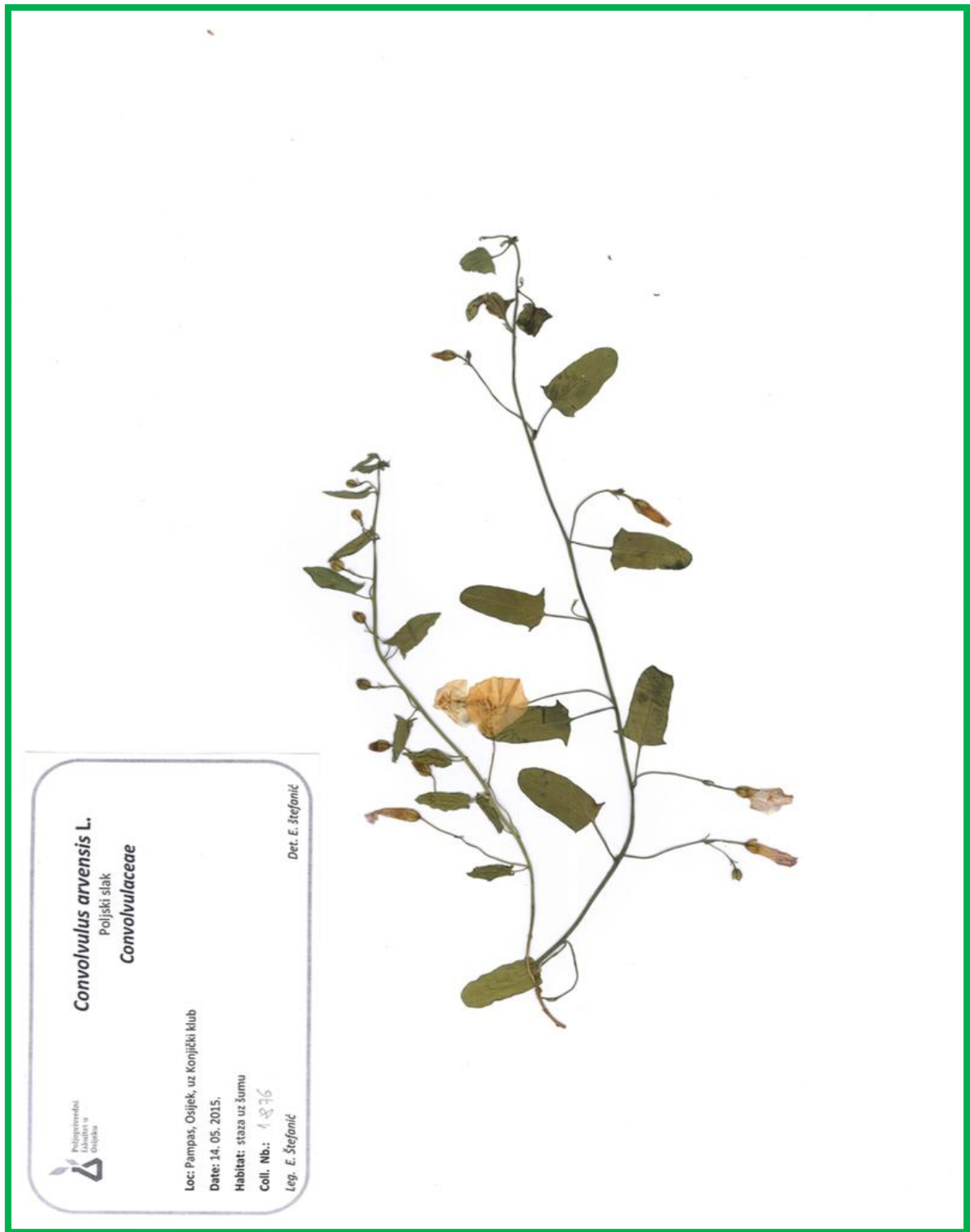
Slika 11. Convolvulus arvensis (L.) Pers.