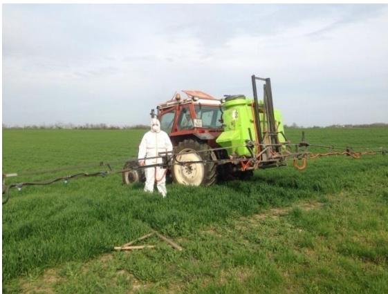
Slika 3. Priprema za kemijsko tretiranje

U veljači 2014. godine je u prihrani dodano 86 kg/ha uree. U proljeće, nakon busanja pšenice, kada su širokolisni korovi razvili 2 – 6 listova, izvršeno je i kemijsko tretiranje herbicidom Mustang na bazi 2,4 - D + florasulama, namijenjenim za suzbijanje širokolisnih korova. Herbicid je primijenjen u dozi od 0,5 l/ha, uz utrošak vode od oko 210 l/ha (Slika 3. i 4.).