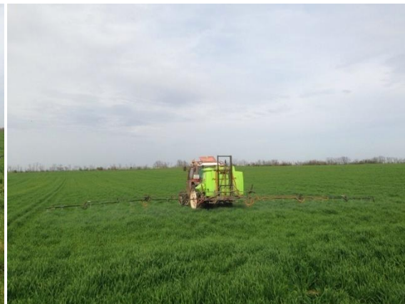
Slika 4. Izvođenje kemijskog tretiranja

Nakon toga je u prihrani dodan KAN u količini od oko 136 kg/ha.