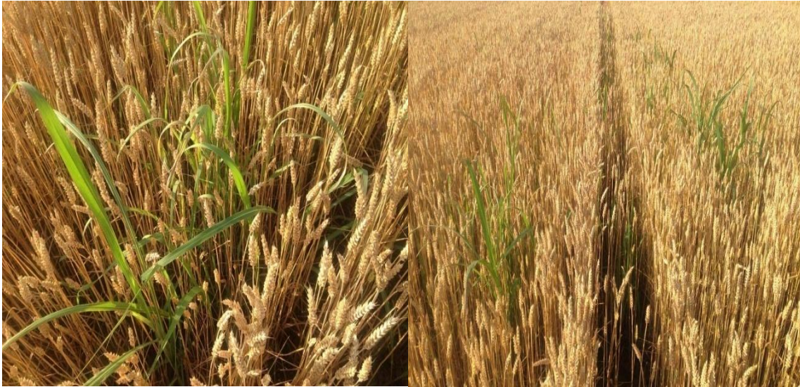
Slika 5. Divlji sirak u pšenici