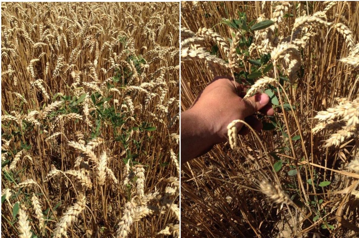
Slika 7. Broćika i slak u pšenci