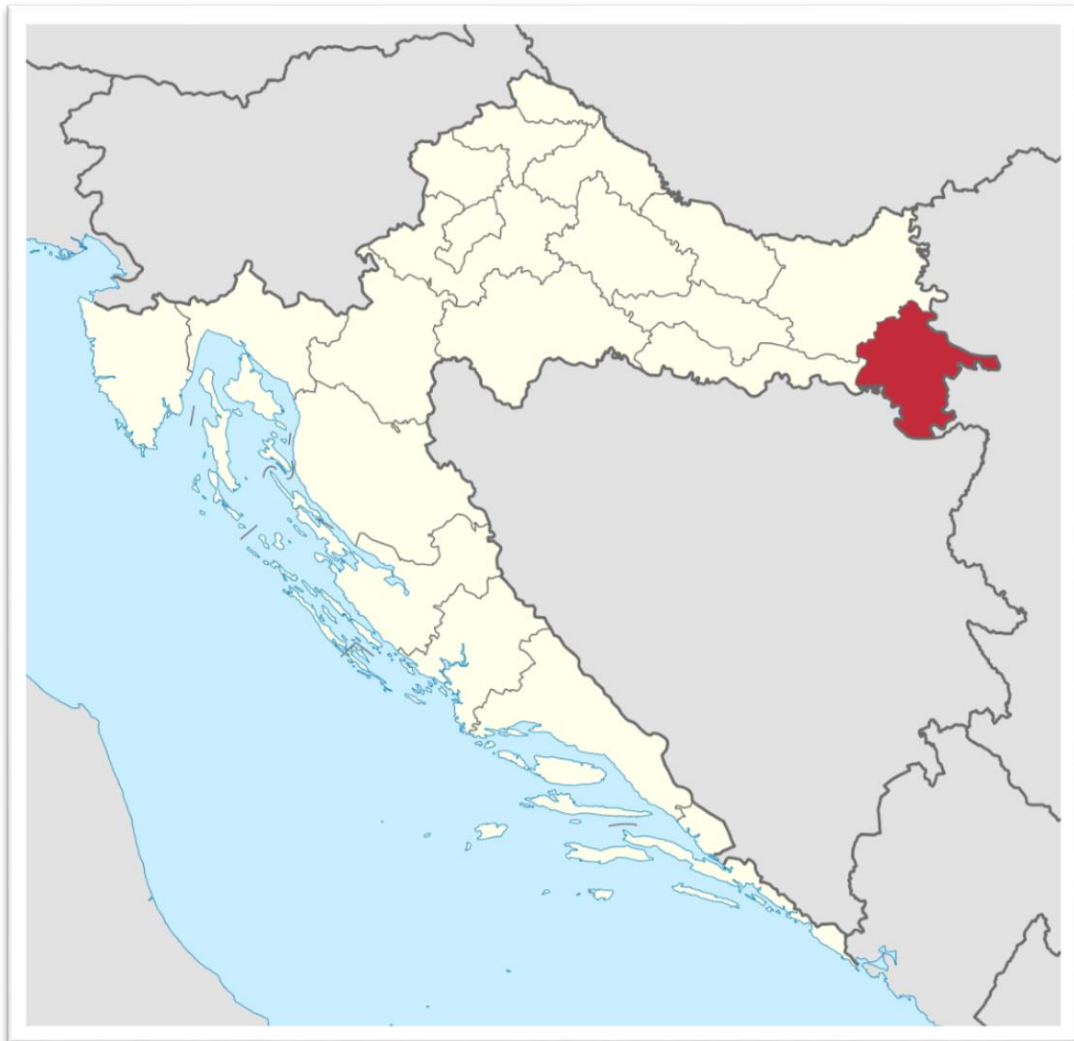
Slika 1. Položaj Vukovarsko-srijemske županije u Republici Hrvatskoj

Vukovarsko-srijemska županija je najistočnija županija Republike Hrvatske. Prostire se na površini od 2445 km 2 dijelom u Istočnoj Slavoniji, dijelom u Zapadnom Srijemu, između rijeke Dunava i Save (Slika 1.). Na sjeveru graniči s Osječko-baranjskom županijom, a na zapadu s Brodsko-posavskom. Istočna granica sa Srbijom i južna granica s BiH ujedno su i državne granice Republike Hrvatske (Medić, 2006.).