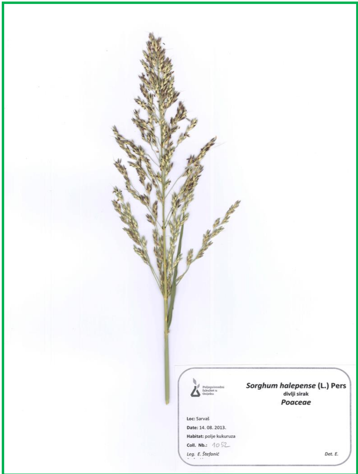
Slika 10. Sorghum halepense (L.) Pers.