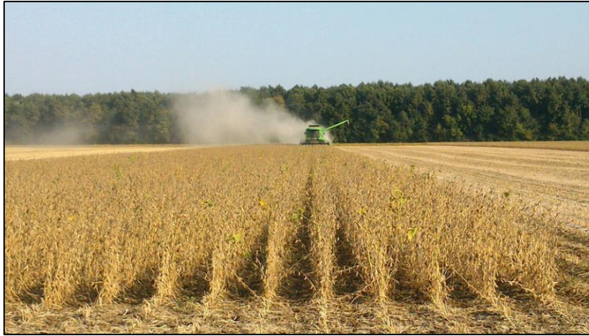
Slika 6. Usjev soje u žetvi

Korovi koji su detriminirani u usjevu soje: A. theophrasti , A. retroflexus , A. artemisiifolia , C. album , C. arvensis , D. stramonium , P. lapathifolium , S. glauca , S. viridis , S. halepense i S. nigrum . Detriminacija korovnih vrsta u usjevu utvrđena je na osnovi broja korova, dva puta u sezoni. Uzorci korovnih biljaka za botaničku analizu uzeti su s površine od 0,25 m 2 na četiri slučajno odabrana mjesta u svakoj pokusnoj parcelici, tj. ukupno 16 mjesta ili ponavljanja za svaku varijantu u pokusu. U Laboratoriju za fitofarmaciju Poljoprivrednoga fakulteta u Osijeku su korovne vrste determinirane prema odgovarajućim priručnicima (Domac, 1984; Čanak i sur., 1978; Knežević, 1988.), a nomenklatura vrsta utvrđena je prema Ehrendorfer-u (1973.).