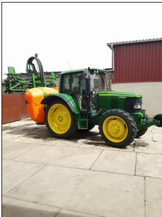
Slika 3. Prskalica Amazone UF 901

Sjetva je obavljena 28.04.2017. godine (slika 1.) sa pneumatskom sijačicom marke Gaspardo, a sorta sjemena bila je Ika, sorta Poljoprivrednog instituta Osijek. Odmah nakon sjetve izvršena je zaštita prije nicanja (slika 2.). Zaštita je obavljena prskalicom Amazone UF 901 (slika 3.), a djelatna tvar je bila metribuzin u količini od 0,5 kg/ha. Nakon tretiranja je ubrzo palo 15 mm oborina što je pospješilo djelovanje sredstva (slika 4.).