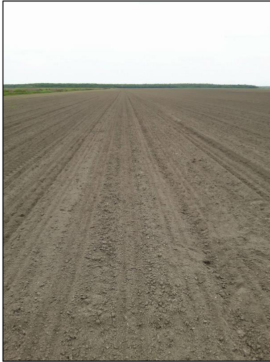
Slika 1. Usjev nakon sjetve soje