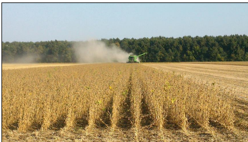
Slika 6. Usjev soje u žetvi

Korovi koji su detriminirani u usjevu soje: A. theophrasti , A. retroflexus , A. artemisiifolia , C. album , C. arvensis , D. stramonium , P. lapathifolium , S. glauca , S. viridis , S. halepense i S. nigrum . Detriminacija korovnih vrsta u usjevu utvrđena je na osnovi broja korova, dva puta u sezoni. Uzorci korovnih biljaka za botaničku analizu uzeti su s površine od 0,25 m 2 na četiri slučajno odabrana mjesta u svakoj pokusnoj parcelici, tj. ukupno 16 mjesta ili ponavljanja za svaku varijantu u pokusu. U Laboratoriju za fitofarmaciju Poljoprivrednoga fakulteta u Osijeku su korovne vrste determinirane prema odgovarajućim priručnicima (Domac, 1984; Čanak i sur., 1978; Knežević, 1988.), a nomenklatura vrsta utvrđena je prema Ehrendorfer-u (1973.).