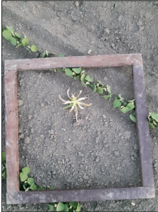
Slika 4. Stanje usjeva nakon tretiranja