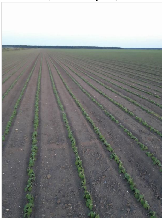
Slika 5. Usjev nakon nicanja

Žetva je obavljena 20. rujna 2017.(slika 6.), a prosječni prinos zrna soje iznosio je 3,3 t/ha.