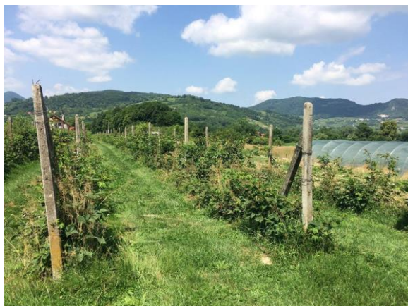
Slika 10. Stari kupinjak iz 1991. godine

Proizvodnju kupina započeli su davne 1991. godine, a znak za ekološki proizvod dobili su 2007. godine (Slika 10). Trenutnu proizvodnju rade na dva kupinjaka od čega je jedan veličine 0,20 ha, a drugi 1,20 ha.