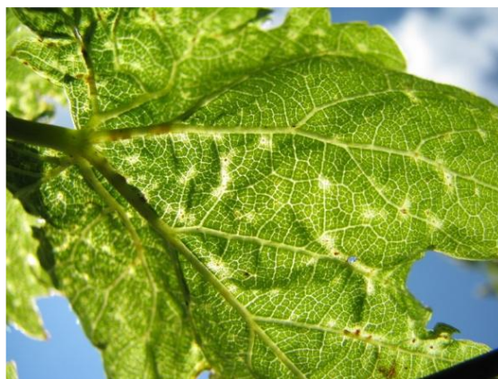
Slika 12. Lozina grinja – uzročnik akarinoze