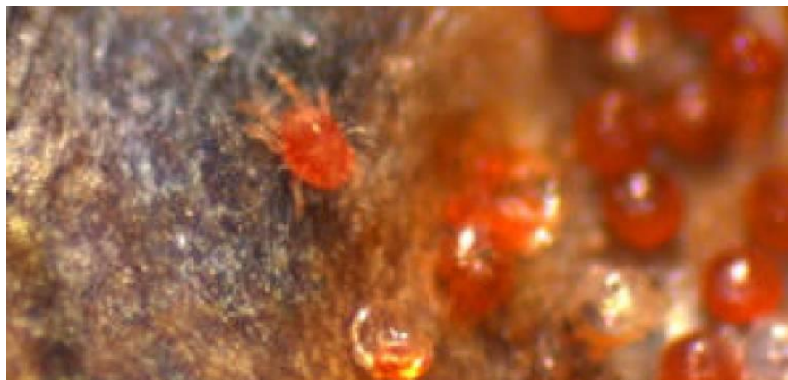
Slika 10. Imago i jaja crvenog voćnog pauka

Preporuča se zimsko prskanje kada se na jednom dužnom metru nađe 500 – 1000 jaja. U vrijeme razvoja izboja, suzbija se kada je već zaraženo 60 - 70% listova, a ljeti 30 – 45% listova (Brmež i sur., 2010.).