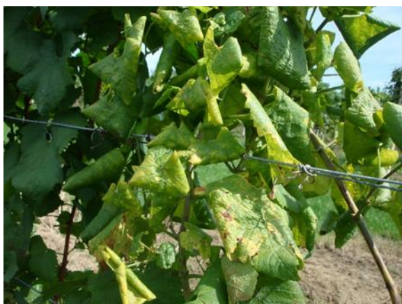
Slika 7. Fitoplazma na bijelim sortama

ZAŠTITA: najefikasnije rješenje uklanjanje zaraženih trsova, suzbijanje vektora, kemijskim, mehaničkim ili biološkim mjerama, suzbijati i kontrolirati korove koji su domaćini fitoplazmi, sadnja zdravog i certificiranog sadnog materijala i naravno saditi manje osjetljive sorte (Kozina i sur., 2008.).