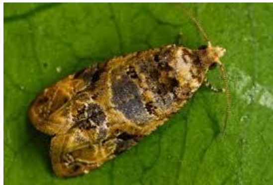
Slika 16. Žuti grozdov moljac

Moljci ne napadaju sve sorte u jednakoj mjeri, kao indikator napada žutog grozdovog moljca koristi se Muškati Hamburg koji je osjetljiva sorta (Licul i Premužić, 1982.).