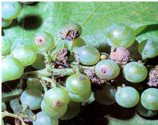
Slika 15. Šteta od pepeljastog groždanog moljca