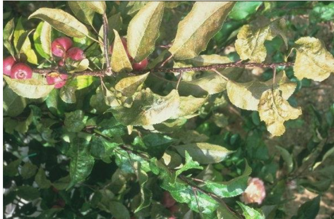
Slika 11. Razlika u boji zdravog i zaraženog lišća