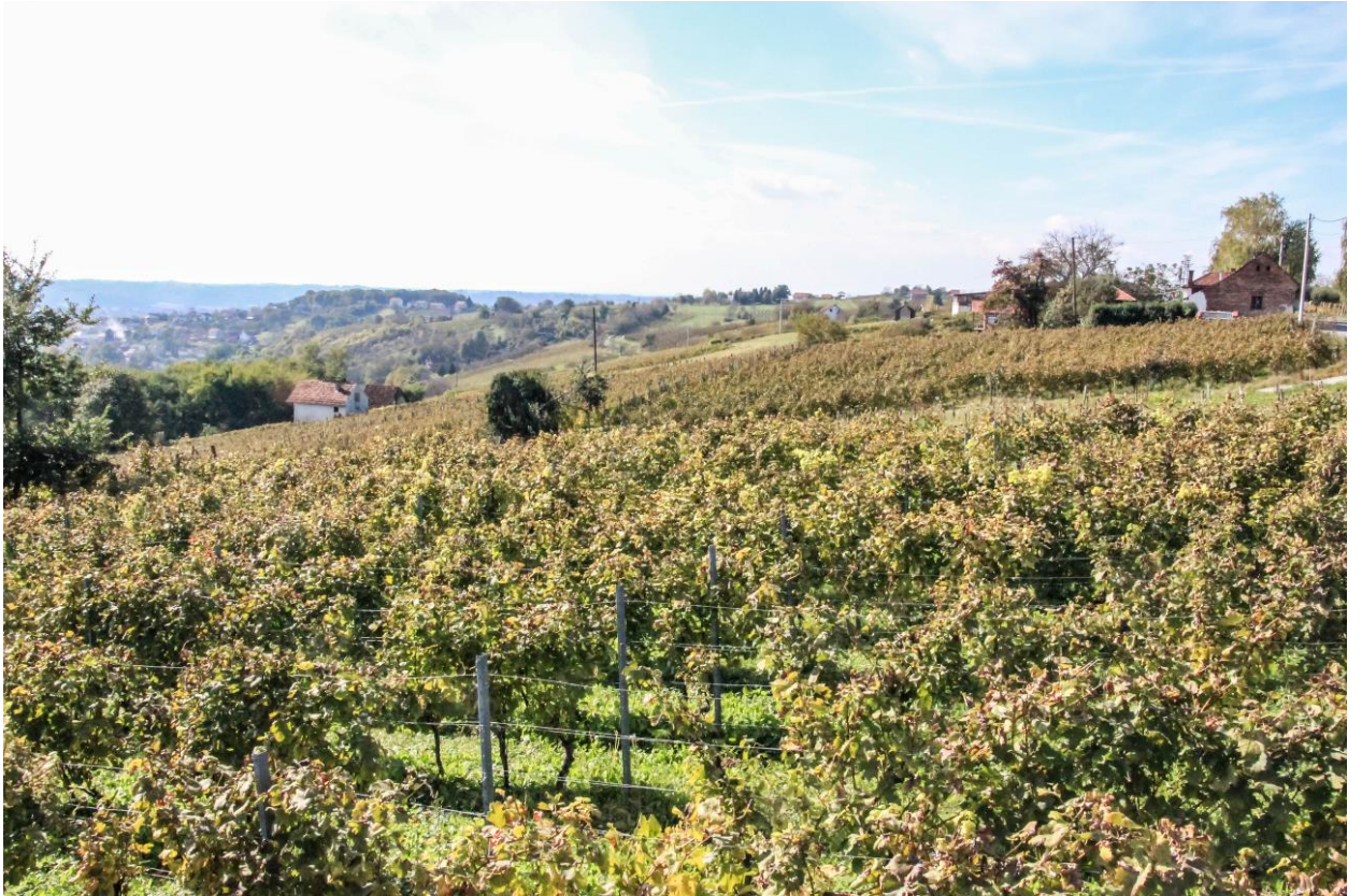
Slika 1. Vinograd OPG-a Klečka