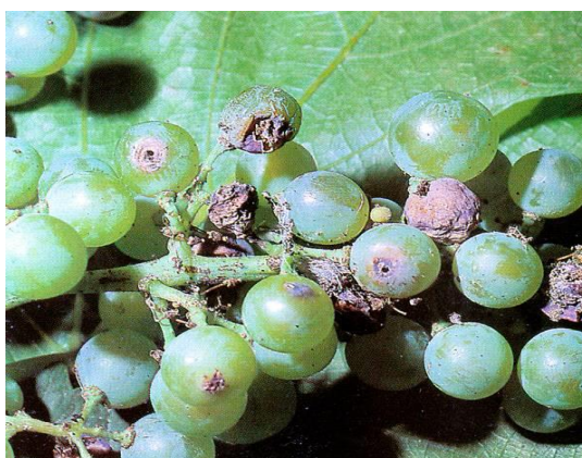
Slika 15. Šteta od pepeljastog groždanog moljca