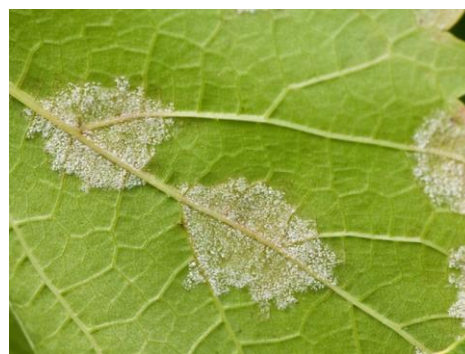
Slika 3. Bjeličasta prevlaka

ZAŠTITA: pri odabiru sorti treba birati one koje su otporne na plamenjaču. Oni vinogradi koji su na nagnutijim terenima, južnim i sunčanim ekspozicijama imaju predispozicije da budu manje napadnuti. Povoljnija su mjesta gdje su brže zračne struje. Trebalo bi plijeviti mladice, zalamati zaperke prvi put i drugi, a u doba drugog zalamanja i vršikanja je najčešće list napadnut, zato skidamo vrškove i odstranjujemo zaražene listove.