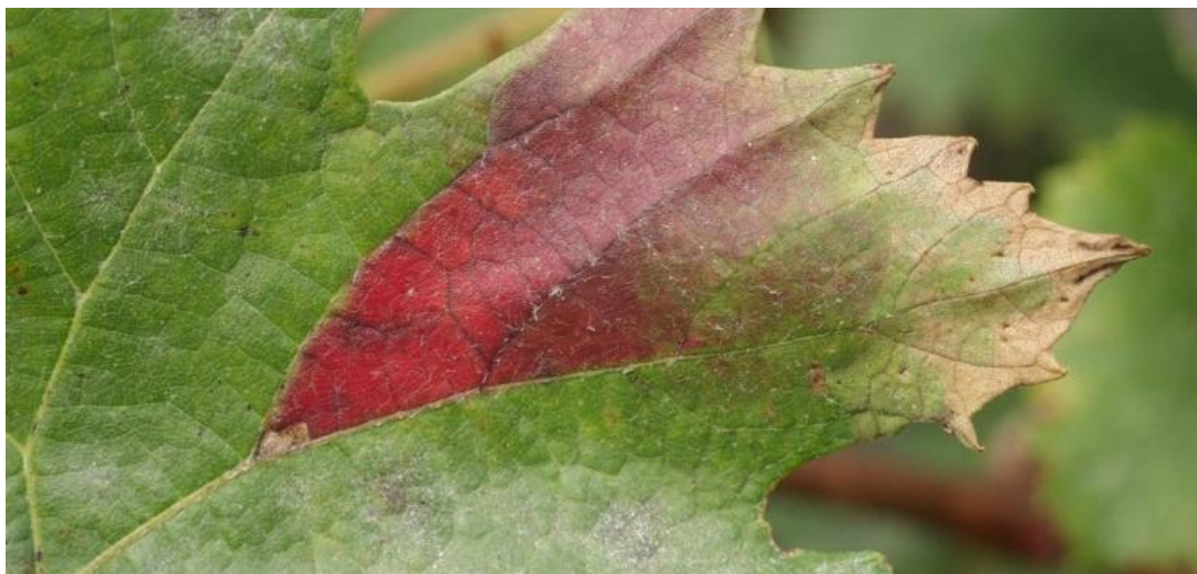
Slika 9. Crvena palež na listovima vinove loze

SIMPTOMI: Pojavljuju se žućkaste pjege, kod bijelih sorti kasnije posmeđe, kod crnih postaju tamno crvene. Lišće se suši, a zatim otpadne.