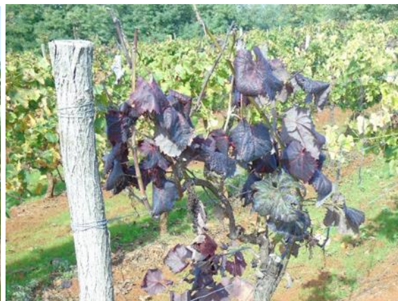
Slika 8. Fitoplazma na crnim sortama