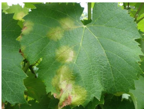
Slika 2. Plamenjača na listu vinove loze

BIOLOGIJA: prezimljava u obliku oospora koje mogu preživjeti do -25\text{ }^{\circ}\text{C} čak 5 dana. Postoji pravilo "3 desetke" - ako su mladice duge 10 cm, a palo je 10 mm kiše u 24-48 h i to na temperaturi od najmanje 10\text{ }^{\circ}\text{C} može doći do zaraze. Kiša izbaci oospore na listove te se razvijaju zoospore, a list mora biti 2-3 cm, tada su razvijene i otvorene puči na njemu.