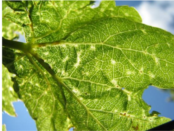
Slika 12. Lozina grinja – uzročnik akarinoze