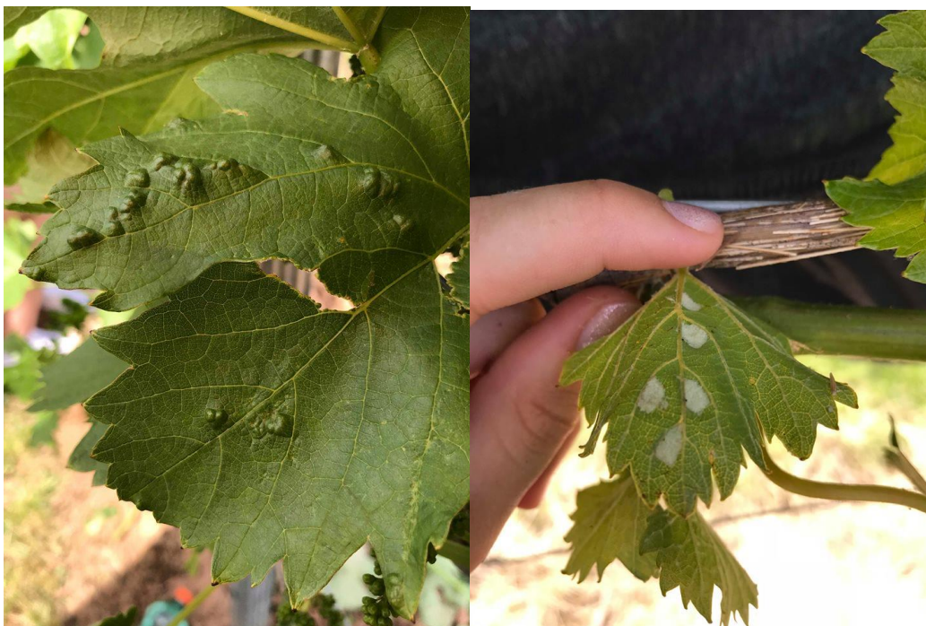
Slika 13. Simptomi erinoze

Drugi rok prskanja je kada grinje prelaze iz pupova na mlađe izboje. Tada se koriste pripravci na bazi fenazakvina, etoksazola, abamektina.