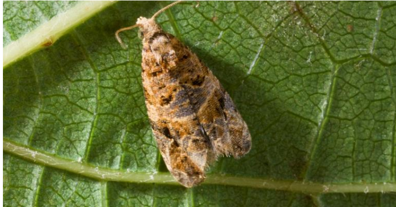
Slika 14. Pepeljasti grozdov moljac

generaciju gusjenica što više, da druga bude manja. Prednost treba dati onim insekticidima koji ne povećavaju mogućnost pojave crvenog pauka i poštedeju prirodne neprijatelje.