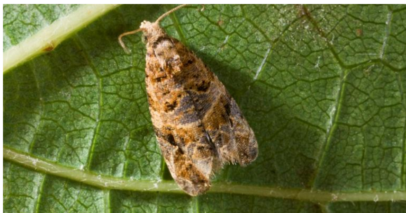
Slika 14. Pepeljasti grozdov moljac

generaciju gusjenica što više, da druga bude manja. Prednost treba dati onim insekticidima koji ne povećavaju mogućnost pojave crvenog pauka i poštedeju prirodne neprijatelje.