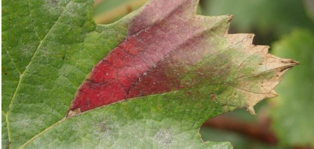
Slika 9. Crvena palež na listovima vinove loze

SIMPTOMI: Pojavljuju se žućkaste pjege, kod bijelih sorti kasnije posmeđe, kod crnih postaju tamno crvene. Lišće se suši, a zatim otpadne.