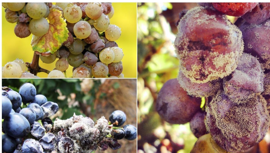
Slika 5. Siva plijesan vinove loze