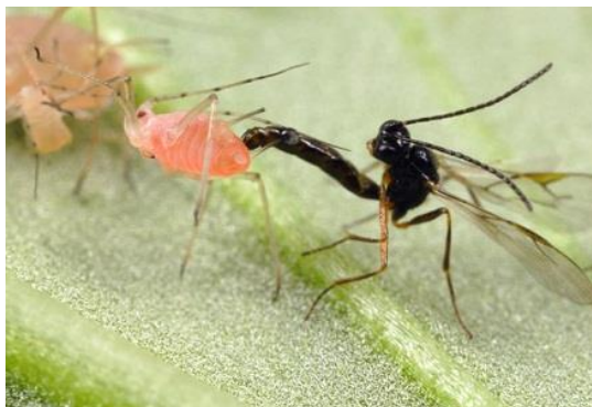
Slika 14. Vrsta iz porodice Braconidae. (Foto:

navode ove vrste te vrstu Aphidius hieraciorum Starý kao značajne u suzbijanju lisnih ušiju, posebice zelene breskvine uši i lisnih ušiju na salati i dinji u Španjolskoj.