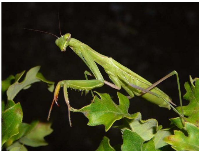
Slika 13. Bogomoljka, M. religiosa.