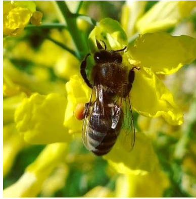
Slika 1. Medonosna pčela na kupusnjači