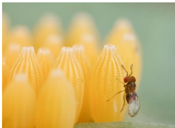
Slika 15. Trichogramma evanescens.