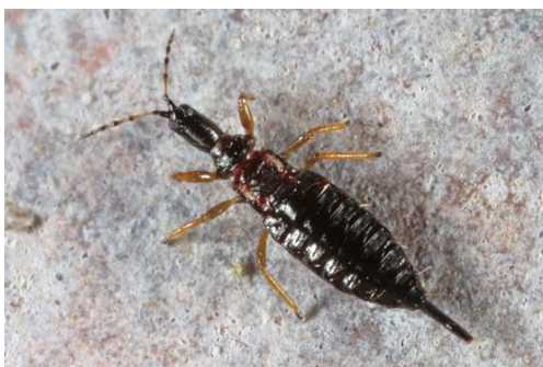
Slika 11. Resičar L. mali