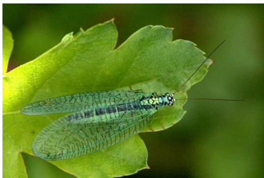
Slika 12. Mrežokrilka, vrsta C. perla .