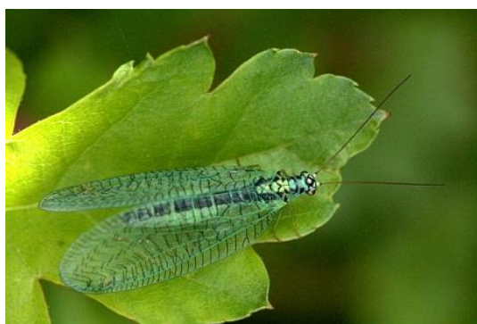
Slika 12. Mrežokrilka, vrsta C. perla . (Foto:

http://www.commanster.eu/commanster/Insects/Misc/Neuroptera/Chrysopa.perla.html ;