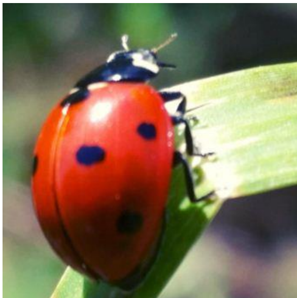
Slika 4. Božja ovčica C. septempunctata .

u Hrvatskoj je prvi put utvrđena 2010. godine. Međutim, pokazala se izrazito polifagna i proždrljiva. Duga je 6 – 8 mm, a napada gotovo sve vrste kukaca koje su manje od nje pa tako i ličinke autohtonih vrsta božje ovčice.