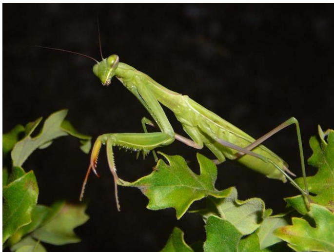
Slika 13. Bogomoljka, M. religiosa.