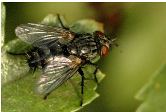
Slika 9. Muha gusjeničarka E. larvarum . (Foto:

Vrste Exorista larvarum L. i Compsilura concinata Meigen. parazitiraju gusjenice više od 90 vrsta leptira, ali prvenstveno gusjenice kukuruznog moljca i sovica. Vrste Lydella stabulans grisea L. i Lydella thompsoni Herting poznati su paraziti kukuruznog moljca, a vrsta Voria ruralis Fall parazitira gusjenice sovice gama ( Autographa gamma L.) (Oštrec i Gotlin Čuljak, 2005.). Prema Igrc Barčić i Maceljski (2001.) vrsta Doryphorophaga doryphorae Riley uzgaja se i ispušta u pokusne svrhe za suzbijanje krumpirove zlatice.