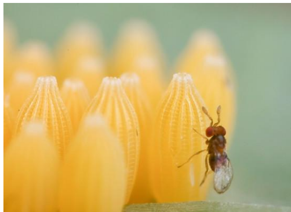
Slika 15. Trichogramma evanescens.