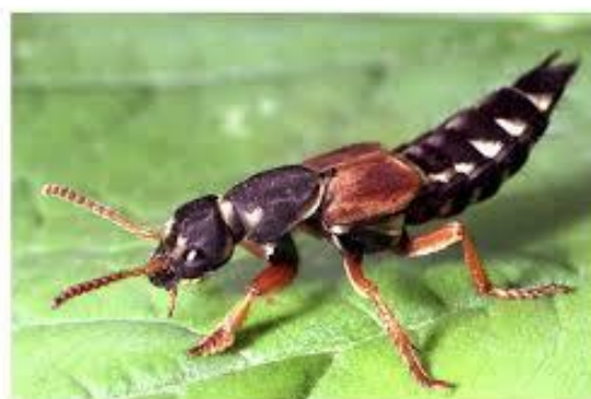
Slika 6. Kusokrilac, D. coriaria.