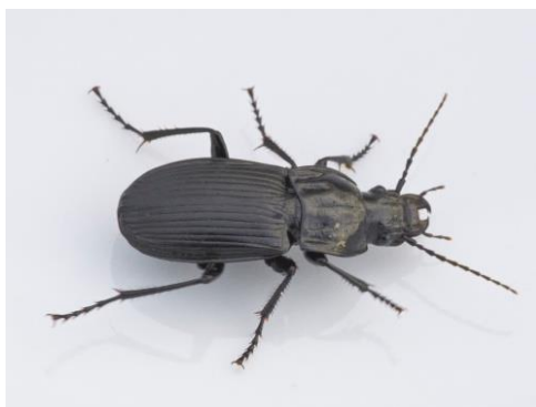
Slika 5. Trčak, Pterostichus niger