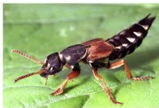
Slika 6. Kusokrilac, D. coriaria.