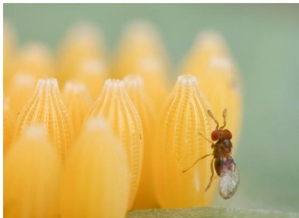
Slika 15. Trichogramma evanescens.