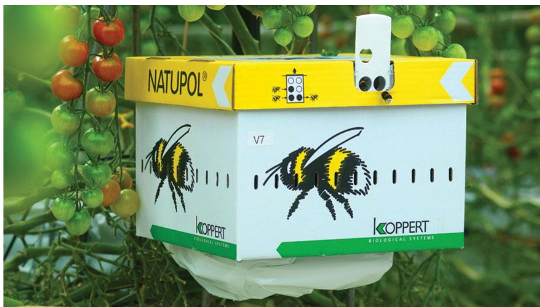
Slika 2. Natupol bumbarške košnice tvrtke Koppert (Foto:

Nizozemska tvrtka Koppert također u ponudi ima košnice bumbara pod nazivom "Natupol", a imaju distributera za Hrvatsku pa ih je moguće jednostavno nabaviti i kod nas (Natupol, 2018.).