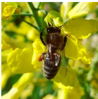
Slika 1. Medonosna pčela na kupusnjači