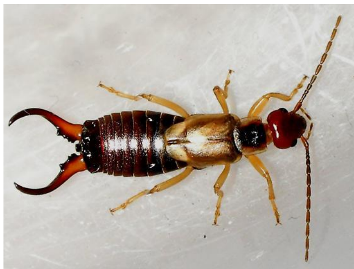
Slika 7. Europska uholaža, F. auricularia.