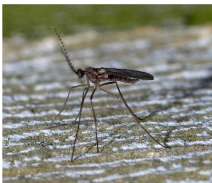
Slika 8. Vrsta iz porodice Cecydomidae.

U nas se vrsta Aphidoletes aphidimyza Rondani spominje kao značajna u suzbijanju lisnih ušiju. Odloži do stotinjak jaja na zaražene biljke, a u promet se stavlja u stadiju kukuljice. Preporuka za suzbijanje je pet jedinki po m 2 (Igrc Barčić i Maceljski, 2001.). Bugg i sur. (2008.) u svom istraživanju nalaze kako je ta vrsta važan prirodni neprijatelj raznih štetočinja, a posebice lisnih ušiju u travno-djetelinskim smjesama.