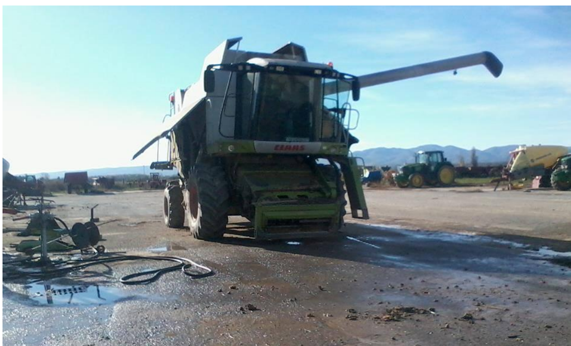
Slika 10. Čišćenje kombajna iznutra