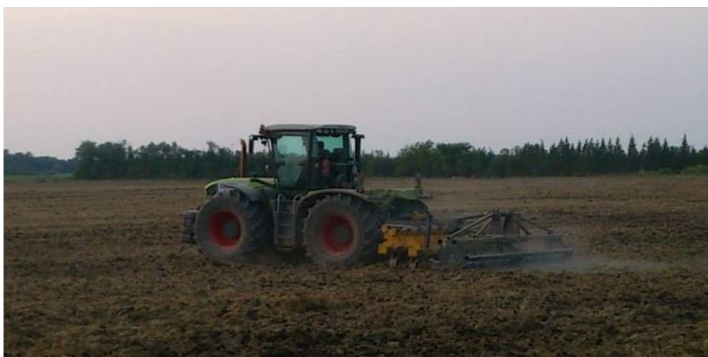
Slika 17. Podrivač u radu