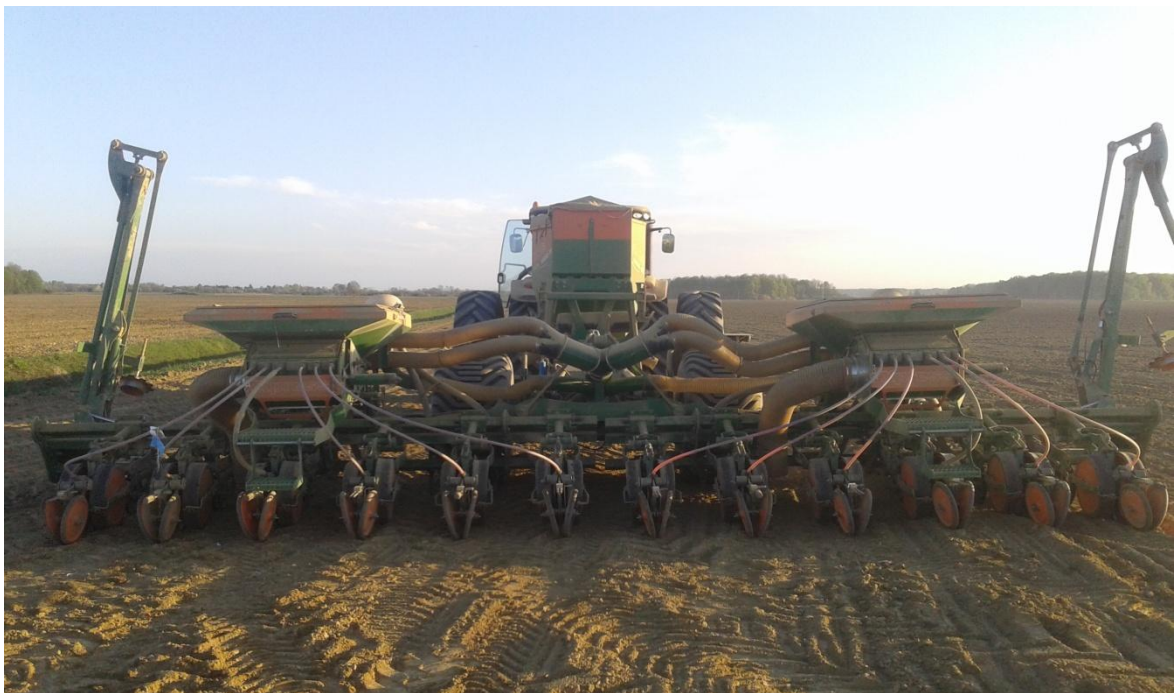
Slika 23 Sijačica „Amazone EDX 9000 TC“ – sprovodne cijevi