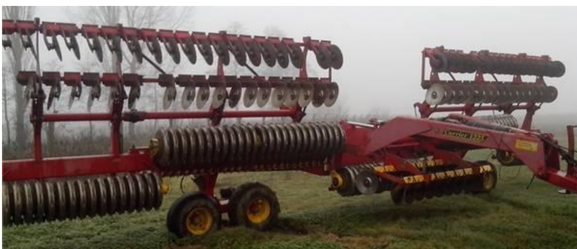
Slika 19. „Vaderstad Carrier 1225“

Održavanje tanjurača, slika 19., u „PP Orahovica – Ratarstvo“ provodi se na način da se prije uporabe tanjurača vizualno pregleda i provjeri se zategnutost vijčanih spojeva, naoštrenost tanjura, podmažu ležajevi baterija, provjeri se položaj strugača zemlje te se vrši kontrola tlaka zraka u pneumaticima. Nakon završenog posla tanjurače se peru od nakupljenih nečistoća, blata i prašine. Održavanje se obavlja na način koji preporučuju Emert i dr.(1995.)