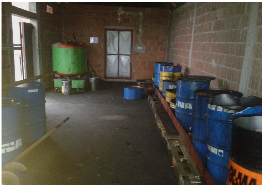
Slika 35. Bačve za zauljne krpe i pročistače