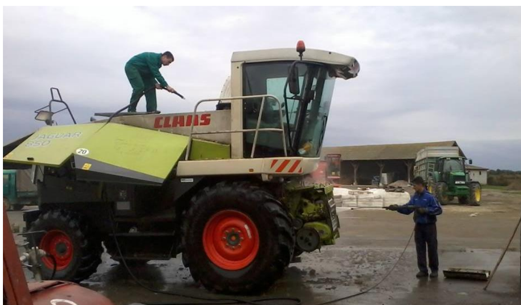
Slika 6. Pranje silokombajna

Pranje strojeva obavlja se u prostoru neposredno pokraj radionice, slika 6. Otpadne vode tijekom pranja odlaze u odvodni kanal do kolektora (kanalizacije) slika 7., gdje prolaze kroz separator otpadnih voda. Nakon pročišćavanja vode, ona odlazi u kanalsku mrežu, a dva do tri puta godišnje se separator čisti i provjerava njegova ispravnost od strane ovlaštenih tijela.