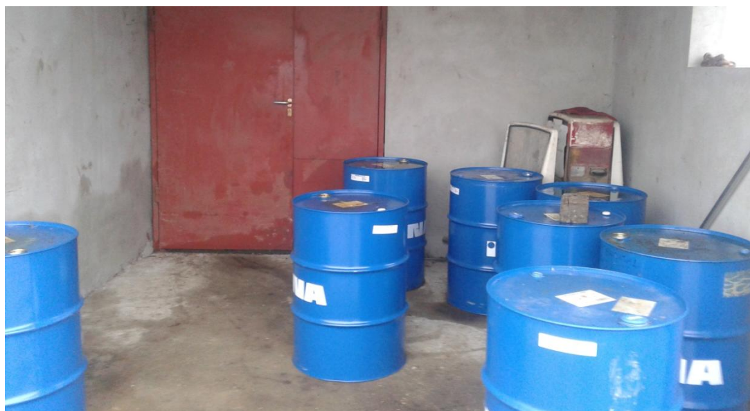
Slika 4. Objekt zatvorenog tipa-„uljarnica“

Radionica nije opremljena uređajima za dijagnostiku. U sklopu radionice nalaze se i dva dodatna objekta, gdje se u jednom objektu nalaze spremnici za rabljeno ulje, pročistače za ulje i zauljne krpe, dok je drugi objekt tzv. „uljarnica“, slika 4., u kojoj je nalaze bačve s uljem koje se koristi kod održavanja strojeva.