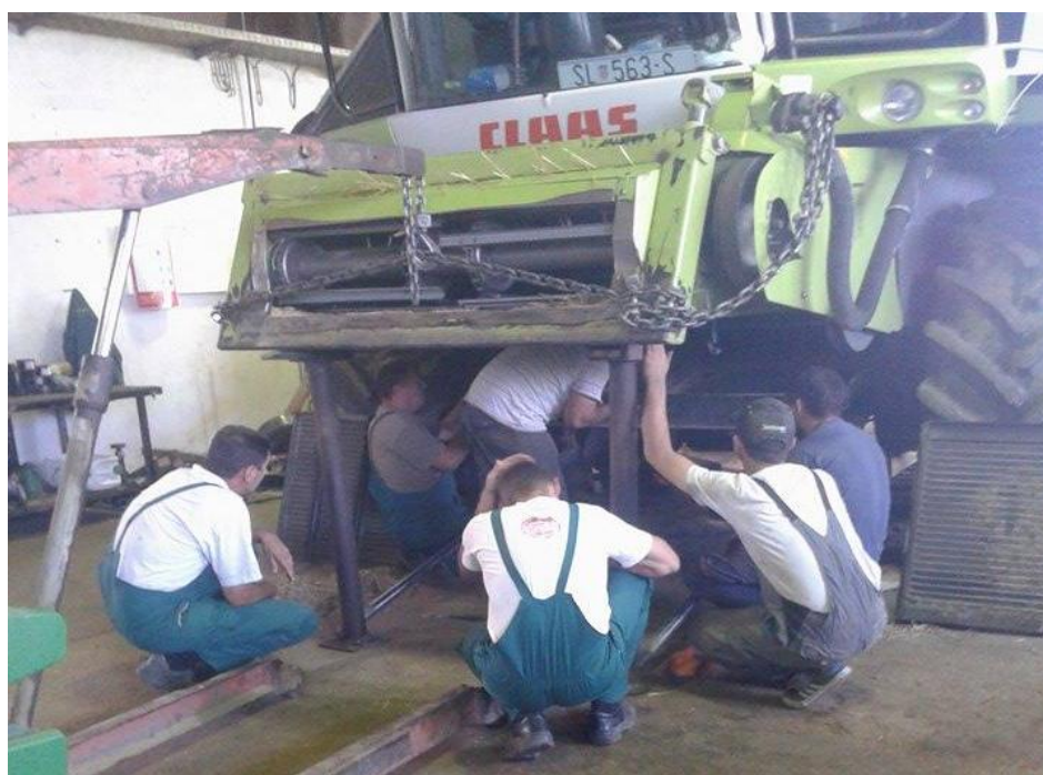
Slika 11. Servis na kombajnu prije sezone

Servisni interval je svakih 250 radnih sati, ali zbog sezonskog karaktera kombajna, prije početka sezone žetve radi se veliki servis na kombajnu, slika 11., i isti se priprema za rad.