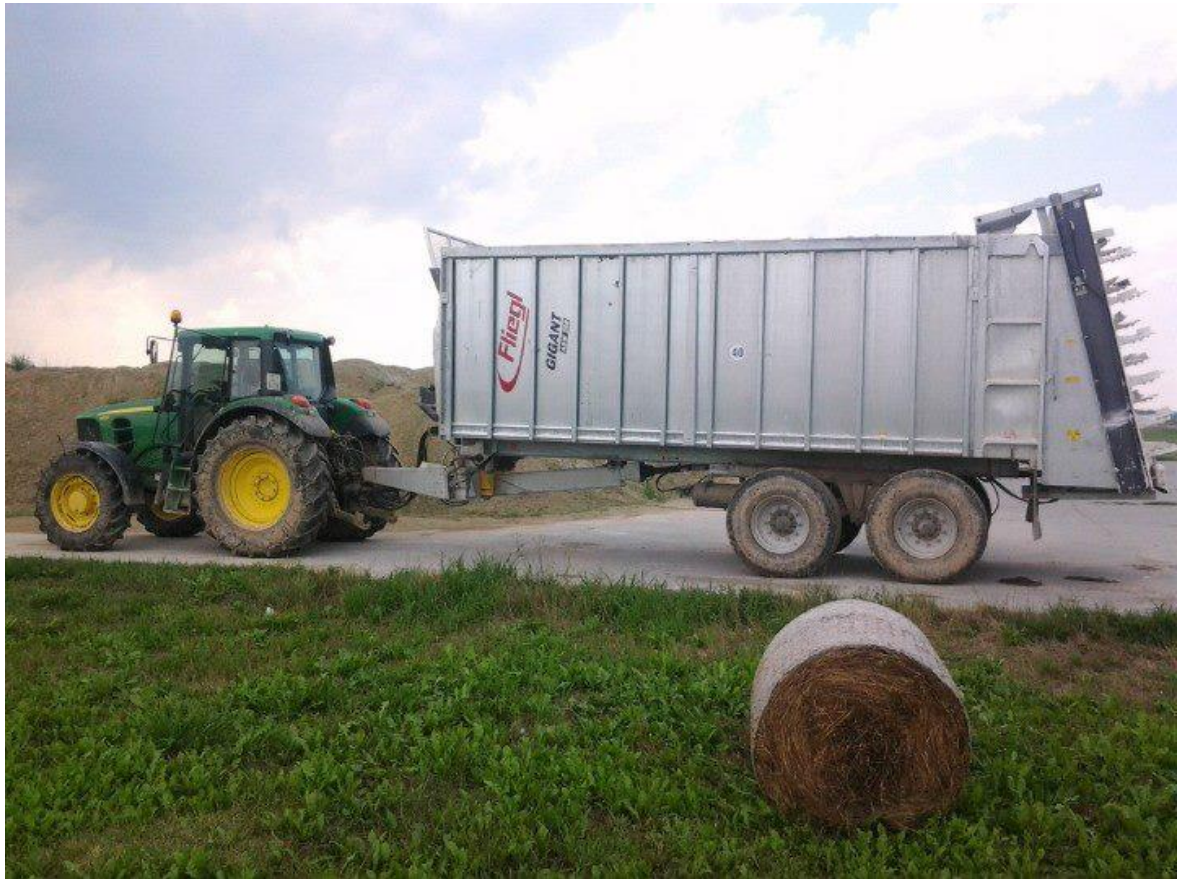
Slika 28. „Fliegl“ prikolica za stajnjak