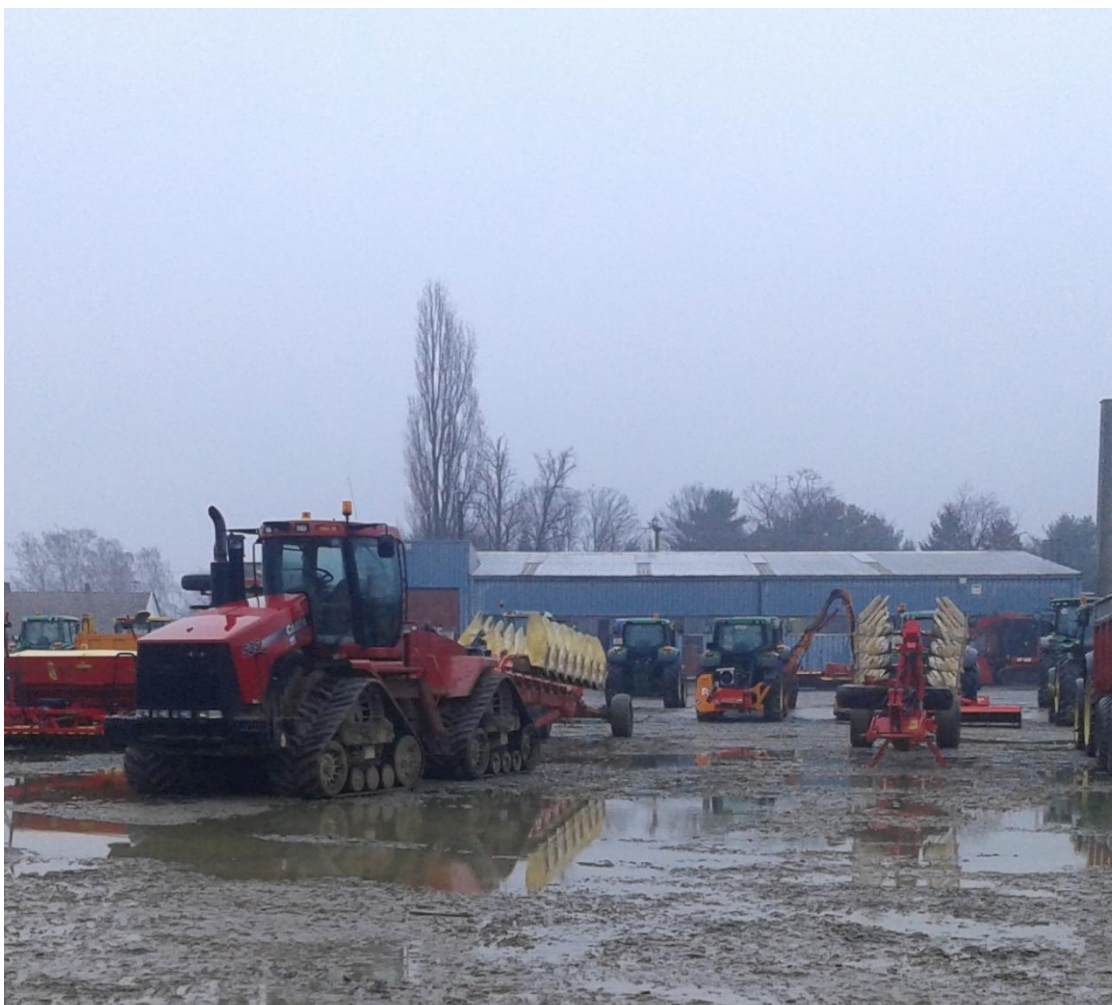
Slika 15. Plugovi „KUHN“ i „Vogel & Noot“