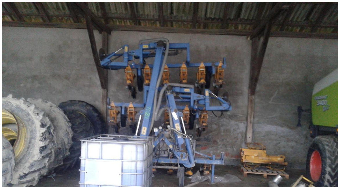
Slika 24. Sijačica za repu „Kleine“