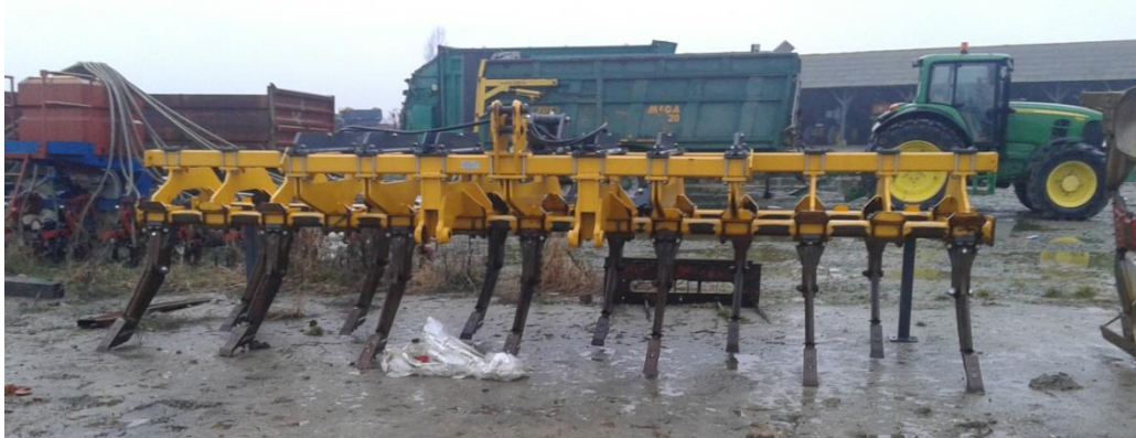
Slika 16. Podrivač „Dondi 813“