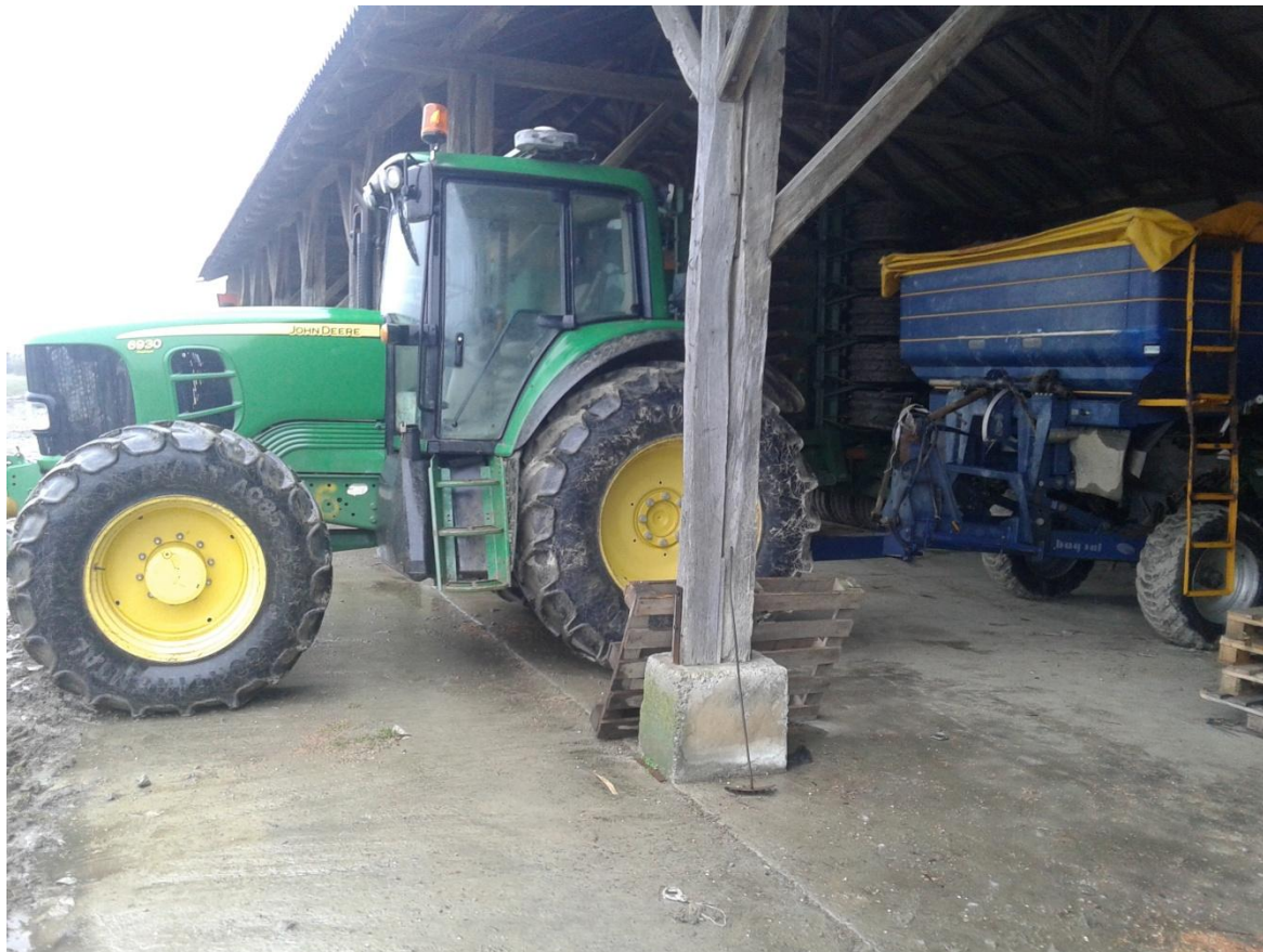
Slika 27. Traktor opremljen navigacijom i rasipač „Bogballe“

nošeni i kao vučeni stroj, prije rada provjerava se tlak zraka u pneumaticima. Nakon završetka rada ispušta se preostala količina gnojiva iz rasipača. Ako se na određeni period rasipač neće koristiti tada se i peru.