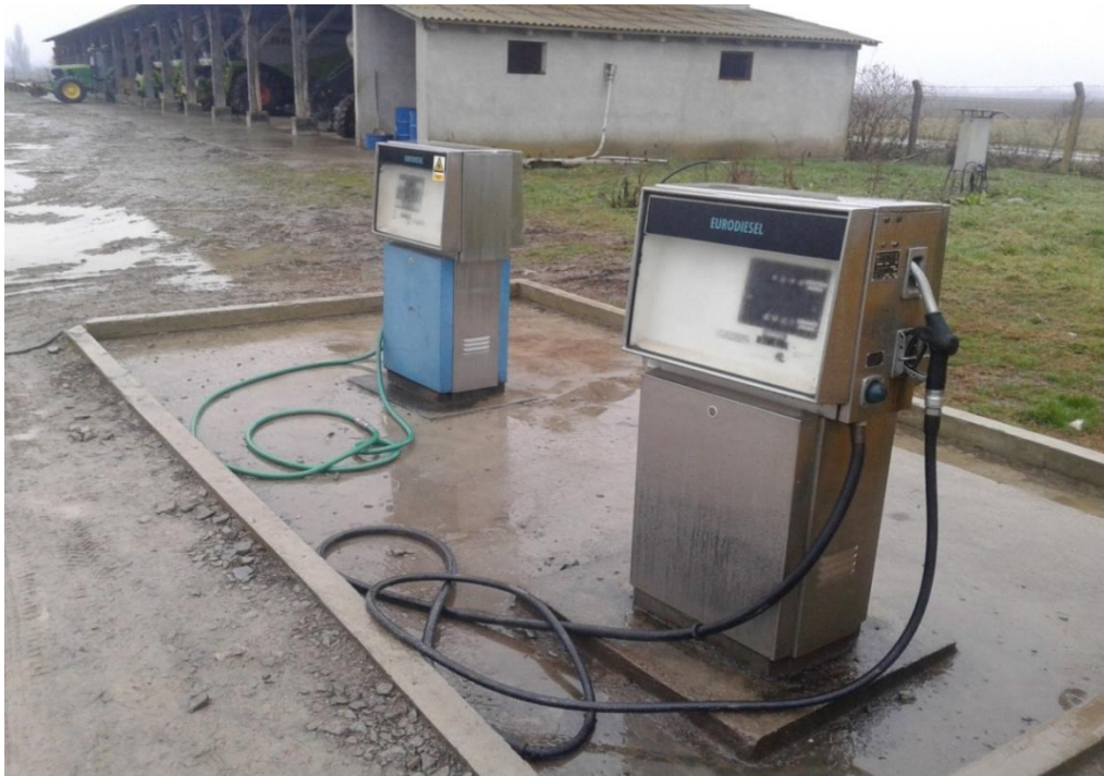
Slika 2. Stanica za točenje goriva

Svako ekonomsko dvorište opremljeno je i stanicom za točenje goriva, slika 2.