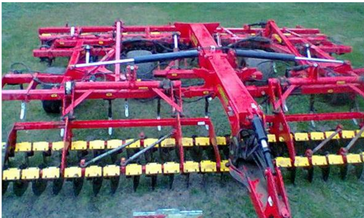
Slika 18. „Vaderstad TopDown“