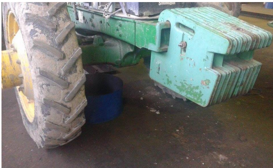
Slika 5. Zamjena ulja na traktoru

Zamjena ulja obavlja se unutar radionice na način da se ispod stroja kojem se mijenja ulje postavi posuda u koju se ispušta ulje, slika 5.