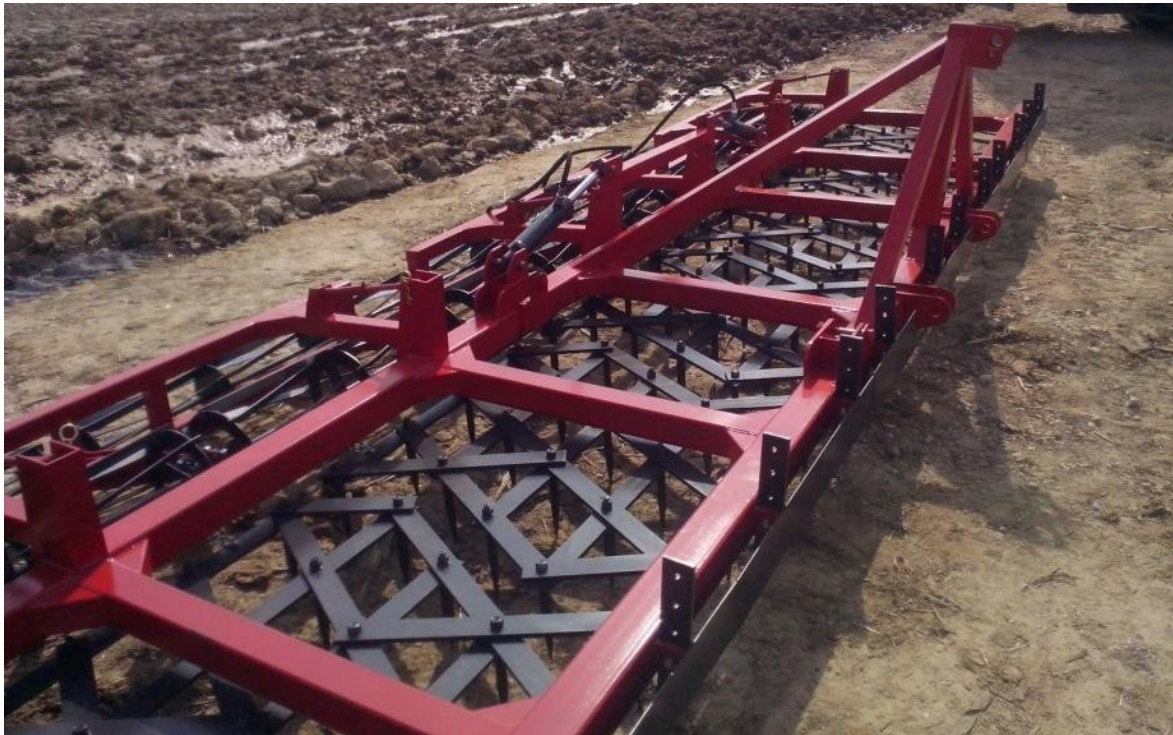
Slika 20. Teška drljača

Teška drljača, slika 20., koristi se u proljetnom zatvaranju brazde i rijetko u predsjetvenoj pripremi. Kao i kod većine sličnih strojeva prije početka rada s drljačom provodi se vizualna kontrola zategnutosti vijčanih spojeva, provjera naoštrenosti klinova, a po potrebi oštećeni klinovi zamjenjuju se novima. Održavanje je u skladu sa stručnom literaturom. Emert i dr. (1995)