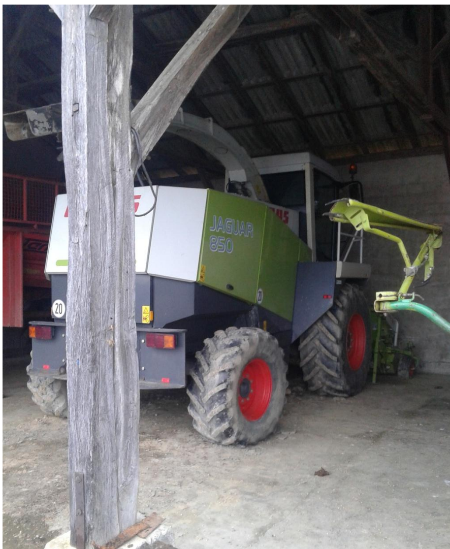
Slika 32. Poluzatvoreno garažiranje

U „PP Orahovica-ratarstvo“ provode se sva tri načina garažiranja. Najviše strojeva garažira se u poluzatvorenom i na otvorenom prostoru, dok se u zatvorenom prostoru garažira samo dio kombajna i prskalice. U poluzatvorenom prostoru garažiraju se preostali kombajni, traktori, sijačice, rasipači mineralnog gnojiva, hederi, silokombajn, slika 32., i preša za bale. Ostali strojevi garažiraju se na otvorenom prostoru slika 33., i to većina bez prethodne tehničke zaštite.