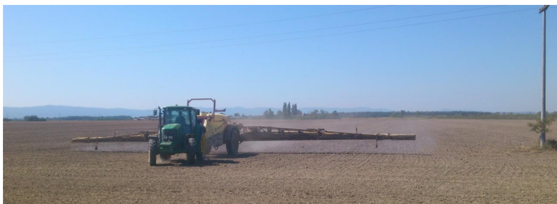
Slika 25. Prskalica „Hardi“

Poduzeće raspolaže sa tri prskalice radnog zahvata 24 metra, slika 25., kapaciteta spremnika 4400 litara. Prije početka sezone obavlja se vizualni pregled ispravnosti radnih dijelova prskalice, zatim se spremnik napuni vodom te se provjerava ispravnost mlaznica i količina izbačene tekućine po pojedinoj mlaznici. Također mijenja se ulje u crpki i provjerava se tlak zraka u pneumaticima. Tijekom sezone nakon 100 radnih sati ponovno se kontrolira dali je jednaka količina izbacivanja tekućine na svakoj mlaznici, vrši se izmjena ulja u crpki te se čisti otvor na poklopcu spremnika kako ne bi došlo do stvaranja podtlaka u spremnik. Nakon završetka prskanja ispiru se spremnik čistom vodom. Sve mjere koje se provode u skladu su sa nuputkom za rukovanje i održavanje i mjerama koje navode Emert i dr.(1995)