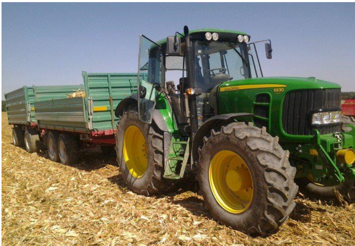
Slika 30. Prikolice „Tehnostroj“

U okviru dnevnog održavanja prikolica provjerava se ispranost signalizacije i sustava za kočenje. Od radnji koje navode Emert i dr. (1995), u okviru tjednog održavanja ne provodi se provjera ispravnosti gibnjeva, podmazivanje ležajeva kotača i provjera tlaka zraka u pneumaticima. Sve te radnje provode se povremeno. Slika 30., slika 31.