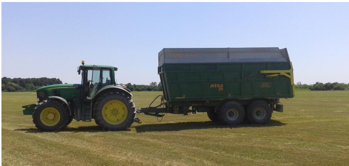
Slika 31. Prikolica „ZDT Mega“