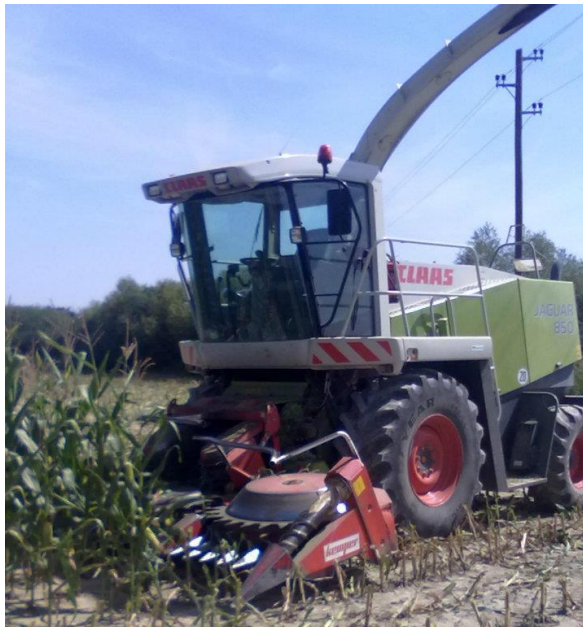
Slika 13. Silokombajn „CLAAS JAGUAR 850“

Od samokretnih strojeva „PP ORAHOVICA“ posjeduje još i silažni kombajn „CLAAS JAGUAR 850“, slika 13., koji se koristi u proizvodnji silaže i sjenaže za ishranu stoke.