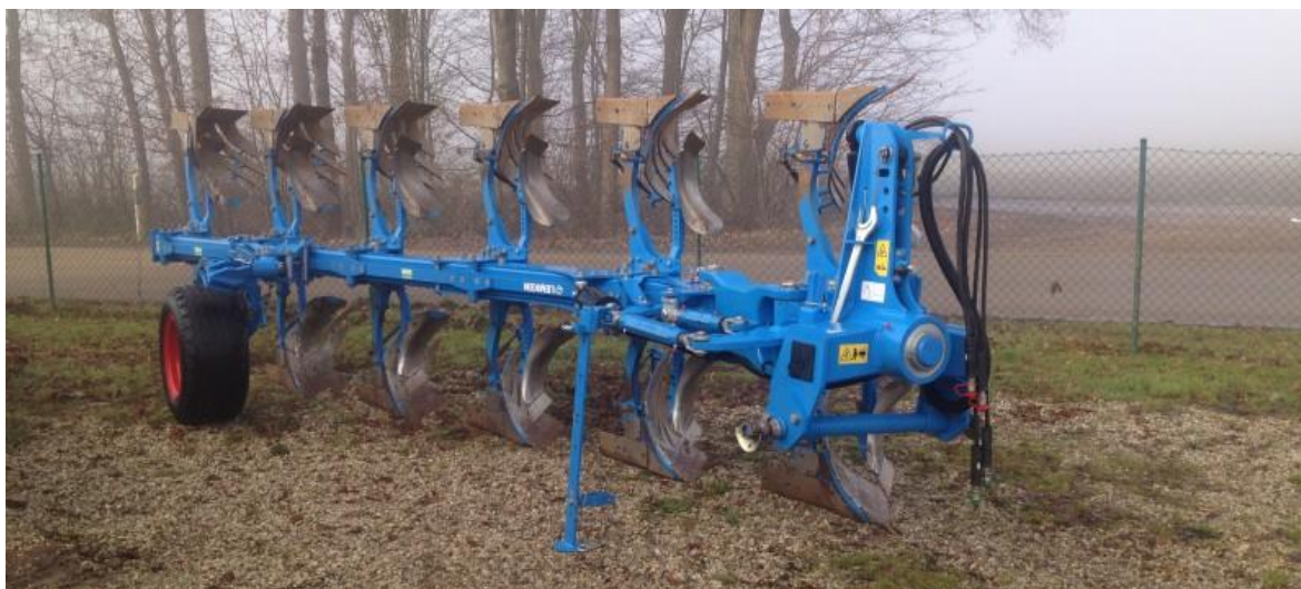
Slika 14. Plug „Lemken“ 6 brazdi

Plug je oruđe koje se koristi u relativno kratkom vremenskom periodu tijekom sezone (1,5-2 mjeseca rada u godini). „PP Orahovica – Ratarstvo“ raspolaže velikim brojem plugova, različite konstrukcije (nošeni, vučeni, polunošeni) i zahvata (3-12 brazdi), slika 14., slika 15. Prije sezone rada svi plugovi se pripremaju na način da se provjerava zategnutost svih vijčanih spojeva, ako su neki vijci oštećeni zamjenjuju se novima. Također provjerava se naoštrenost lemeša, kod većine plugova dolazi do zamjene starih lemeša novima, a za vrijeme sezone zamjena lemeša obavlja se po potrebi ovisno o zatupljenosti. Prije nego plug bude spreman za rad još se podmazuju ležajevi crtala. Kod vučenog i polunošenog pluga također se provjerava tlak zraka u pneumaticima. Za vrijeme rada na polju svaki rukovatelj nakon svoje smjene ili po potrebi na proizvodnoj površini očisti plug od grubih nečistoća, pošto se plugovi po nekoliko dana ne vraćaju u ekonomsko dvorište.. Nakon završene sezone oranja, kada se plugovi vrate u ekonomsko dvorište slijedi detaljno čišćenje i pranje pluga od ostatka zemlje i prašine. Redovite mjere održavanja sukladne su mjerama koje navode Emert i dr (1995) i Landeka (1994).