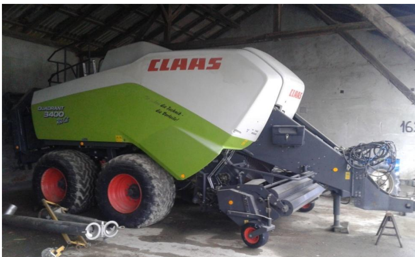
Slika 29. Preša „Claas“

Održavanje preše za velike kvadratne bale, slika 29., sastoji se u vizualnoj kontroli vijčanih spojeva prije početka rada, također podmazuju se mjesta koja su za to predviđena. Nekoliko puta tijekom sezone provjerava se ispravnost uređaja za vezanje bala. Nakon sezone stroj se čisti i garažira. Održavanje je u skladu sa naputkom za rukovanje i održavanje.