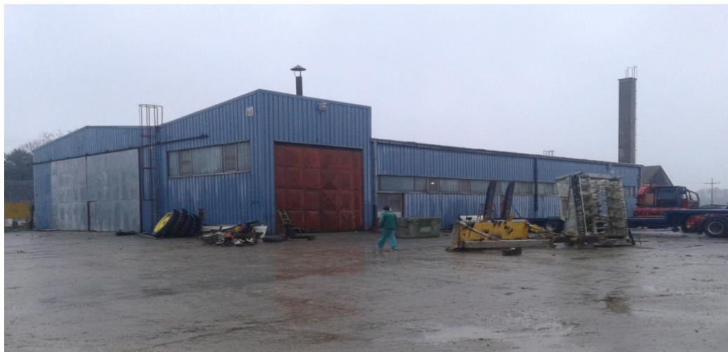
Slika 3. Radionica

U RJ „Zdenci“ nalazi se i radionica, slika 3., koja je opremljena slijedećim alatima za održavanje i popravak: tokarski stroj, aparati za zavarivanje, ključevi za vijke različite veličine i oblika („okasti – viličasti“), moment ključevi različite veličine, inbus kuljčevi, pneumatska čegrtaljka i specijalizirani alati za pojedine strojeve (sijačice, prskalice i rasipače). Uz ovu opremu, postoji vulkanizerska oprema za brzo otklanjanje kvarova na pnematicima.