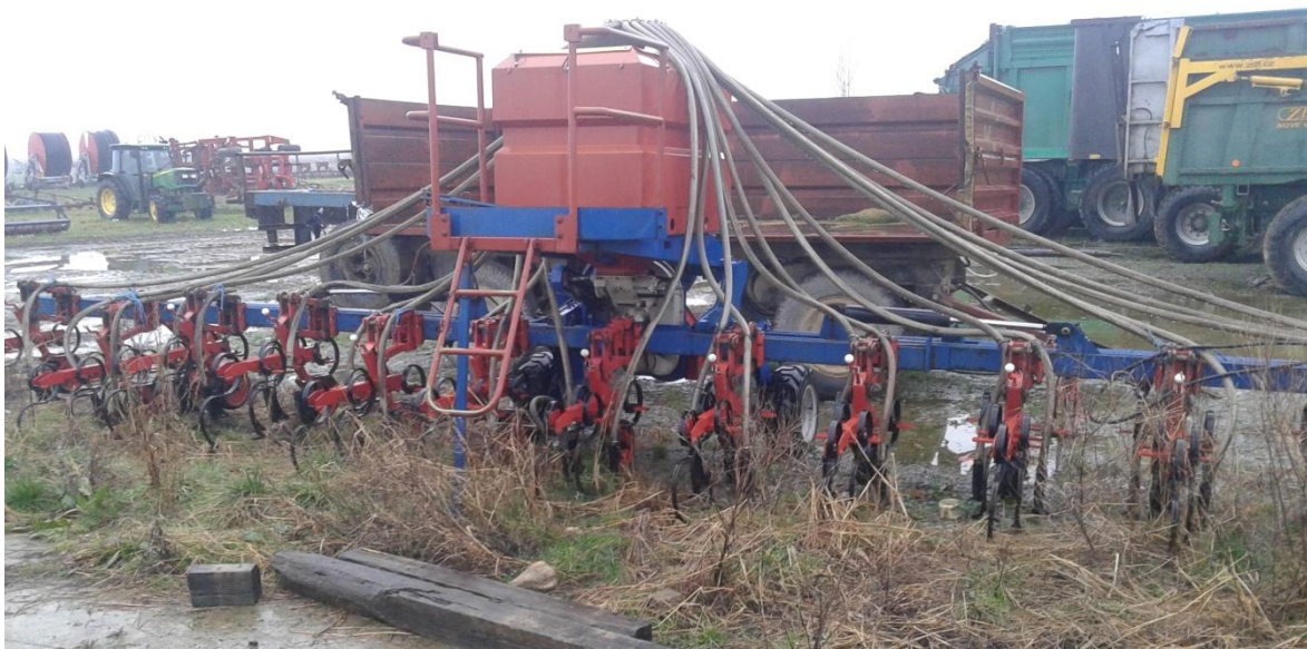
Slika 26. Međuredni kultivator „OLT“

„PP Orahovica-Ratarstvo“ raspolaže sa dva međuredna kultivatora radnog zahvata 12 redova, slika 26., za kultivaciju kukuruza i suncokreta, te 18 redova za kultivaciju šećerne repe. Prije rada vizualno se pregleda ispravnost kultivatora, te zategnutost vijčanih spojeva i zupčanika. Prije sezone rada, a kasnije po potrebi oštire se radni dijelovi, te ukoliko su neki od radnih dijelova oštećeni zamjenjuju se novima. Nakon završetka radova, kultivator se čisti od nakupljenih prljavština, te se prazne i čiste spremnici za mineralno gnojivo. Podmazivanje pojedinih dijelova vrši se prema napatku za rukovanje i održavanje..