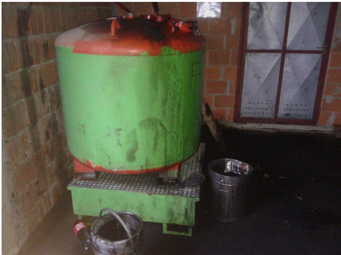
Slika 34. Spremnik za skladištenje rabljenog ulja

Zauljne krpe i rabljene pročistače za ulje potrebno je adekvatno prikupljati, nipošto nije dozvoljeno spaljivati ih ili bacati ih u mješoviti otpad. Za zauljne krpe i rabljene pročistače slika 35., slika 36., postoje „bačve“ u koje se isti odlažu do predavanja ovlaštenom sakupljaču. Redovito pražnjenje tj. odvoz od strane ovlaštenog sakupljača omogućuje zbrinjavanje bez mogućnosti onečišćenja i zagađivanja okoliša.