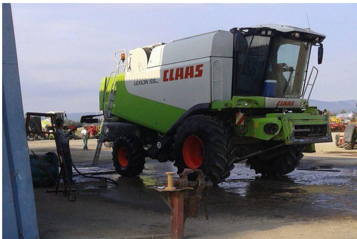
Slika 9. Pranje kombajna iz vana nakon sezone

Svakodnevno prije početka rada s kombajnom rukovatelj provodi mjere dnevnog održavanja: vizualnu provjeru stanja kombajna, pregledavanje hedera i režućeg aparata (kose), provjera razine ulja u motoru, provjera rashladne tekućine, obavezno čišćenje pročistača zraka, te provjera zategnutosti remenja i lanaca. Također prije početka rada puni se spremnik gorivom. Nakon rada kombajn se čisti od nakupljene prljavštine i biljnih ostataka, a ukoliko kombajn ostaje preko noći na proizvodnoj površini zbog velike udaljenosti od ekonomskog dvorišta, prije početka rada slijedeće jutro dolazi servisna ekipa s vozilom koje je opremljeno kompresorom. Rukovatelj komprimiranim zrakom čisti pročistač zraka, podmazuje mjesta koja su za to predviđena i obavlja već prije navedene mjere održavanja na kombajnu. Pranje kombajna iz vana obavlja se nakon sezone rada, slika 9, a čišćenje unutrašnjosti komprimiranim zrakom također se obavlja po završetku sezone, slika 10.