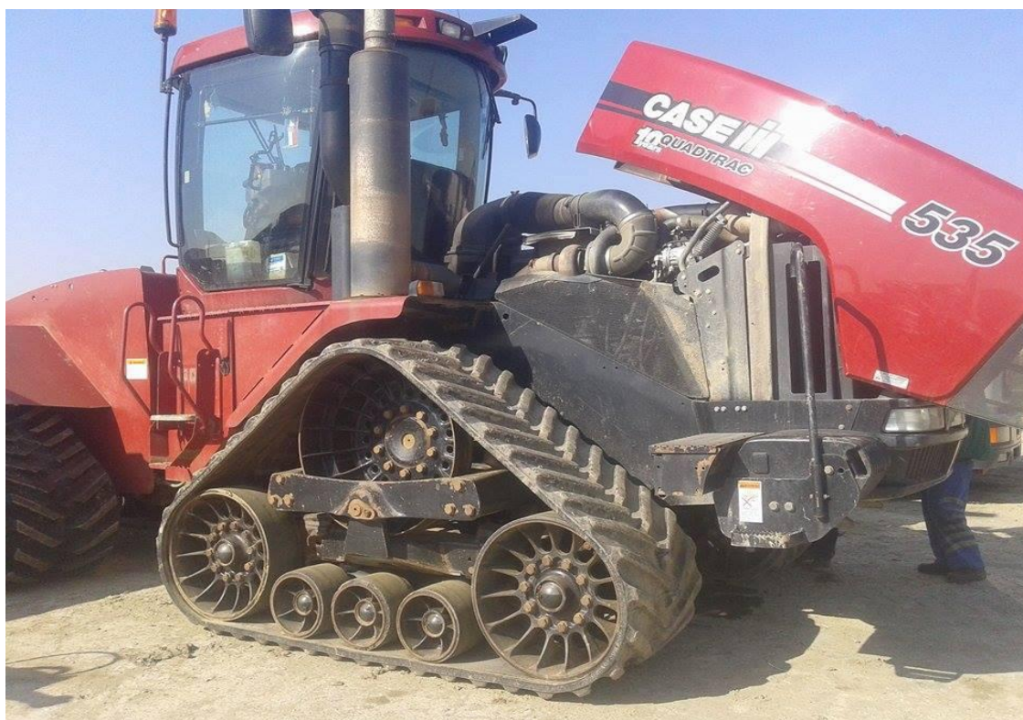
Slika 8. Provođenje mjera održavanja prije početka rada

Svakodnevno prije početka rada provode se slijedeće mjere dnevnog održavanja: vizualna kontrola ispravnosti traktora, provjera razine ulja u motoru, provjera rashladne tekućine u hladnjaku, provjera ispravnosti signalizacije te nadolijevanje goriva u spremnik. Ukoliko nakon obavljenog posla na traktoru budu veće količine vanjskih nečistoća traktor se nakon smjene pere. Također unutar dnevnog održavanja slika 8., redovito se provodi čišćenje pročistača zraka, pogotovo kada traktor radi u težim uvjetima rada ili ako je traktor u pogonu cijeli dan (24h), tada nakon smjene rukovatelj skida pročistač i odnosi ga u radionicu gdje ga čisti komprimiranim zrakom.