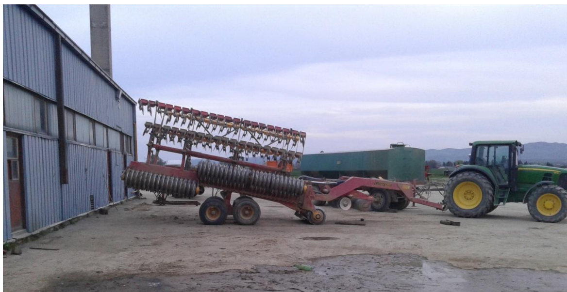
Slika 33. Garažiranje na otvorenom