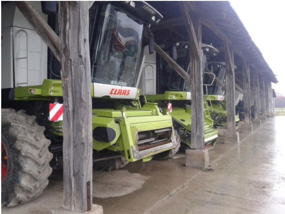
Slika 1. Objekt poluzatvorenog tipa

jedinice nalaze se ekonomska dvorišta približne površine oko 2 ha gdje se nalaze objekti zatvorenog i poluotvorenog tipa, slika 1., koji se koriste za garažiranje strojeva izvan uporabe.