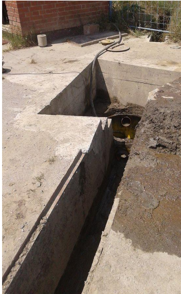
Slika 7. Kolektor za sakupljanje otpadne vode

Za radove u poljoprivrednoj proizvodnji „PP Orahovica – Ratarstvo“ raspolaže većim brojem samokretnih i priključnih strojeva različitih proizvođača i namjene, tablica 2., 3., 4. i 5.