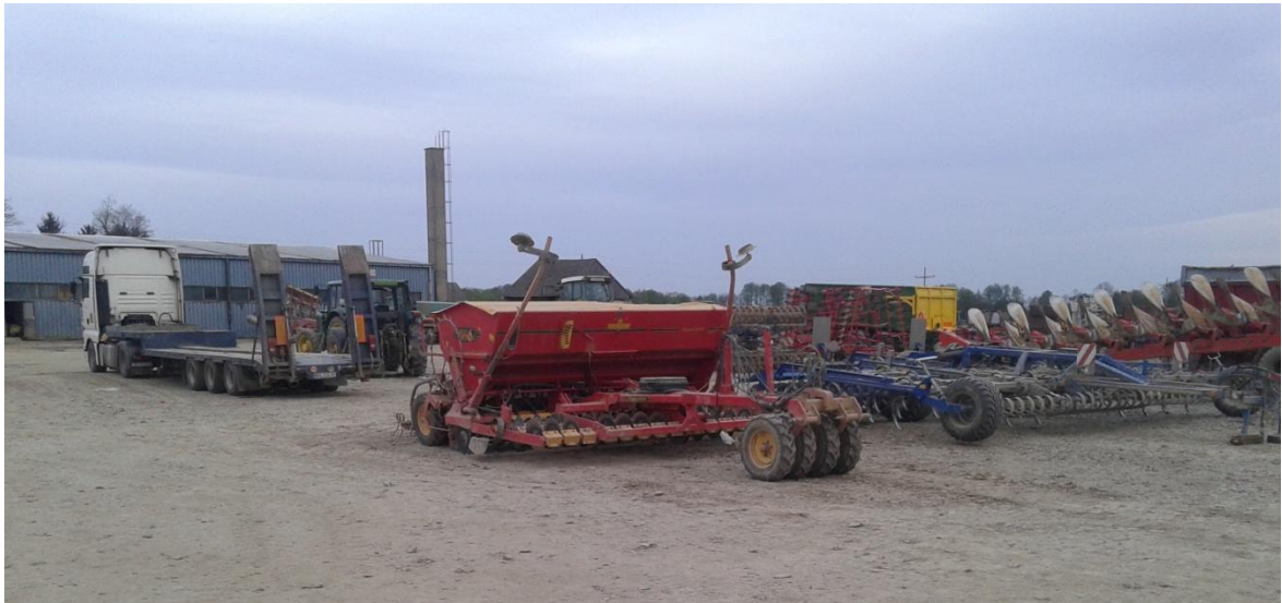
Slika 22. Sijačica „Vaderstadt“ 4m