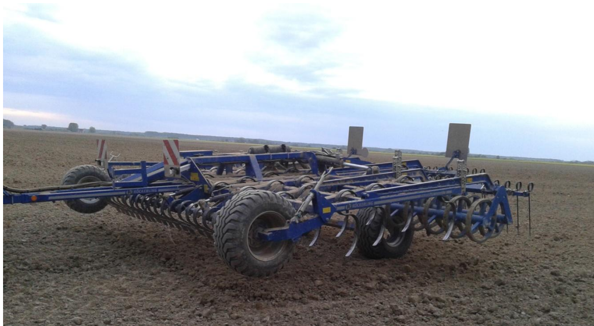
Slika 21. Sjetvospremač „Kockerling“