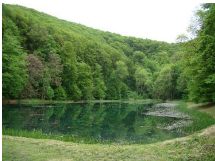
Slika 11. Šuma gorskog javora i mjesečarke na Jankovcu (Foto: Siniša Ozimec).

Ova šumska zajednica dosad je u Hrvatskoj opisivana kao šuma gorskoga javora i običnoga jasena, asocijacija Aceri-Fraxinetum excelsioris (Vukelić, 2012.). Prisutna je na mjestima gdje se dugo zadržava snijeg, pojačana je vlažnost tla u kojem ima dosta dušika, pa sporom organskom razgradnjom nastaje duboki humusno-akumulativni horizont tla (Samarđić, 2005.). U Parku prirode "Papuk" razvijena je većinom na grebenima gorskoga pojasa, Točak (887 m), Crni vrh (805 m), u pojasu bukovo-jelove šume i na nekoliko manjih površina: Park šuma Jankovac (Slika 11), Pušinska planina, Brzaja, Mrežari). U sloju drveća prevladavaju tzv. plemenite listače, gorski javor ( Acer pseudoplatanus ), obični jasen ( Fraxinus excelsior ) i često gorski brijest ( Ulmus glabra ). U vrlo bujnom i vrstama bogatom prizemnom sloju najbrojnije su vrste: mjesečarka ( Lunaria rediviva ), šumski starčac ( Senecio nemorensis ), velelisna ivančica ( Chrysanthemum macrophyllum ), smeđa iglica ( Geranium phaeum ), šupaljke ( Corydalis cava , C. solida ) i kolotoč ( Telekia speciosa ).