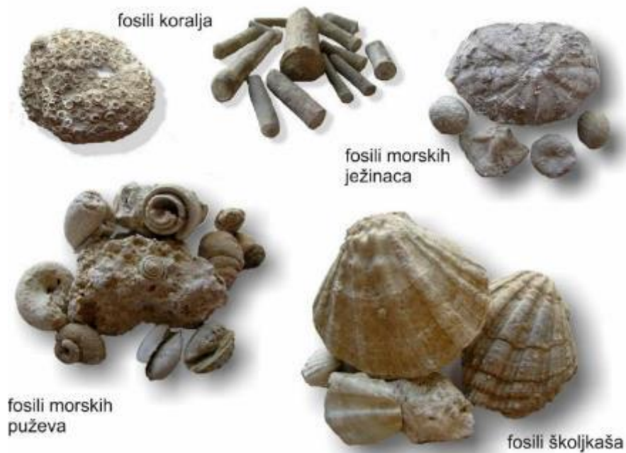
Slika 4. Fosili koralja, morskih ježinaca, školjkaša, morskih puževa