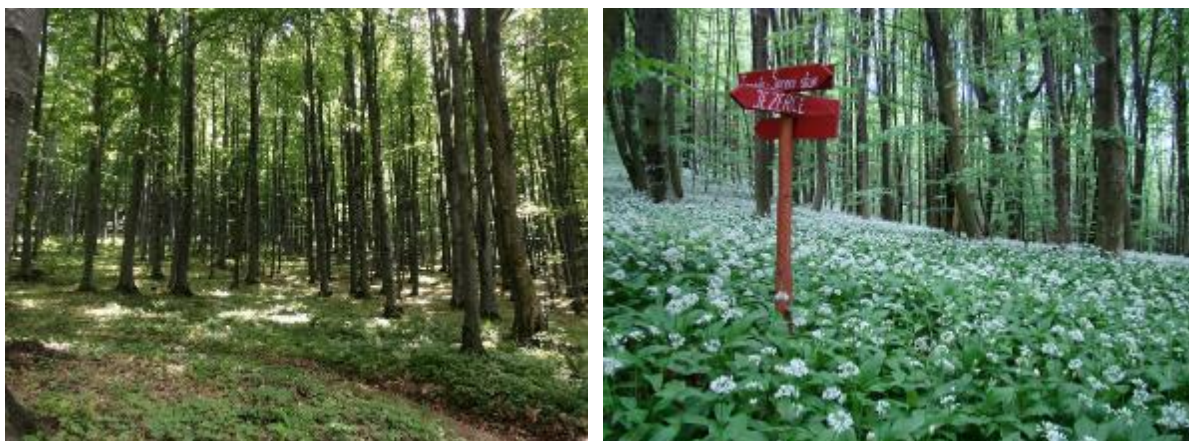
Slika 10. Bukova šuma na Papuku - lijevo i medvjeđi luk, Allium ursinum – desno.

Razvijena je na terenima blažega reljefa gdje su nakupljene dublje naslage tla. Inače je lazarkinja ( Asperula odorata ) zastupljena na cijelom području Papuka, Psunja i Dilja. Uz nju su najbrojnije još slijedeće vrste bukovih šuma: Sanicula europaea , Carex sylvatica , Anemone nemorosa , Athyrium filix-femina , Dryopteris filix-mas , Melica nutans , Lamium galeobdolon i Lathyrus vernus . U proljetnom razdoblju u prizemnom sloju dominira medvjeđi luk, Allium ursinum (Slika 10).