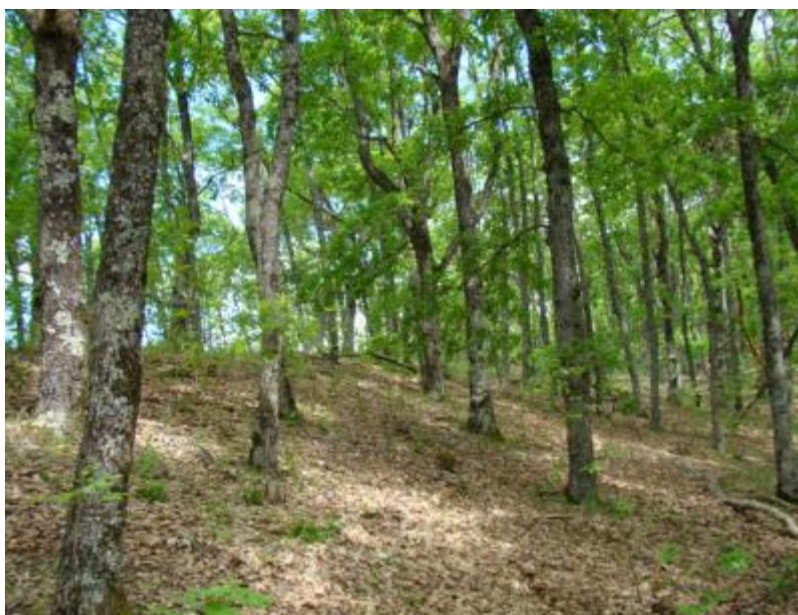
Slika 9. Šuma hrasta medunca i crnog jasena na Lapjaku

Medunčeve šume na Papuku (Slika 9) razvijaju se na litološkoj podlozi dolomita, litotamnijskih vapnenaca i karbonatnih pješčenjaka na plitkim i srednje dubokim rendzinama niskoga stupnja pogodnosti za šumsku proizvodnju. Dolaze na jako strmim stranama na južnim, jugoistočnim i jugozapadnim ekspozicijama na nadmorskim visinama od 180-720 m.