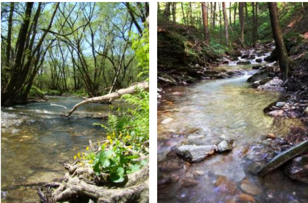
Slika 6. Vodotoci u Parku prirode „Papuk“; Brzaja – lijevo i Dubočanka – desno.

Složeni geološki odnosi uvjetovani tektonskim strukturama uvjetuje pojavu termalnih izvora. Ovakve izvore nalazimo ispod Topličke glave (471 m), nedaleko šumarskog objekta Duboka te području Toplice u blizini Orahovice.