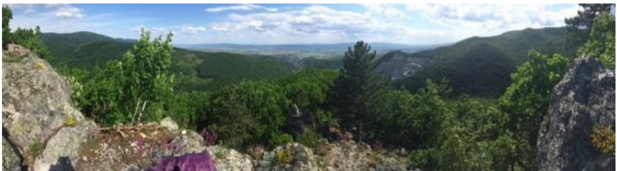
Slika 2. Pogled na Park prirode „Papuk“ sa Tauberovih stijena

Park prirode „Papuk“ se nalazi u kontinentalnom dijelu Republike Hrvatske na prostoru dodira središnje i istočne Hrvatske. Prema prirodno-geografskoj regionalizaciji, pripada panonskoj megaregiji, odnosno području Slavnskoga gorja (Slika 2)