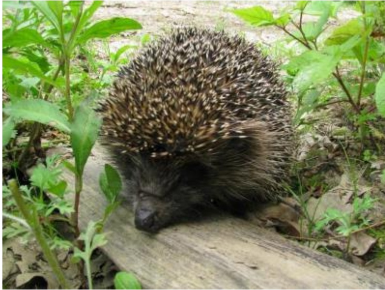
Slika 13. sjeverni bjeloprsi jež, Erinaceus roumanicus

Velikouhi šišmiš ( Myotis bechsteini ), mali večernjak ( Nyctalus leisleri ) i resasti šišmiš ( Myotis nattereri ) samo su neke od vrsta šišmiša zabilježenih na području Papuka, kojima je šuma najvažnije lovno stanište, a drveće najvažnije skrovište.