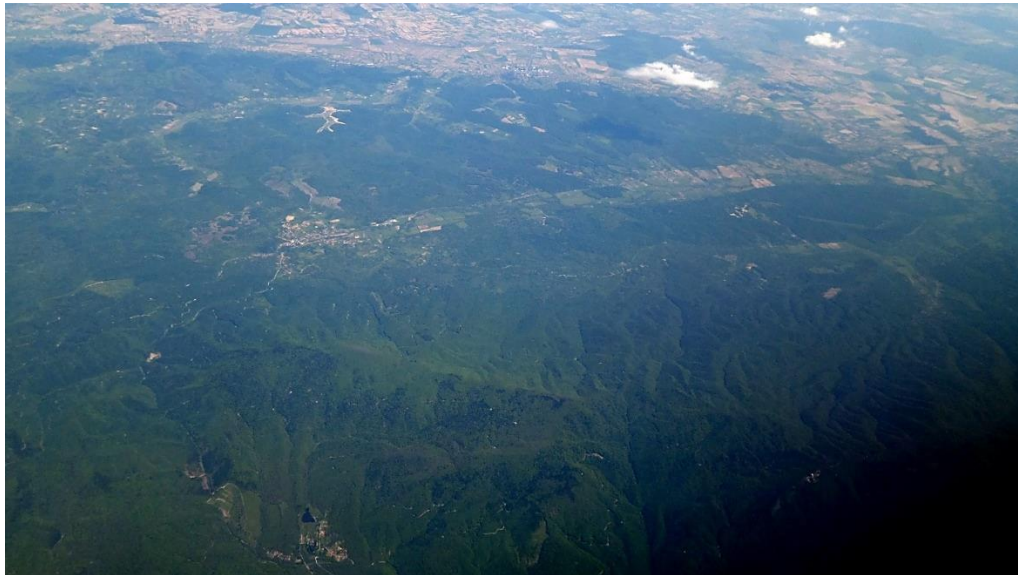
Slika 3. Zračni snimak dijela Papuka između Novog Zvečeva, Voćina i Slatinskog Drenovca.

Gorski hrbat Papuka obuhvaća sjeverozapadni dio Slavenskog gorja (Slika 3). Izdužen je pravcem ZSZ-IJI u duljini od oko 45 km. Najširi je na zapadu (oko 20 km), a najuži na krajnjem istoku (manje od 10 km). Najviši mu je istoimeni vrh visine 953 m. Papuk se orografski može podijeliti u tri dijela: zapadni, središnji i istočni (Samardić, 2010.).