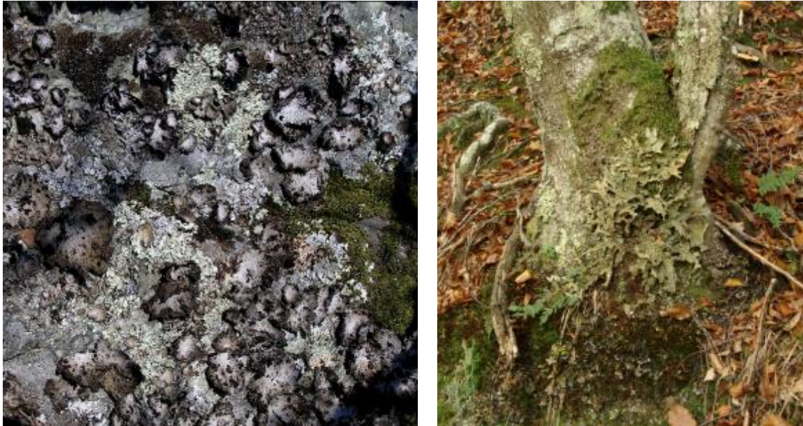
Slika 7. Epilitski lišajevi, lokalitet Tauberove stijene – lijevo (Foto: Siniša Ozimec) i epifitski lišaj Lobaria pulmonaria , lokalitet Svinjarevac (Foto: Dragan Prlić).

Od ukupne površine Parka prirode „Papuk“ (34.307 ha), šumska staništa pokrivaju 32.699 ha, što čini udio od 95 %. Prema namjeni šume su razvrstane u gospodarske šume (89 %), zaštitne šume (7 %) i šume posebne namjene (5 %). Osim zaštitnih šuma, koje se nalaze na površini od 1.946 ha, izdvojene su šume s posebnom namjenom na površini od 1.443 ha.