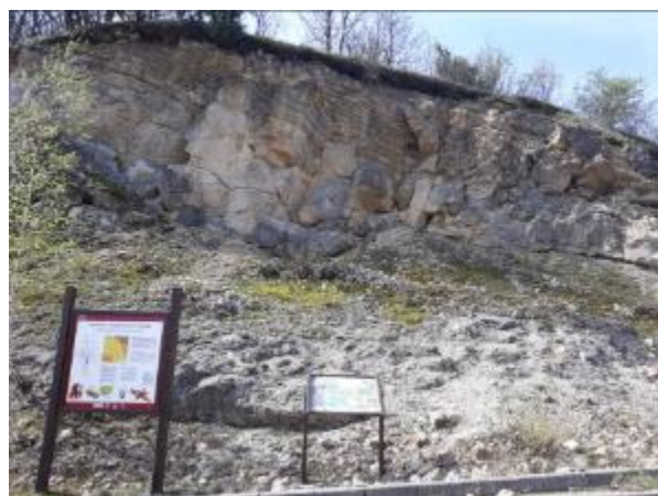
Slika 5. Vulkanske stijene kod Rupnice – lijevo i miocenske naslage kod Vrhovaca – desno (Foto: Siniša Ozimec).