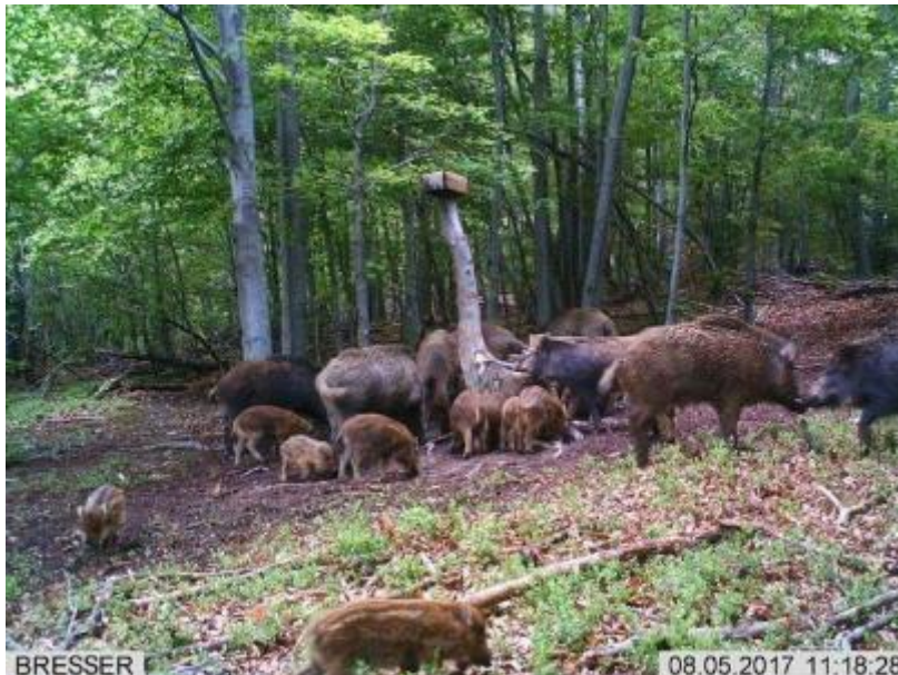
Slika 12. Divlje svinje, Sus scrofa

Potok Brzaju povremeno nastanjuje vidra ( Lutra lutra ).