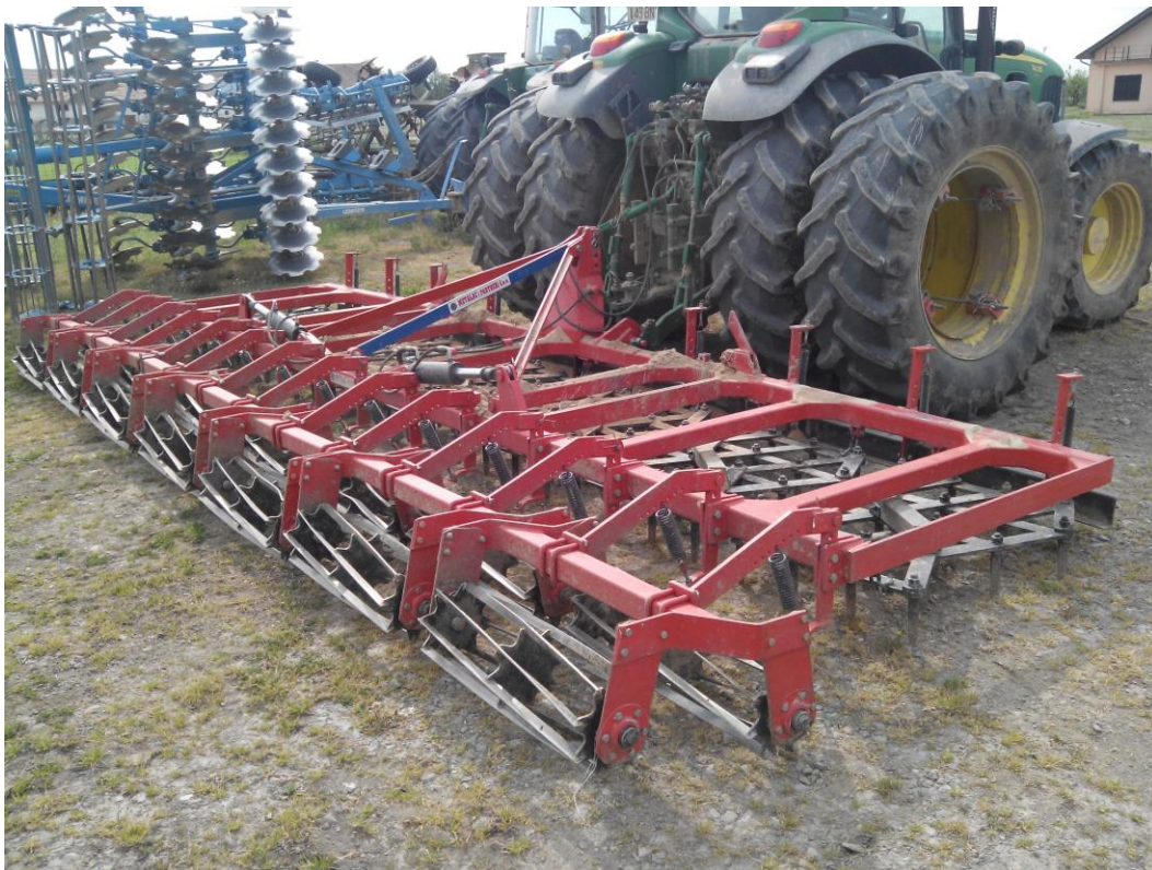
Slika 13. Drljača "Metalac"

"Hana-Koška" posjeduje tešku drljaču, marke "Metalac". Drljača, slika 13., u tvrtci se koristi u dopunskoj obradi tla. Drljača se održava tako da se prije početka rada vizualno pregleda, provjeri naoštrenost vrhova klinova, te podmažu ležajevi valjaka. Nakon završetka rada čisti se od nalijepljene zemlje i biljnih ostataka. Kod održavanja izostaje samo jedna mjera koju navode Emert i dr. (1995.), a to je provjera zategnutosti vijčanih spojeva.