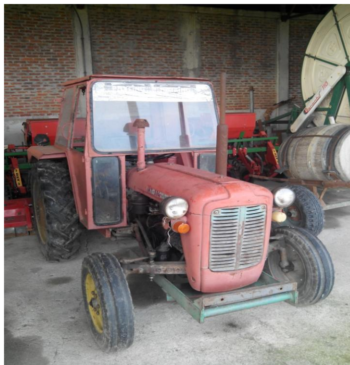
Slika 3. Lagani traktor "IMT 534"

Teški traktori, slika 5., se koriste za obavljane težih poslova kao što su: osnovna obrada tla i dopunska obrada tla.