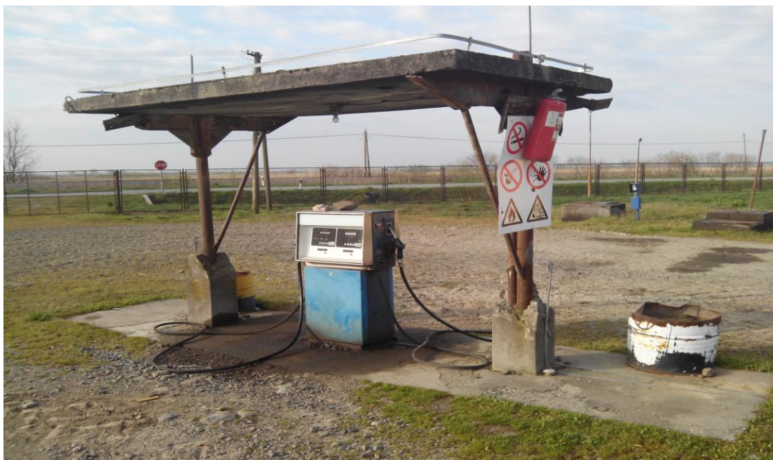
Slika 2. Crpna stanica za točenje goriva

U ekonomskom dvorištu se nalazi stanica za točenje goriva, slika 2. "Hana-Koška" raspolaže većim brojem traktora i priključnih strojeva koji su navedeni u tablicama 3., 4., 5. i 6.