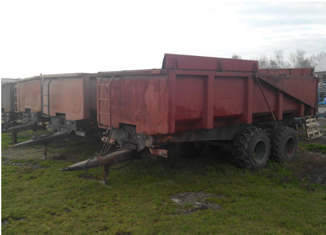
Slika 23. Prikolica "Zmaj-Zemun 520"