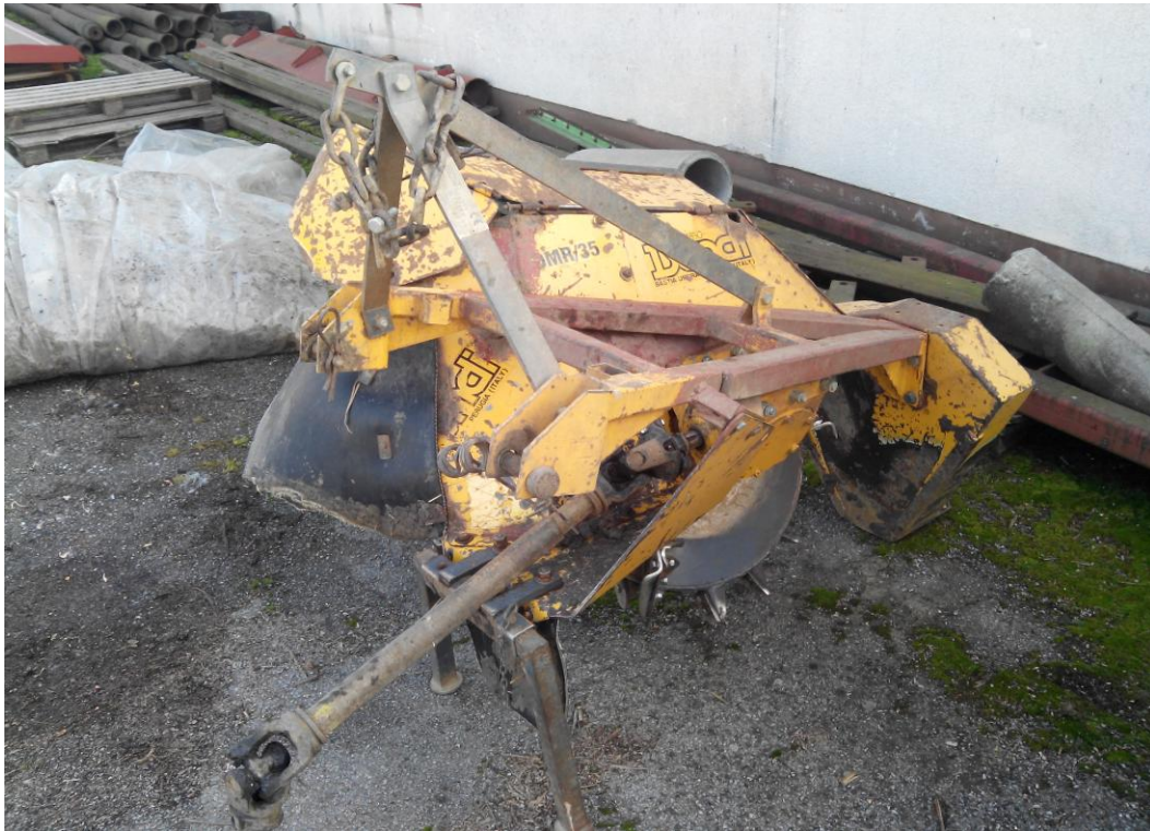
Slika 21. Kanalokopač "Dondi"