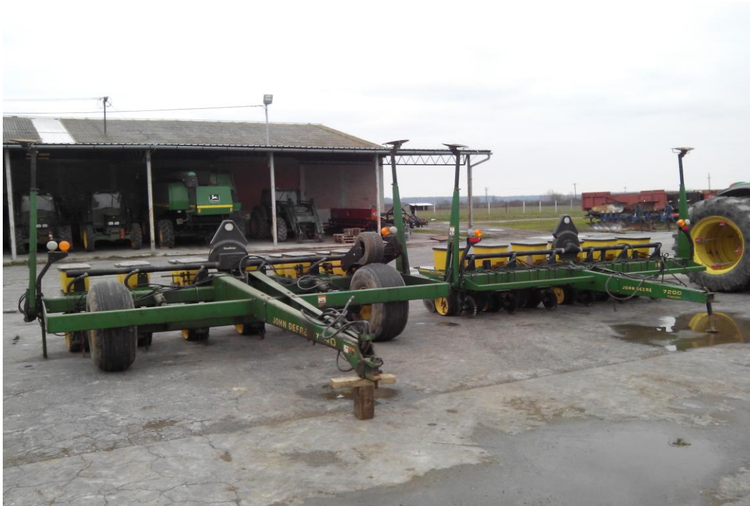
Slika 18. Sijačica za sjetvu okopavina "John Deere 7200"