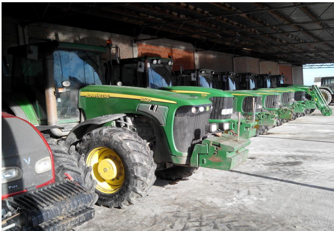
Slika 25. Garažiranje traktora u poluzatvorenom prostoru