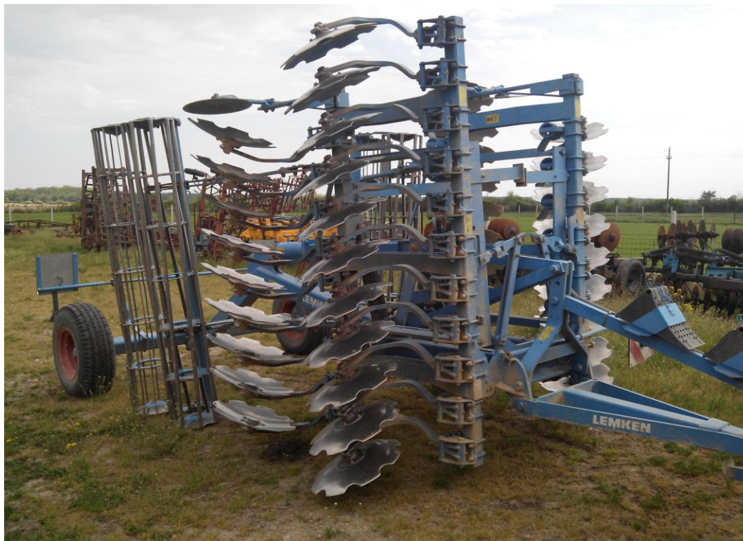
Slika 12. Vučena tanjurača "Lemken Rubin 9"

"Hana-Koška" posjeduje pet tanjurača, jednu marke "OLT Neretva", dvije "OLT Drave", jednu "RAU jean de bru", te "Lenkem Rubin 9". Tanjurača, slika 12., u tvrci se koristi u dopunskoj obradi tla. Tanjurača se održava tako da se prije početka rada vizualno pregleda, podmazuju se ležajevi baterija, provjerava se položaj čistača tanjura, te se povremeno provjerava tlak u pneumaticima. Nakon završetka rada tanjurača se čisti od zemlje i biljnih ostataka. Izostaje provjera vijčanih spojeva koju kao redovitu mjeru održavanja navode Emert i dr (1995.), zbog čega održavanje nije sukladno napatku za rukovanje i održavanje stroja.