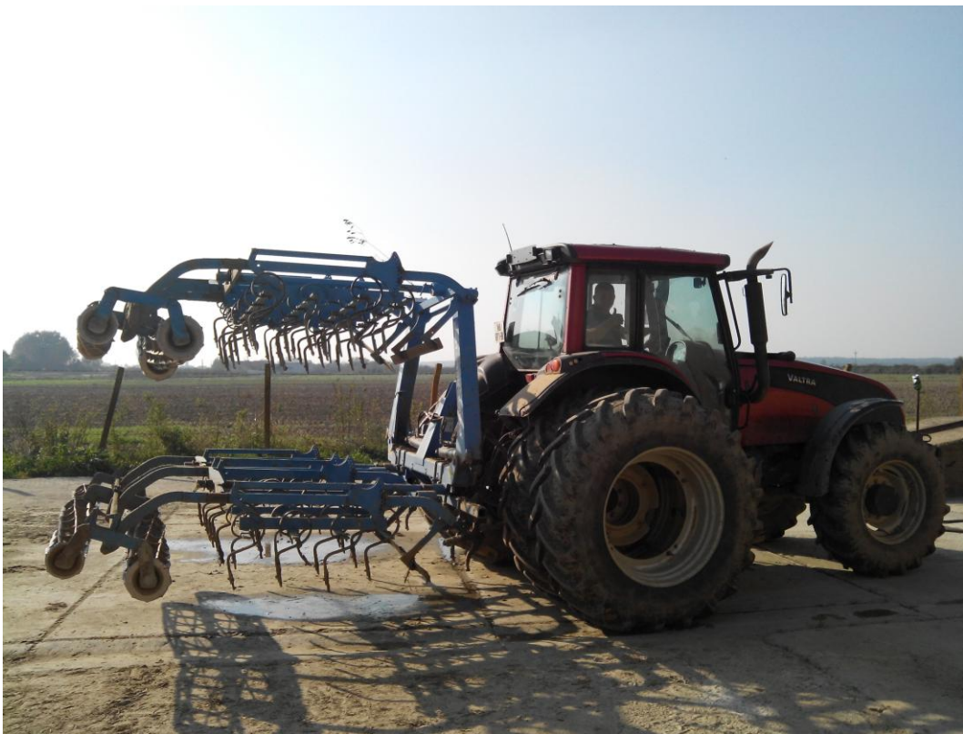
Slika 15. Sjetvospremač "Lemken Korund 600"

Sjetvospremač, slika 15., u tvrtci se koristi u dopunskoj obradi tla. Sjetvospremač se održava tako da se prije početka rada vizualno pregleda, provjere se vijčani spojevi, provjerava se ispravnost radnih elemenata i podmažu ležajevi valjaka. Nakon završetka rada stroj se čisti od nalijepljene zemlje i biljnih ostataka. Održavanje se obavlja sukladno naputku za rukovanje i održavanje.