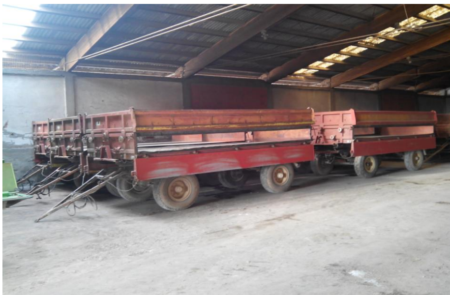
Slika 24. Garažiranje prikolica u zatvorenom prostoru

Nakon učinjene tehničke zaštite (konzervacije) strojeve bi trebalo garažirati. Emert i dr.(1995.), navode kako je poznata činjenica da atmosferski čimbenici (vlaga, kiša, snijeg, sunce i drugo) utječu na smanjenje zaštite strojeva, i onih koji su konzervirani, a pogotovo onih koji nisu. Prema izvedbi objekta razlikujemo tri načina garažiranja: garažiranje u zatvorenom, poluzatvorenom i otvorenom prostoru. "Hana" garažira kombajne, prikolice i prskalice u zatvorenom prostoru, slika 24. Svi traktori, sijačice, rasipači mineralnog gnojiva, hederi, kultivatori i slično se garažiraju u poluzatvorenom prostoru, slika 25. Većina strojeva za osnovnu i dopunsku obradu tla garažira se na otvorenom prostoru, dijelom na tvrdoj podlozi, a dijelom na mekanoj, slika 26. Nakon smještaja strojeva na otvorenom prostoru isti se više ne kontroliraju.