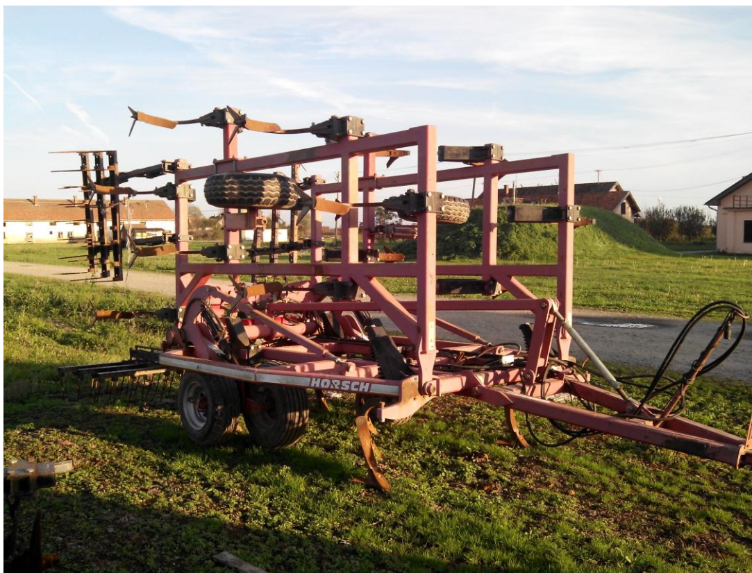
Slika 11. Gruber "Horsch Terrano F6"

"Hana-Koška" posjeduje gruber marke "Horsch Terrano F6". Gruber slika 11., u tvrtci se koristi u osnovnoj i dopunskoj obradi tla. Gruber se održava tako da se prije početka rada stroj vizualno pregleda, provjeri se naoštrenost motičica, podmažu mjesta predviđena za to, te se povremeno provjerava tlak u pneumaticima. Nakon završetka rada čisti se od nalijepljene zemlje i biljnih ostataka. Od ostalih mjera koje navode Emert i dr. (1995.), ne provodi se provjera zategnutosti vijčanih spojeva, zbog čega održavanje nije sukladno napatku za rukovanje i održavanje stroja.