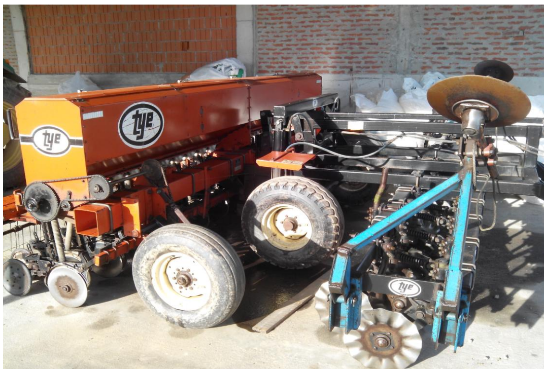
Slika 17. Sijačica za sjetvu strnih žitarica "Tye Notill system 2015"

Sijačica za sjetvu strnih žitarica, slika 17., održava se tako da se prije početka rada vizualno pregleda, provjeri ispravnost sprovodnih cijevi te podmažu za to predviđena mjesta. Prije početka sezone provjerava se tlak zraka u pneumaticima, a nakon završetka rada sijačica se čisti od nalijepljene zemlje. Kao redovita mjera održavanja izostaje provjera zategnutosti vijčanih spojeva.