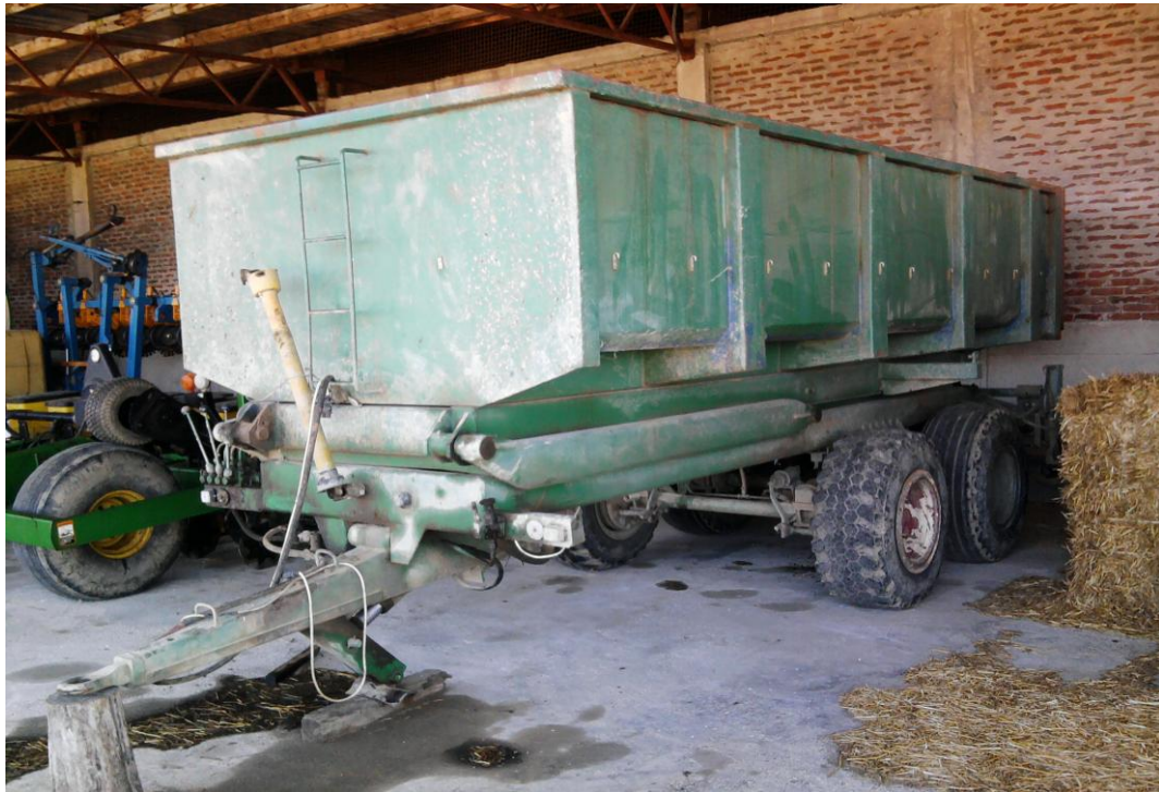
Slika 22. Prikolica "Tehnostroj PDU 10"