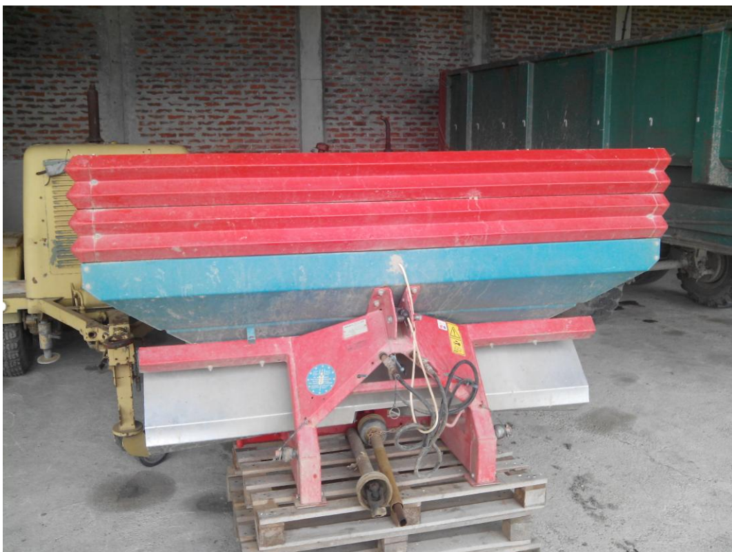
Slika 16. Rasipač mineralog gnojiva "Sulky DPX Prima"

"Hana-Koška" posjeduje dva rasipača mineralnog gnojiva, marke "Sulky DPX Prima". Rasipač, slika 16., održava se tako da se prije početka rada vizualno pregleda, povremeno se provjerava razina ulja u reduktoru. Nakon završetka posla, ako je ostalo gnojiva, rasipač se prazni i pere se. Mjere koje se ne obavljaju, a koje navode Emert i dr. (1995.), su provjera zategnutosti vijčanih spojeva i provjera razine ulja u reduktoru.