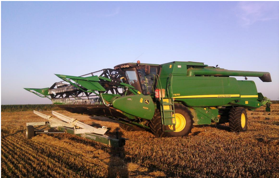
Slika 7. Kombajn "John Deere T 670"

Kombajn "John Deere T670.", slika 7., je najnoviji kombajn u tvrtci, kupljen 2010. godine također kao novi stroj. Motor je snage 278 kW/373 KS, zapremine 9,0 l. Kapacitet spremnika za zrno je 11000 l, radni zahvat hedera 7,6 m. Kombajn ima 6 slamotresa i kukuruzni adapter "Geringhoff Rota Disc " 8 redi.