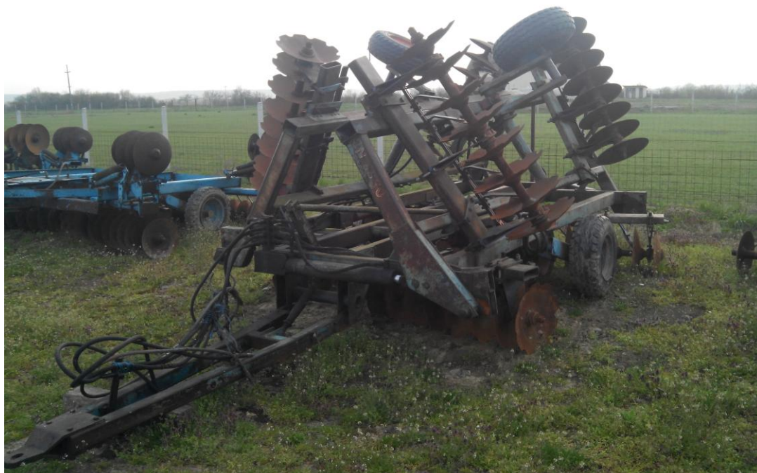
Slika 26. Garažiranje tanjurače na otvorenom prostoru