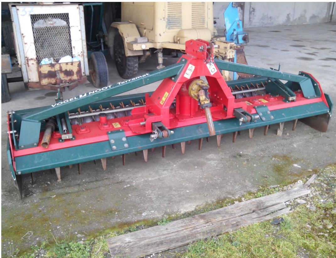
Slika 14. Rotodrljača "Vogel&Noot Terramat"

Rotodrljača, slika 14., u tvrtci se koristi u dopunskoj obradi tla. Rotodrljača se održava tako da se prije početka rada vizualno pregleda, provjeri razina ulja u reduktoru, podmažu ležajevi valjka, te provjeri ispravnost noževa. Nakon završetka rada stroj se čisti od nalijepljene zemlje i biljnih ostataka. Kao redovita mjera održavanja ne obavlja se provjera zategnutosti vijčanih spojeva, koju navode Emert i dr. (1995.).