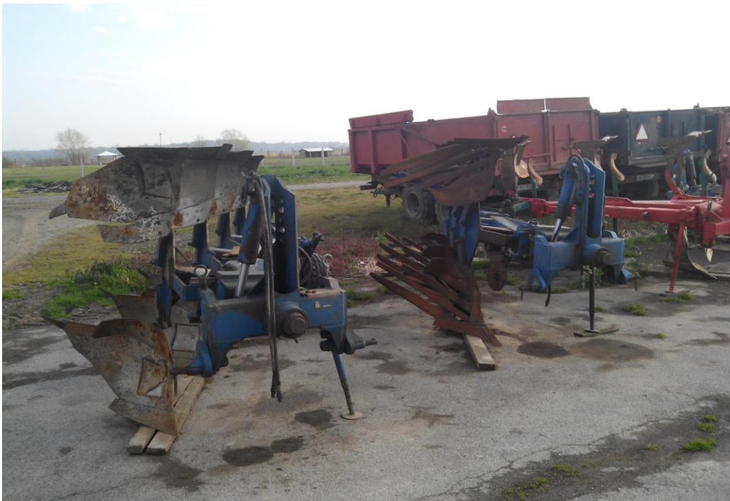
Slika 9. Plugovi "Rabe Werk"

"Hana-Koška" posjeduje četiri pluga, jedan četverobrazdni i tri trobrazdna pluga. Plug, slika 9., u tvrtci se koristi u osnovnoj obradi tla. Plug se održava tako da se prije početka rada vizualno pregleda, provjerava se naoštrenost lemeša, crtala. Nakon završetka rada plug se čisti od nalijepljene zemlje i biljnih ostataka, također i tijekom rada. Ostale mjere koje navode Emert i dr. (1995.) se ne provode, a to su: provjera zategnutosti vijčanih spojeva, te podmazivanje crtala. Održavanje se ne provodi sukladno s naputkom za rukovanje i održavanje stroja.