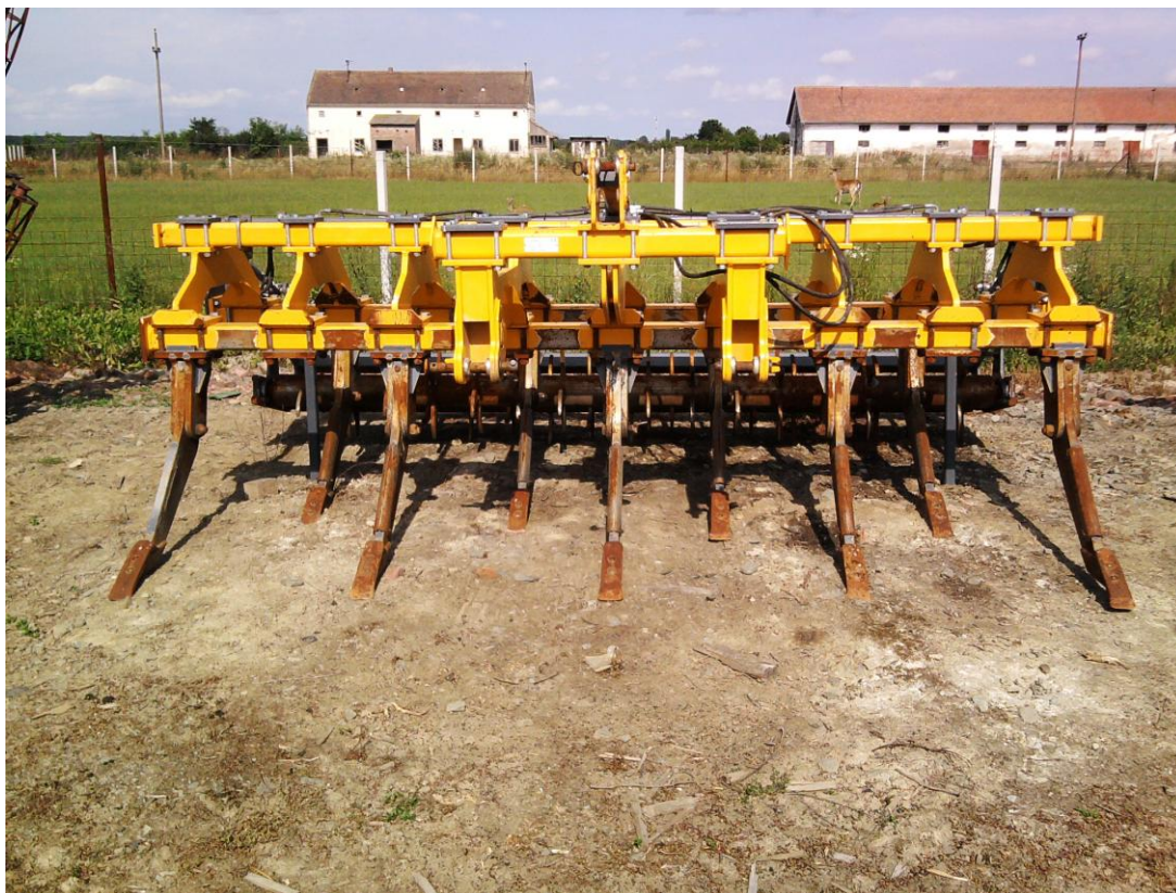
Slika 10. Podrivač "Dondi 809"

"Hana-Koška" posjeduje dva podrivača, jedan marke "Dondi", drugi "Ag Cret". Podrivač slika 10., u tvrtci se koristi u osnovnoj obradi tla. Podrivač se održava tako da se prije početka rada vizualno pregleda, provjeri ispravnost radnih organa i podmažu se ležajevi valjaka. Nakon završetka rada podrivač se čisti od nalijepljene zemlje i biljnih ostataka. Ostale mjere koje navode Emert i dr. (1995.) se ne provode, a to su: provjera zategnutosti vijčanih spojeva. Održavanje se ne provodi u skladu s naputkom za rukovanje i održavanje stroja.