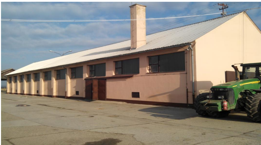
Slika 1. Radionica

"Hana-Koška" posjeduje modernu radionicu za popravak poljoprivrednih strojeva, slika 1. Radionica je opremljena, kovačnicom, bravarijom, tokarskim strojem, kanalom za popravak, a posjeduje i peć za grijanje prostora radionice na lož ulje. Tvrtka također posjeduje garaže, nadstrešnice i hangar za garažiranje poljoprivrednih strojeva.