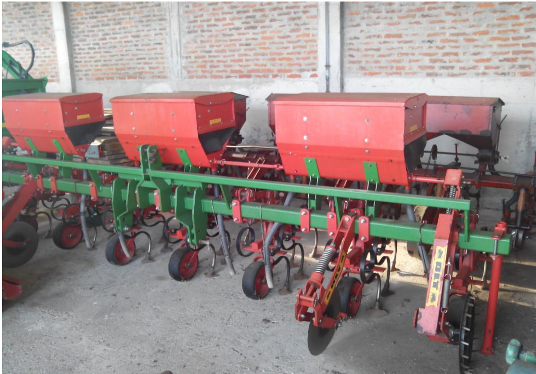
Slika 20. Kultivator "OLT"