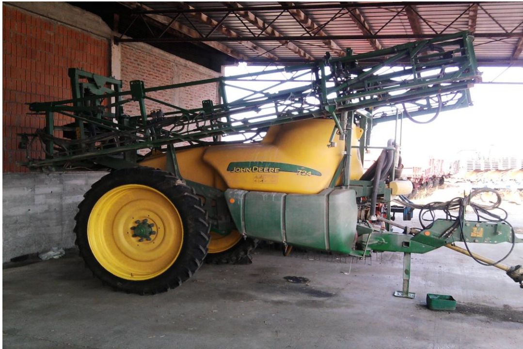
Slika 19. Prskalica "John Deere 724"