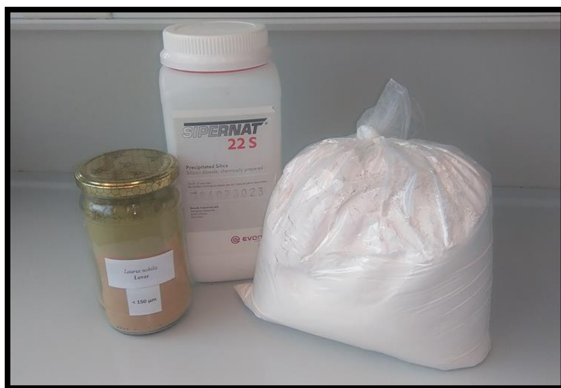
Slika 6. Prah lovora, silika gel Sipernat 22 S, DZ SilicoSec ®

Za pripremu formulacije DZ i biljnih komponenti (oznaka F Silico) korištena je DZ SilicoSec ® s udjelom od 48%, od biljnih komponenti korišteni su prah lovora, ulje lavandina i kukuruzno ulje s ukupnim udjelom od 25%, te dodatkom silika gela Sipernat 22 S i suhog neaktivnog kvasca s ukupnim udjelom od 27% (slika 6.).