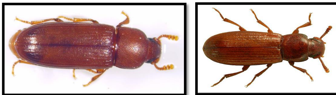
Slika 3. T. castaneum (lijevo Izvor: Autor H. Nemet) i T. confusum (desno)

Štetnici u brašnu, mlinarskim proizvodima, smjesama i lomu zrna. Imago je crveno smeđe do tamno kestenjaste boje, dužine 2,3-4,4 mm. Godišnje ima 2-3 generacije. Ličinka je crvenkasto-smeđe boje, dužine 6-7 mm. Sekundarni je štetnik, a ako je vlaga zrna viša od 12,5% mogu oštetiti i zdrava, neoštećena zrna (Rozman, 2010. a). Razlikuju se morfološki po segmentima ticala. T. castaneum ima 3 zadnja segmenta ticala izražajno veća, a kod T. confusum se segmenti ticala postupno šire prema vrhu (slika 3.). T. castaneum štete radi na vlažnim žitaricama (Hamel i Rozman, 2015.).