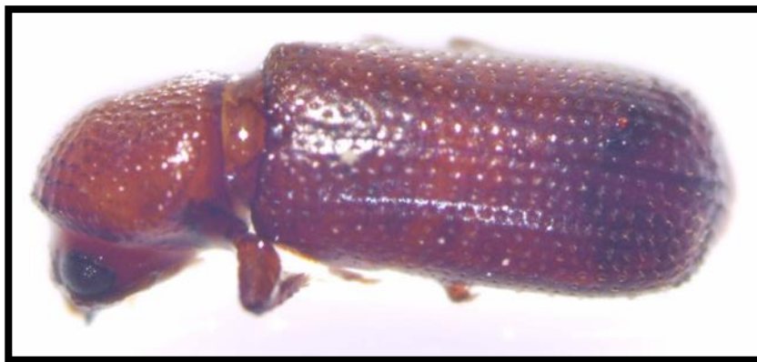
Slika 2. Žitni kukuljičar ( Rhyzopertha dominica Fab.)

Imago je tamnosmeđe do hrđaste boje, valjkasta oblika, dužine 2,3-3,0 mm. Vratni štitić u potpunosti prekriva glavu (slika 2.). Ličinka ima razvijena tri para nogu, bijele je boje i pokrivena je kratkim dlačicama. Za razvoj potrebna je visoka temperatura viša od 30 °C. Termofilna je vrsta. Prisutnost štetnika prepoznaje se po slatkastom mirisu zaražene pšenice. Zaraza se širi i letom jer ima dobro razvijena krila. Broj generacija: 2 generacije godišnje.