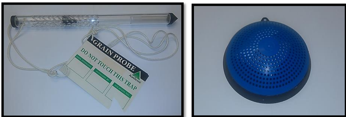
Slika 4. Lovke za hvatanje kukaca

Metode otkrivanja skladišnih kukaca mogu biti izravne (direktne) i neizravne (indirektne). Izravnim metodama se direktno na terenu uočava zaraza štetnika. Vizualnim pregledom objekta i uzorka određuje se apsolutna procjena populacije, a postavljanjem zamki ili lovki dobiva se relativna procjena populacije štetnika. Neizravne metode podrazumijevaju laboratorijske analitičke metode koje se koriste kada nije moguće dokazati zaraze uskladištenih proizvoda direktno na terenu, a postoji mogućnost skrivenih zaraza. U neizravne metode koristi se inkubacija, flotacija, bojanje, prozirnost, rendgenska metoda, respiracija i akustična metoda (Rozman, 2010. b).