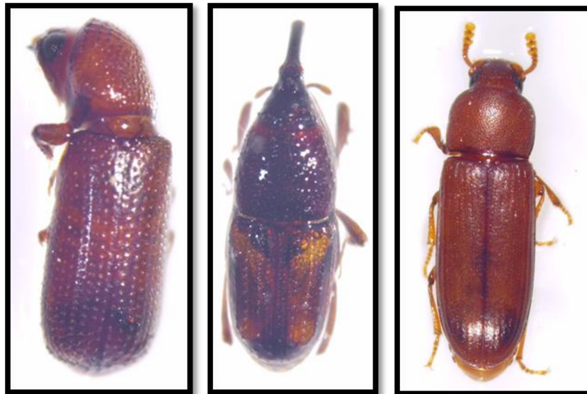
Slika 5. Korišteni kukci u istraživanju R. dominica (lijevo), S. oryzae (sredina) i T. castaneum (desno)

U istraživanju su korišteni odrasli kukci žitnog kukuljičara Rhyzopertha dominica Fabricius, rižinog žiška Sitophilus oryzae Linnaeus i kestenjastog brašnara Tribolium castaneum Herbst (slika 5.). Odabrane vrste su uzgajane u kontroliranim uvjetima pri temperaturi od 28 \pm 2 °C, i relativnoj vlazi zraka od 65 \pm 5\% . Uzgojna podloga za žitnog kukuljičara i rižinog žiška je bila pšenica, a za uzgoj kestenjastog brašnara, korišteno je oštro pšenično brašno s dodatkom 5% suhog neaktivnog kvasca. U staklenu posudu volumena 500 ml ispunjenu s 200 g pšenice, odnosno brašna stavljeno je oko 200 odraslih jedinki R. dominica , S. oryzae i T. castaneum , zasebno nakon čega je posuda stavljena u uzgojnu komoru. Nakon 7 dana (tijekom kojih je obavljena kopulacija roditeljskih parova i polaganja jajašaca) prosijavanjem su uklonjeni roditelji, a preostali sadržaj (pšenica, odnosno brašno s položenim jajašcima) je vraćen u uzgojnu staklenu posudu do razvoja odraslih jedinki. U tretmanima su korištene odrasle jedinke starosti od 2 do 4 tjedna, pomiješanog spola.