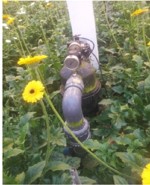
Slika 11. Visokotlačna crpka