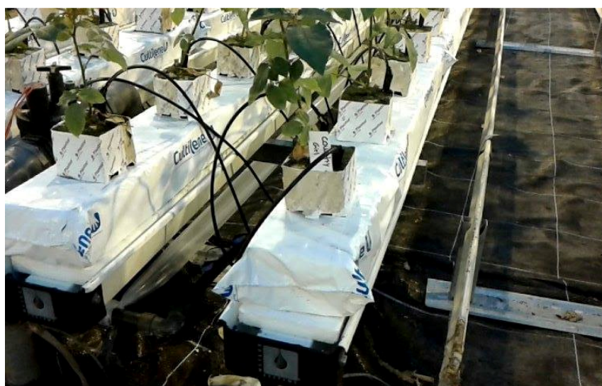
Slika 3: Prikaz postavljene crne vodopropusne folije

Nakon obavljenog drenažnog sustava slijedi postavljanje zaštitne folije. U ovom slučaju proizvodnje koristi se crna vodopropusna folija (Slika 3) dimenzija 3m x 20m koja ima svrhu zagrijavanja tla, sprječavanja rasta korova te sprječavanja pojave bolesti.