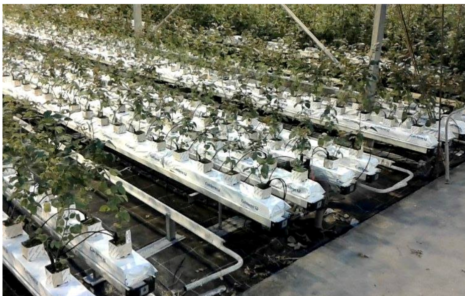
Slika 4: Prikaz stola za uzgoj ruža

Potrebno je izmjeriti cjelokupnu površinu za stolove. Stol (Slika 4 i 5) se sastoji od nosećih elemenata, koji su od nehrđajućeg čelika, aluminijskih kadica i izolacijskog materijala debljine 3cm (stiropor).