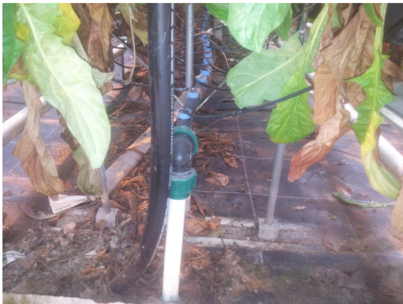
Slika 8. Kapajući ili drip sustav u uzgoju gerbera