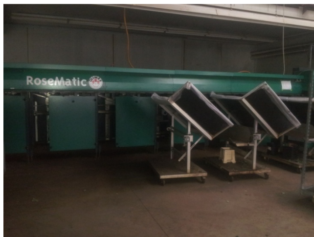
Slika 24. Sustav za sortiranje