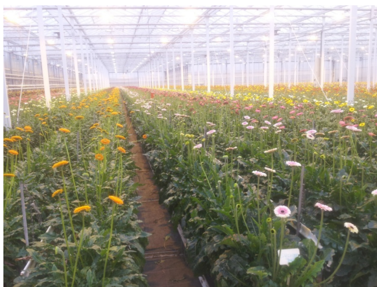
Slika 5: Prikaz stola za uzgoj gerbera