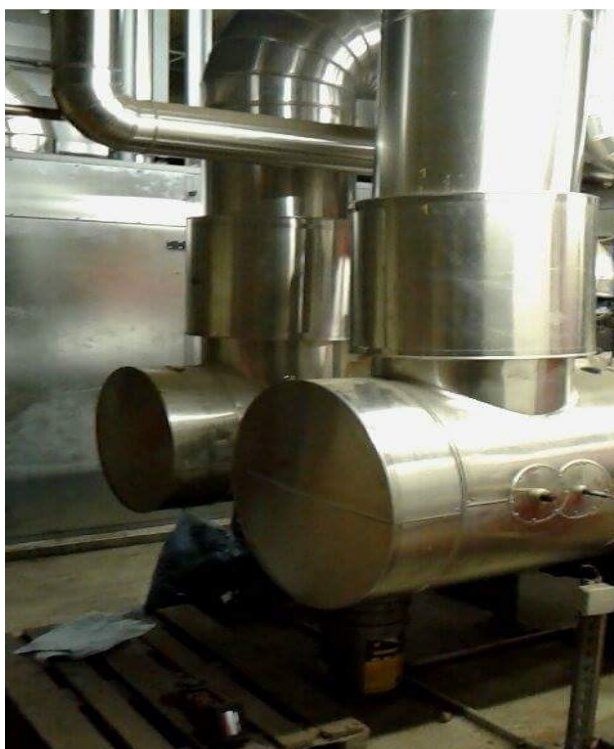
Slika 18. Kotlovnica

Gartenbau Wallner svoje staklenike zagrijava sistemom na zemni plin. Ovaj sustav se sastoji od kotlovnice (Slika 18) u kojoj se nalazi sva potrebna oprema da bi ovaj sustav pravilno funkcionirao te od popratnih izoliranih kotlova (Slika 19) u kojima se skladišti zagrijana voda. Visokotlačnim pumpama voda se odvodi do cijevi (Slika 20) koje su položene između stolova i na bočne strane staklenika.