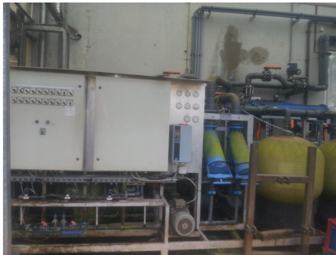
Slika 9. Kontrolna stanica

Osim sustava za prihranu u Gartenbau Wallner sastoji se od kontrolne stanice (Slika 9) , spremnika za hranjivu otopinu (Slika 10), visokotlačne crpke (Slika 11)