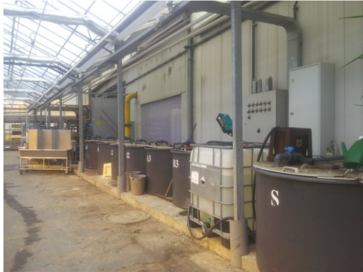
Slika 10. Spremnici za hranjivu otopinu

otopini, pomažu da se osigura optimalan odnos makro i mikrohraniva, što direktno utječe na povećanje produktivnosti u proizvodnji cvjetova gerbera.