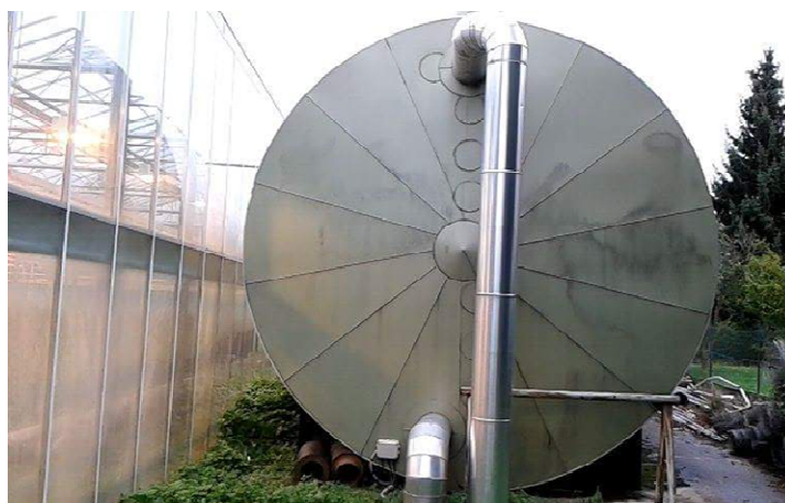
Slika 19. Spremnik za čuvanje tople vode