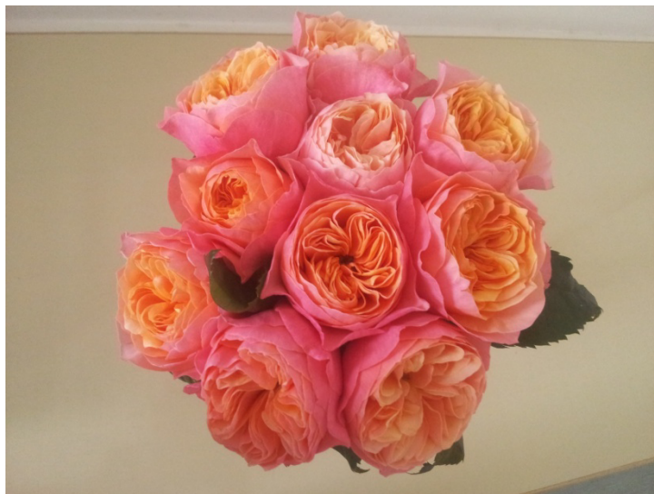
Slika 1. Vrsta ruže My Girl

Za vegetativni rast ruži je potrebna dnevna temperatura od 21° do 25° C i noćna od 16° do 18° C. Uz visok intenzitet svjetla, dnevna temperatura se može povisiti za 5° do 8° C. Najmanja temperatura koju ruža može podnijeti je do -18° C. Većina ruža ne voli ni pretjerane vrućine ni pretjeranu hladnoću. Važno je osigurati dobar protok zraka i da nema puno vlage jer ona pogoduje razvoju bolesti. (Paradžiković 2012.).