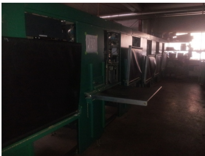
Slika 25. Sustav za sortiranje