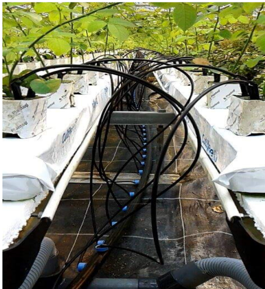
Slika 7. Kapajući ili drip sustav u uzgoju ruža

kapaljkom (cjevčica). U zatvorenom sustavu višak hranjive otopine koja otječe se vraća u spremnik za ponovnu upotrebu. Otvoreni sustav ne preuzima korištenu hranjivu otopinu.