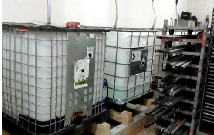
Slika 13. Makroelementi u plastičnim kontejnerima

Makroelementi (Slika 13) u tekućem obliku u Gartenbau Wallner se nalaze u plastičnim kontejnerima zapremnine 1000 litara, a mikroelementi se nalaze u praškastom obliku i u hranjivu otopinu se stavljaju u vrlo malim količinama.