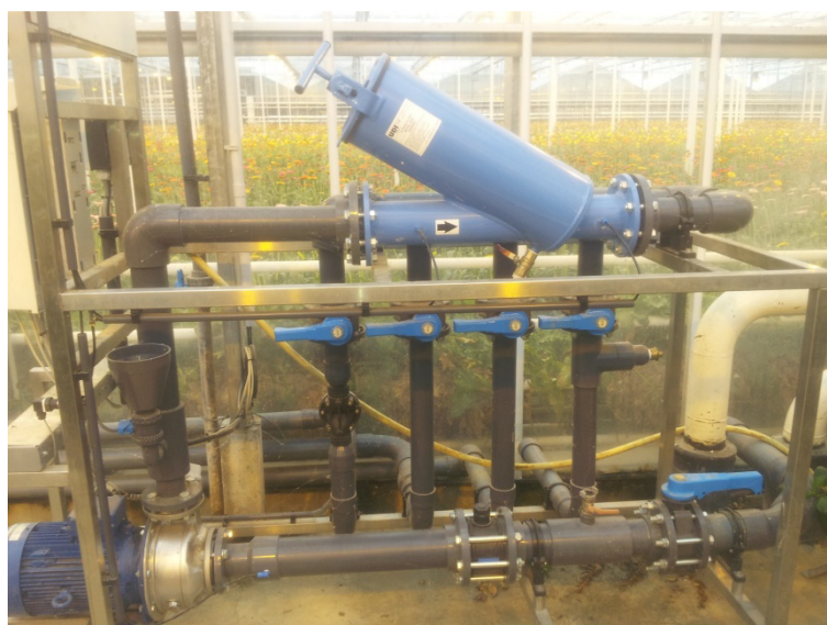
Slika 22. Crpna stanica i razdjelnica za vodu