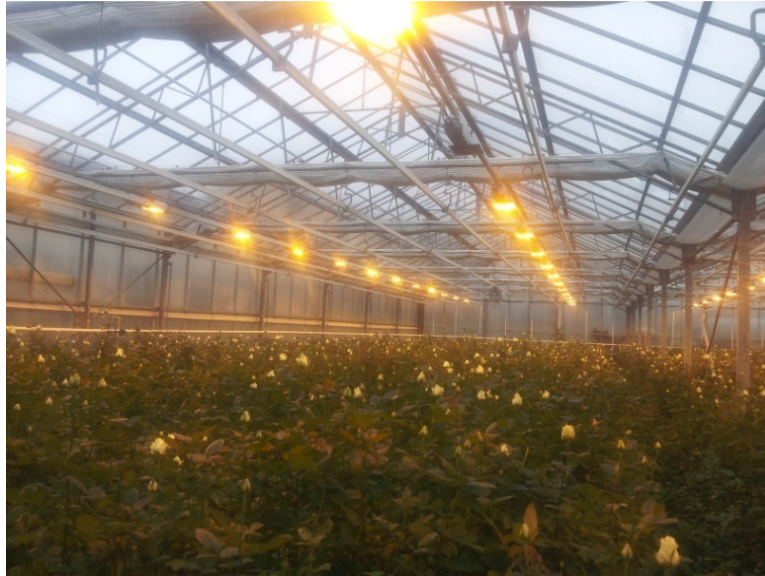
Slika 16: Asimilacijske lampe u ružama