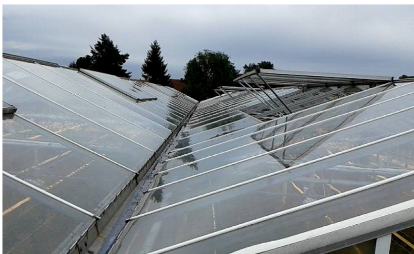
Slika 17. Krovni prozori

Suvremeni staklenici osim što su opremljeni modernom tehnologijom i tehničkom opremom da bi u potpunosti biljci omogućili nesmetan rast i razvoj tijekom cijele godine, moraju imati posebno kvalitetan sustav prozračivanja. Takav sustav u današnje vrijeme kontrolira se kompjuterski. Kako navodi Parađiković (2009.) detektori brzine i smjera vjetra te mjerači kiše ili snijega će osigurati pravovremeno zatvaranje svih otvora u slučaju pojave vjetra ili pojave bilo kojeg oblika oborina. Ti su senzori smješteni na krovu staklenika. Idealno prozračivanje staklenika je postavljanje i krovne i bočne ventilacije, ali takva investicija znatno poskupljuje izgradnju objekta. Krovno otvaranje ventilacije omogućava prozračivanje staklenika otvaranjem ili zatvaranjem krila u odnosu na smjer vjetra. Zatvorena ventilacija tvori kut od 24^\circ , a otvorena maksimalno 85^\circ . Takvo prozračivanje za vrijeme zimskih mjeseci ili jakih vjetrova može jako rashladiti staklenik, iz to razloga bočna ventilacija ima svoje prednosti jer omogućava kratko i brzo prozračivanje prizemnog dijela biljke.