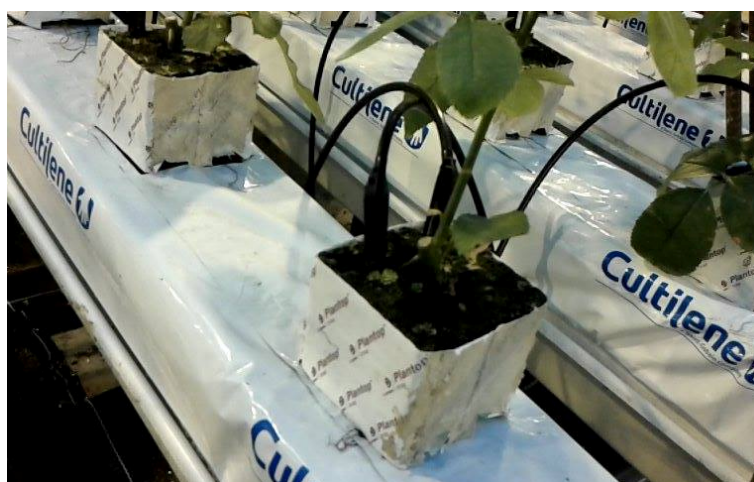
Slika 6: Supstrat kamena vuna

Borošić i sur., (2011.) navode da se supstrati pakiraju u polietilenske vreće. Vreće su specifičnog izgleda, naime, proizvode se na način da je unutarnja strana vreće crne boje, što sprječava razvoj algi, dok je vanjska strana bijele boje iz razloga što bijela boja reflektira svjetlo za vrijeme zimskih mjeseci i istovremeno sprječava pretjerano zagrijavanje korijena i cijelog područja oko korijena za vrijeme ljetnih mjeseci.