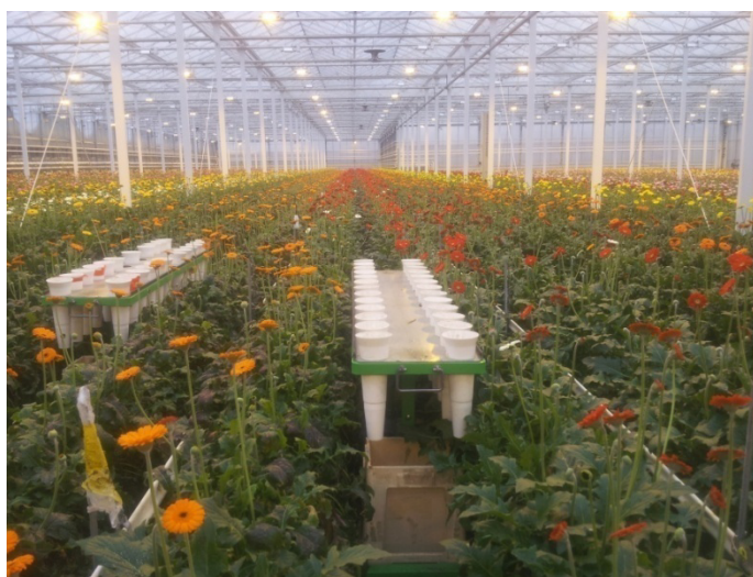
Slika 26. Branje gerbera (Fotografija: Mitrović D. 2017.)