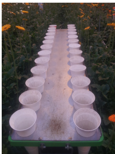
Slika 27. Pokretna kolica za rezani cvijet gerbera