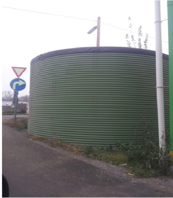
Slika 23. Spremnik za kišnicu