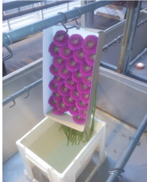
Slika 28. Sortiranje gerbera u kartonske kutije