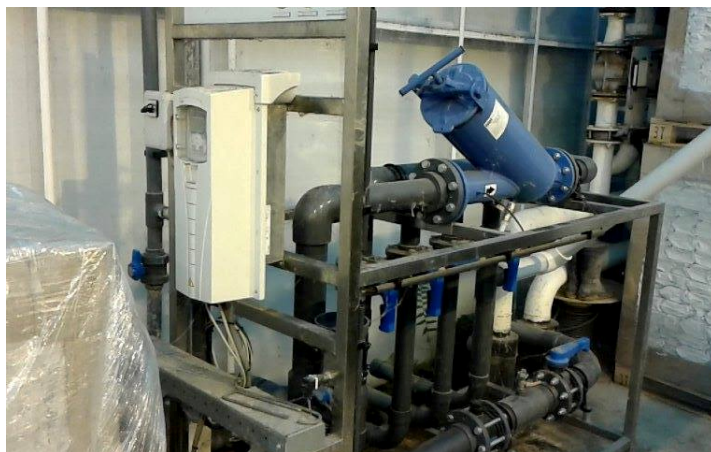
Slika 21. Kontrolni instrumenti na crpnoj stanici

Za oborinske vode ima potpuno automatiziran sustav (Slika 21 i 22) koji se sa sastoji od visokotlačnih crpki, ventila i prelivnih cijevi te kontrolnih instrumenata. Svrha sustava je odvodnja i prebacivanje oborinske vode u vanjske spremnike (Slika 23). Ovako uskladištena oborinska voda se u Gartenbau Wallner koristi za rashlađivanje krovnih panela u razdoblju velikih vrućina, kako bi se smanjila temperatura u stakleniku te u sanitarne svrhe prilikom pranja unutarnjeg dijela staklenika i njegovih bočnih strana.