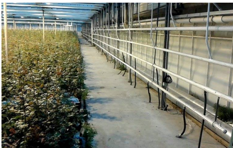
Slika 20. Cijeviza grijanje staklenika na bočnim stranama