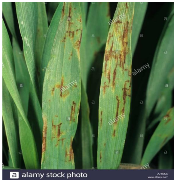
Slika 14. Mrežaste pjege na ječmu

Mrežasta pjegavost lista ječma je bolest koja je česta i raširena kod uzgajanih i divljih vrsta roda Hordeum , osobito ječma, u području umjerene klime, ali i u suhim područjima zapadne Australije. U Hrvatskoj je ova bolest redovito prisutna, osobito kada je proljeće vlažno. Tipičan simptom, po kojemu je bolest dobila ime, razvoj je malih tamnih pjega na plojci povezanih finom mrežom. Osim na plojci lista, simptomi mogu biti prisutni i na rukavcu, vlati i zrnu. Intenzitet zaraze ovisi o otpornost domaćina, patogenost uzročnika i okolinskim uvjetima. Prvi simptomi infekcije su male tamno smeđe pjege okruglog ili eliptičnog oblika. Pjege se s vremenom povećavaju, zahvaćaju tkivo između žila, a od njih dolaze uzdužne i poprečne linije koje stvaraju mrežu (Slika 14.). Preventivne i agrotehničke mjere značajno smanjuju intenzitet bolesti. To podrazumjeva plodored od najmanje dvije godine i zaoravanje biljnih ostataka, treba voditi računa i o gnojidbi. Pojačanom gnojidbom dušikom povećava se osjetljivost ječma na infekciju.