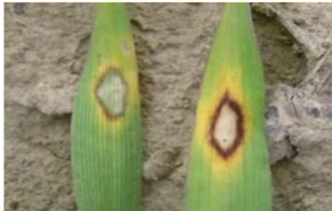
Slika 13. Pjege na listu ječma

Ova bolest je prvi puta opisana u Norveškoj 1880. Godine. Gubitci prinosa zrna mogu biti veći od 35%.