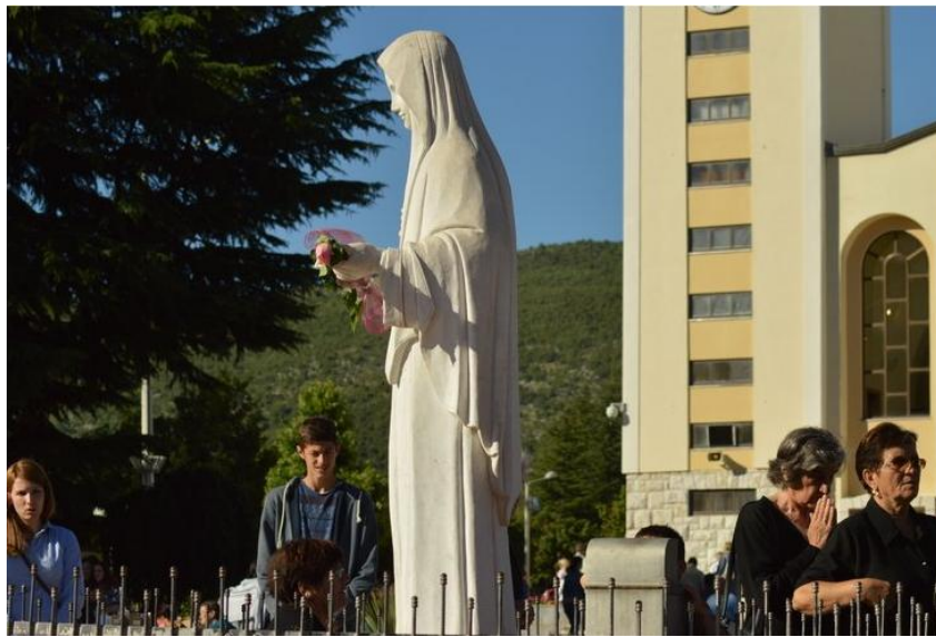
Slika 1. - Vjerski turizam; hodočašće u Međugorju