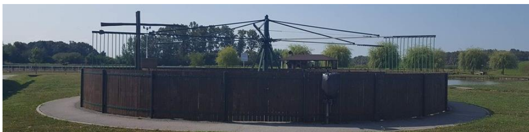
Slika 8. Šetalica za trening konja (Perković, 2017.)

Konji na ranču „Marin“ nakon napornog treninga mogu se opustiti u šetalici. Šetalica je mehanička sprava koja konja vodi u krug te mu omogućava da se stalno kreće. Na taj se način konji mogu ohladiti nakon treninga te mu se mišići postupno hlade i opuštaju. Šetalica također služi kao lagani trening zimi, kada se konji odmaraju za nadolazeću sezonu. Konji u šetalici treniraju svaki dan, 20 minuta. Tako im se održava kondicija te ih se lagano uvodi u pripreme koje su kasnije sve intenzivnije (Slika 8.) (Podaci trenera konjičkog kluba „Ramarin“).