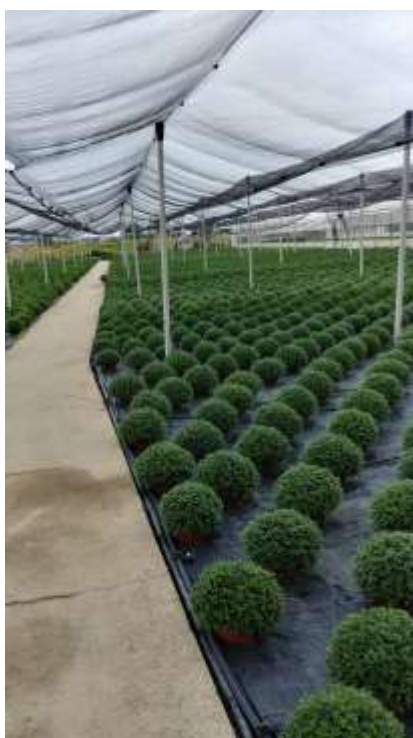
Prilog 3. Multiflora, Doljan