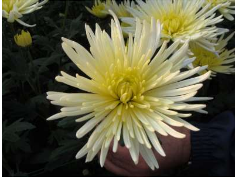
Slika 11. Špina ostavljena na 1 vrh