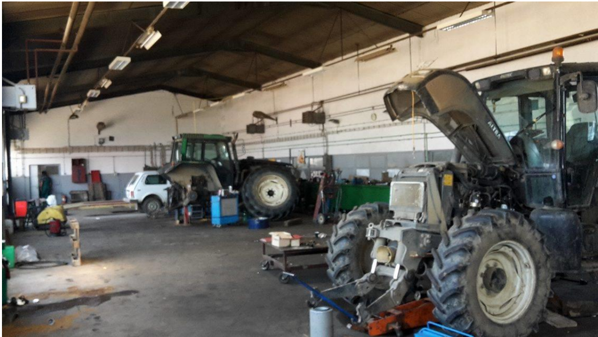
Slika 1. Hala za održavanje strojeva