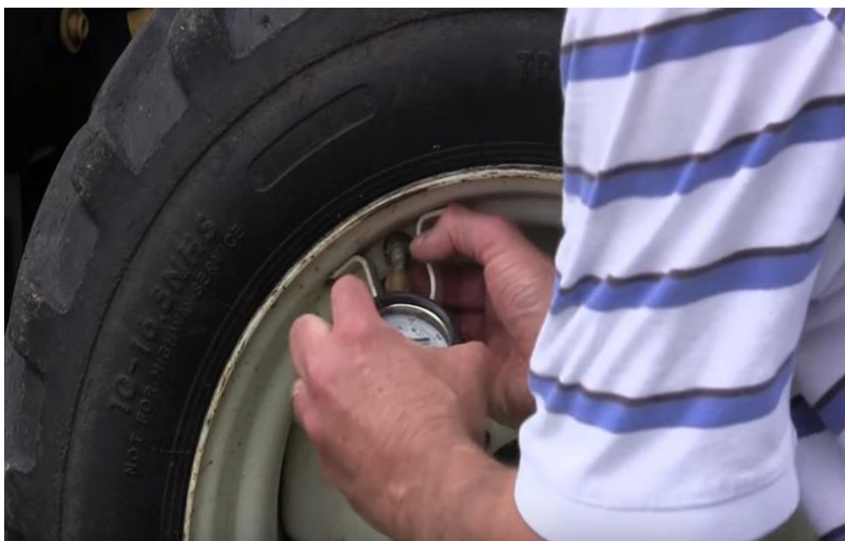
Slika 9. Provjera tlaka u pneumaticima

U tjednom održavanju također traktoristi se ne pridržavaju preporučenih mjera tjednog tehničkog održavanja. Provjerava se samo tlak u pneumaticima (slika 9.) i po potrebi se opere traktor (provjere razine elektorilita u akumulatoru, provjera ulja u zagonu, podmazivanje mjesta predviđenih za to i sl. se ne obavljaju).