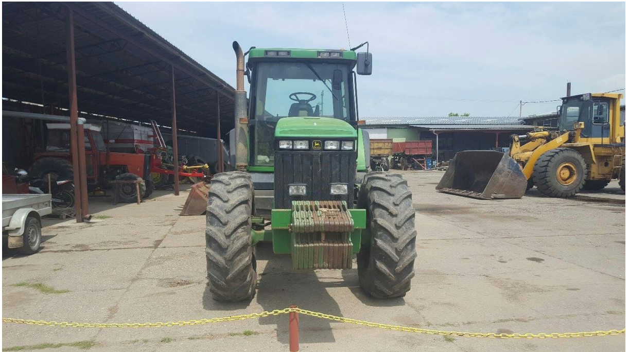
Slika 10. Garažiranje traktora na otvorenom prostoru.

Traktori su garažirani na otvorenom prostoru, na betonskoj podlozi (Slika 10.)