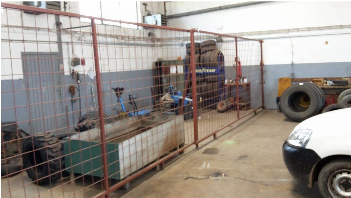
Slika 2. Vulkanizerska radionica