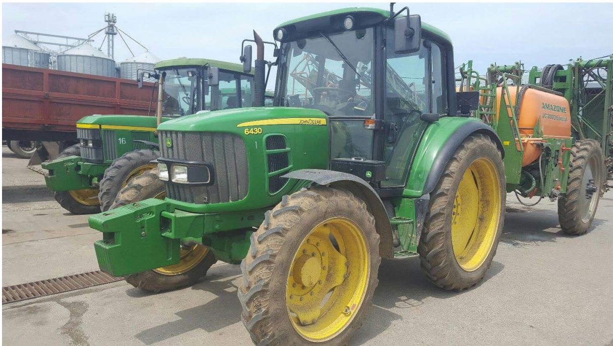
Slika 7. Traktor „John Deere“ 6430