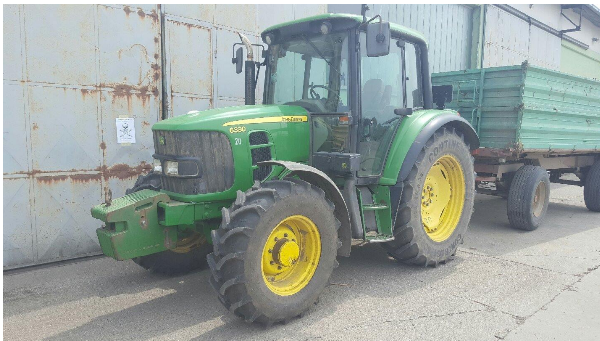
Slika 6. Traktor „John Deere“ 6330

U „Agro-Tovarnik“ d.o.o., održavanje strojeva se vrši u jamstvenom roku po uputama proizvođača i nakon odrađenih određeni broj radnih sati. Svaki stroj ima svoj priručnik za rukovanje, koji je dobiven uz kupljeni stroj. Tijekom jamstvenog roka dolaze majstori iz ovlaštenog servisa kako bih obavili potreban servis. Nakon što istekne jamstveni rok, radnici servisiraju traktor prema vlastitim procjenama i iskustvu ne pridržavajući se više servisnih radnji koje propisuje proizvođač.