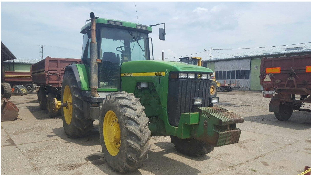
Slika 8. Traktor „John Deere“ 8100