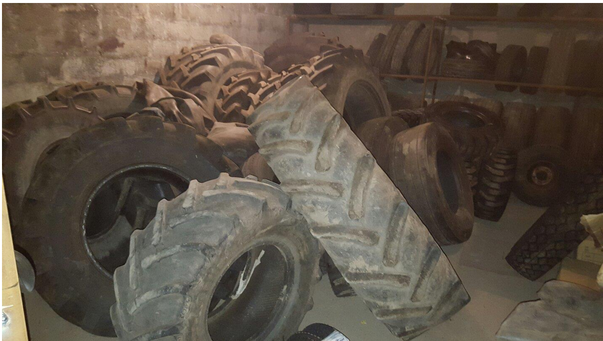
Slika 5. Skladište starih guma