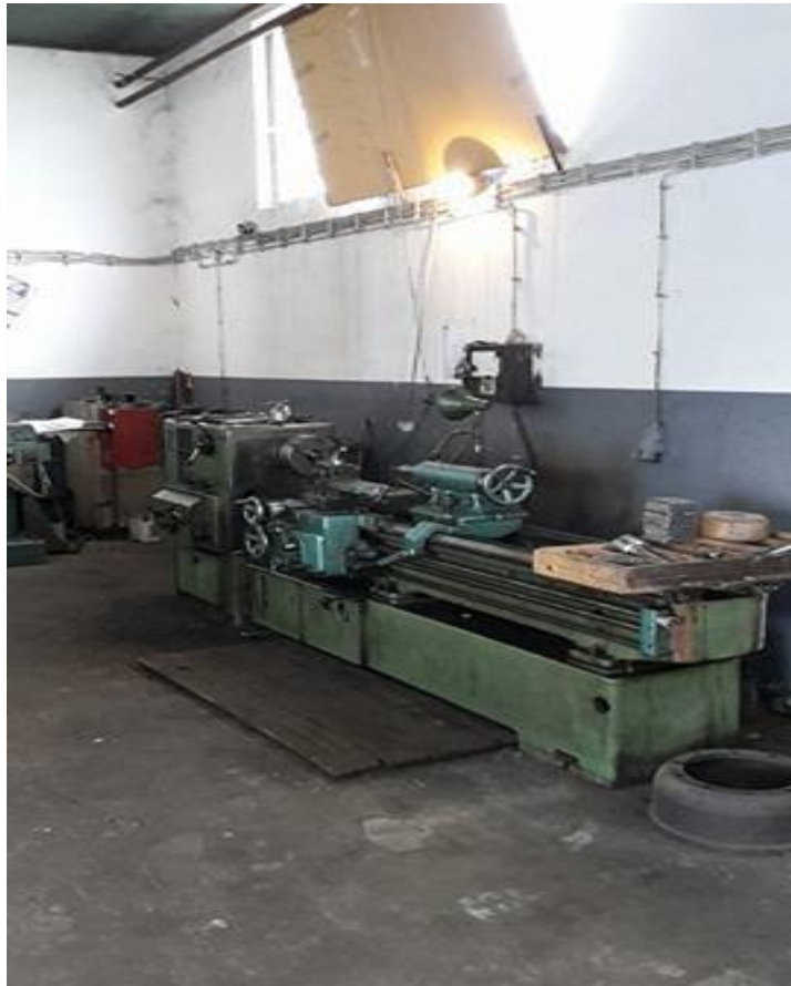
Slika 3. Tokarska radionica