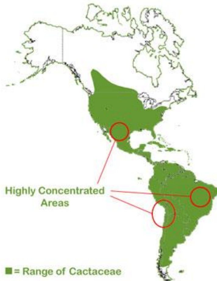
Slika 1: Porijeklo kaktusa

Kaktusi pripadaju porodici Cactaceae . Gotovo isključivo potječu iz Novog svijeta, odnosno iz Sjeverne, Srednje i Južne Amerike sa susjednim otocima (Slika 1). Područje rasprostranjenosti kaktusa se proteže od Kanade (gdje rastu zimootporne vrste opuncija) preko Meksika sve do južnih područja Čilea. Nalazimo ih i u visokim planinskim predjelima (u Andama čak i na visinama od 4000 metara) i u negostoljubivim kamenim pustinjama, gdje gotovo ni jedna druga biljna vrsta ne može opstati.