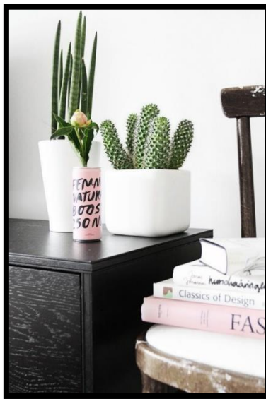
Slika 26: Kaktus kao sobna biljka

Većina kaktusa je manjeg rasta i ne zauzimaju mnogo prostora, stoga su vrlo zahvalni kao sobne biljke (Slika 28). Navikli su na suh zrak i malo vode, stoga ne traže puno pažnje i često zalijevanje. Saditi se mogu pojedinačno ili skupno u veću posudu, s čime postizemo efekt zelenog mini vrta.