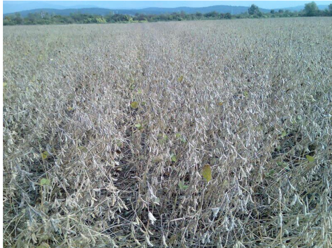
Slika 2. Soja pred žetvu

( http://poljoprivredni-forum.com/showthread.php?t=16343&page=14 )