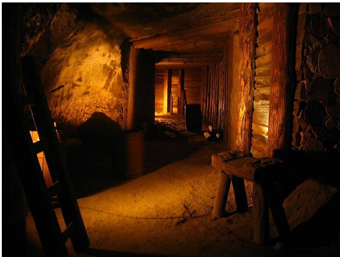
Slika 7. Rudnik soli Bochnia

Ispod 200 metara nalazi se sanatorij, lječilište s konstantnom temperaturom i vlažnošću. U rudniku se nalazi i muzej rudarstva s najvećom kolekcijom originalnih alatki i rudarske opreme koja ilustrira razvoj rudarske tehnologije od srednjeg vijeka do modernog doba.