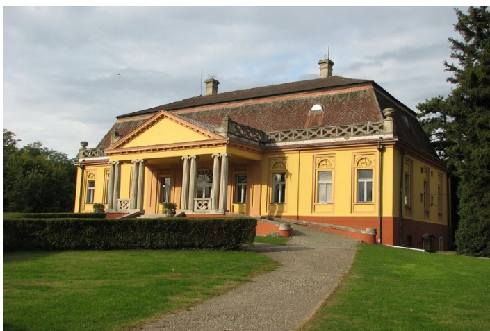
Slika 2. Poljoprivredni muzej u Kulpinu

Poljoprivredni muzej u Kulpinu čini kompleks „Kaštel“ i „Stari dvorac“ koji su stavljeni pod zaštitu države kao spomenici kulture, a sagrađeni su 1863. godine. U okviru kompleksa nalazi se osim dva dvorca, upravna zgrada, tzv. kovačnica, konjušnica i žitni ambar. Muzej je okružen velikim parkom od 4,5 ha koji predstavlja prirodni spomenik-stanište rijetkih i zaštićenih biljnih vrsta. Park u okviru posjeda je nekada predstavljao prvorazredno umjetničko djelo hortikulture i vrtne umjetnosti.