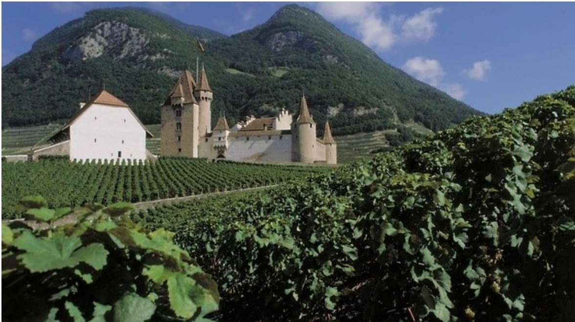
Slika 5. Dvorac Aigle

Dvorac Aigle je jedno vrijeme korišten u svrhu zatvora, vladinih zgrada i sl., ali od 1976. predstavlja stalni dom Muzeja vinove loze i vina. Posjetiteljima prikazuje proces nastanka vina od vinove loze do stola.