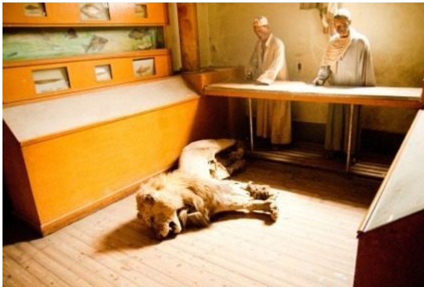
Slika 4. Poljoprivredni muzej u Kairu

Zbirka u muzeju je raspoređena u 10 dvorana. Dvorana od posebnog interesa jest „muzej kruha“ u kojemu je prikazano pečenje kruha, strojevi koji se koriste u pečenju, te razne vrste kruha iz prošlosti. Najzanimljiviji dio muzeja je, međutim, dvorana znanstvene zbirke anatomskih modela voska, prepariranih životinja, zbirke insekata i sl.