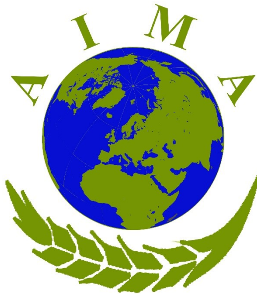
Slika 1. Logo AIMA-e