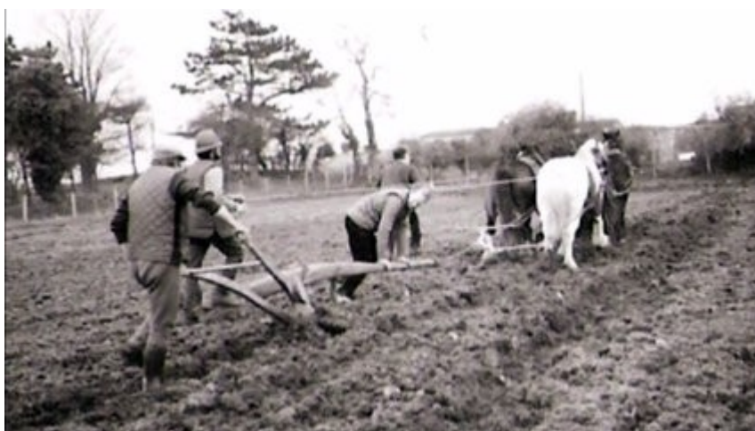
Slika 3. Bavljenje poljoprivredom u prošlosti