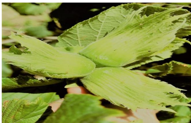
Slika 1. Sorta Istarski duguljasti