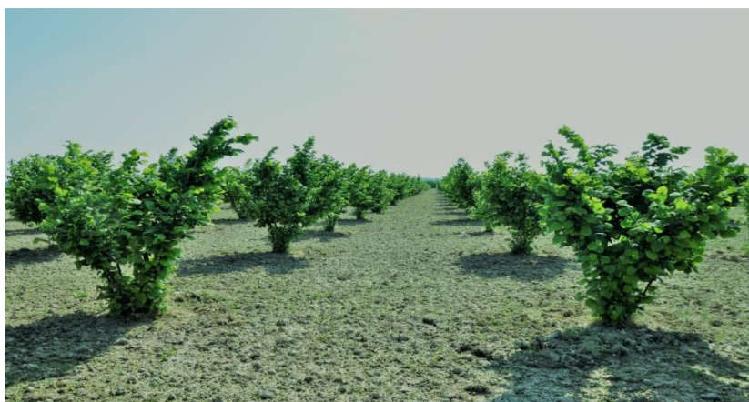
Slika 3. Nasad lijeske u PP Orahovica d.o.o.

Prvi nasadi lijeske u PP Orahovici d.o.o. zasađeni su 1981. godine na lokalitetima Bukvik i Vranovac u okolici grada Orahovice i općine Čačinci. Nasadi su podignuti u suradnji s Zavodom za voćarstvo, Agronomskog fakulteta u Zagrebu i tvrtkom Kraš. Zasađeno je ukupno 220 ha intenzivnih nasada.