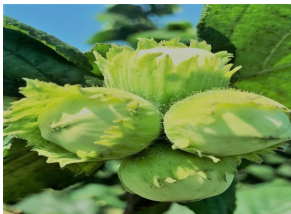
Slika 2. Sorta Rimski

Jezgra je slatkasta, žućkasto bijele boje, sa slabo izraženom aromom. Ljuska je srednje debela s uzdužnim tamnijim prugama i prugama svjetlo smeđe boje. U vrijeme berbe, plodovi sami ispadaju iz ovojnice, što olakšava strojno ubiranje plodova (Vujević, 2010.).