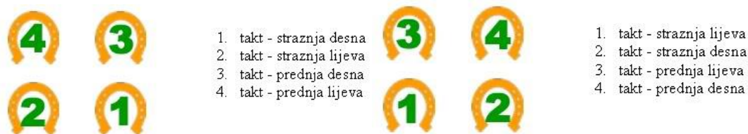
Slika 10: Lijevi i desni galop

Galop je najbrže kretanje konja. Dijeli se na lijevi i desni galop (Slika 10).