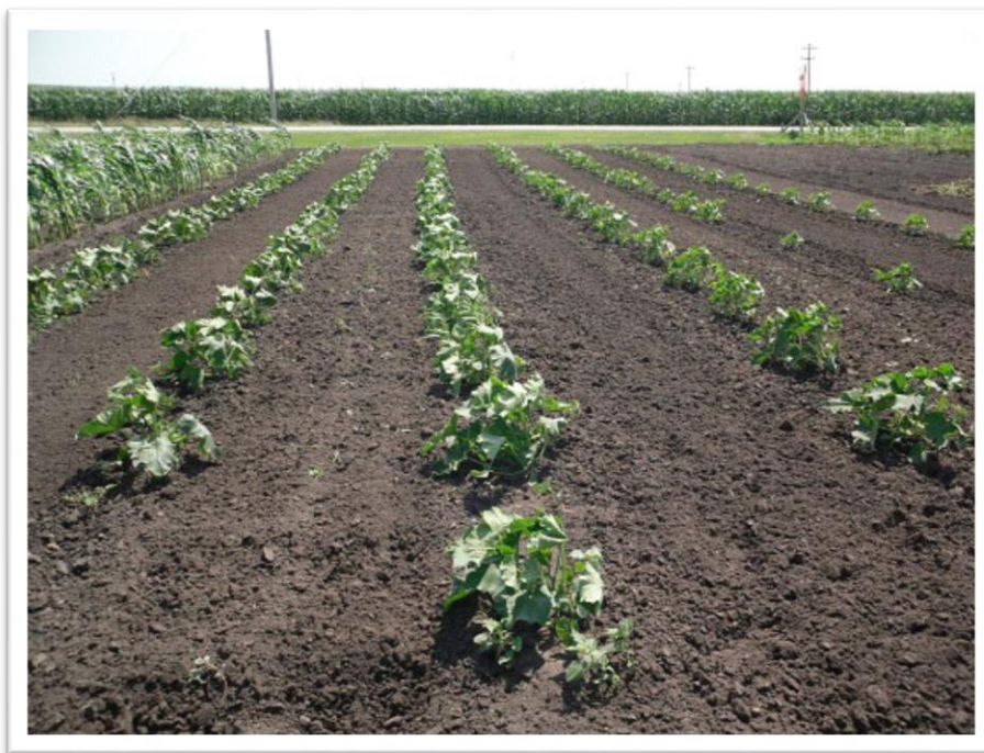
Slika 4. Optimalan sklop biljke

(Slika 4.), a sjeme sijemo na dubinu od 5 do 8 cm (Sito i sur.,2009.). Ako su rani rokovi sjetve te teže i vlažnije tlo sjeme bundeve sije se pliće, a kad je tlo suho i kad su rokovi ranije sjeme bundeve sije se dublje. Bundeve su vrlo osjetljive na kasne proljetne mrazeve, pa se sadnja na otvorenom uglavnom obavlja kada prođe opasnost od mrazova (Pleh i sur., 1998., Drvodelić, 2015.).