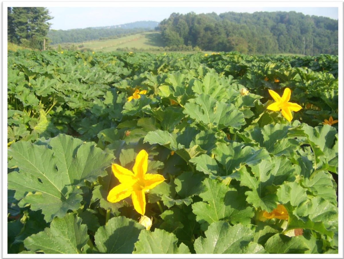
Slika 3. Latice koje su međusobno srasle