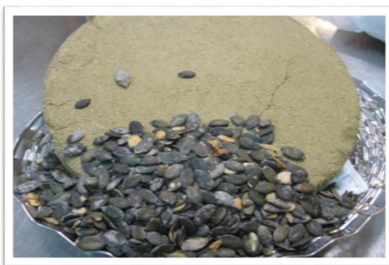
Slika 7. Sjemenke bundeve i pogača sjemenki bundeve

Pogača sjemenki bundeve je vrlo kvalitetan nusproizvod bogata sirovim bjelančevinama, nastala pri proizvodnji bundevinog ulja (Slika 7.) (Tablica 4.) (Moslavac i sur., 2017.). Pogače sjemenki bundeve imaju promjenjiv kemijski sastav i hranjivu vrijednost koja ovisi o udjelu ljuske i ulja u njoj (Domaćinović, 2006.). Pogača sjemenki bundeve može se koristiti u hranidbi različitih životinja, kao što su mliječne krave u tovu svinja, u hranidbi peradi te kao mamac za ribe (Pirman i sur., 2007). Pogače sjemenki bundeve mogu biti od djelomično oljuštenih sjemenki, bjelančevinaste vrijednosti 400 – 450 g/kg, 150 – 250 g/kg sirove vlaknine te oko 100 g/kg sirove masti, no ako govorimo o pogačama sjemenki bundeve bez ljuske one mogu sadržavati i do 500 g sirovih bjelančevina /kg (Domaćinović, 2006.). Pogača sjemenki bundeve može se uključiti u obroke životinja kao alternativno krmivo soji koja se sa svojim nusproizvodima koristi kao dobar izvor bjelančevina (Antunović i sur., 2015., Klir i sur., 2017a.).