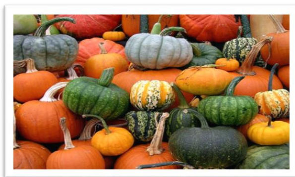
Slika 1. Različite vrste bundeva

Unutar porodice postoji veliki broj biljaka, a porodica se sastoji oko 965 vrsta i oko 95 rodova (Slika 1.). Bundeve pripada porodici Cucurbitaceae , a nju čine Cucurbita Moschata , Cucurbita Pepo , Cucurbita Maxima , Cucurbita Mixta , Cucurbita Ficifolia , te prve tri od njih Cucurbita Moschata , Cucurbita Pepo , Cucurbita Maxima predstavljaju ekonomski važne vrste koje se uzgajaju diljem svijeta i imaju visoku proizvodnju (Caili i sur., 2006., Zhou i sur., 2007.), a kao izvanredno ukusna hrana koristi se C. Moschata – bundeva šećerka – bogata vitaminom E i mikroelementima, te specifičnog okusa koji podsjeća na kesten pire (Pleh i sur., 1998.). Među pripadnicima roda Cucurbita najraširenije su vrste Cucurbita pepo – buča i Cucurbita maxima – bundeva, koje se razlikuju po tvrdoći perikarpoida i obliku cvjetne stapke. Zbirka naziva ne postoji samo u našem jeziku (bundeve, buča, tikva i veliki broj lokalnih naziva), već isto nalazimo i u drugim jezicima (npr. u engleskom pumpkin , squash , gourd ) i razlika među njima je često nejasna. Riječ bundeva najbolje opisuje sve pripadnike ove porodice s obzirom na to da je za ulje koje se dobije iz njenih sjemenki uobičajen naziv ulje bundevinih sjemenki (Pleh i sur., 1998.).