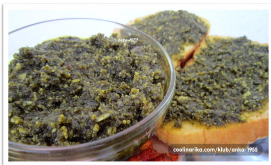
Slika 9. Namaz od sjemenki bundeve

Sjemenke se u domaćinstvu mogu koristiti umjesto oraha, lješnjaka i badema, a mogu se koristiti i kao pržene te se upotrijebiti kao grickalice. Naime sjemenke bundeve mogu se iskoristiti i u pravljenju pekmeza i namaza (Slika 9.), a korisne su kao dodatak i u pravljenju kruha (Slika 10.) (Pleh i sur., 1998.).