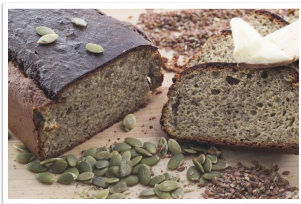
Slika 10. Kruh od sjemenki bundeve