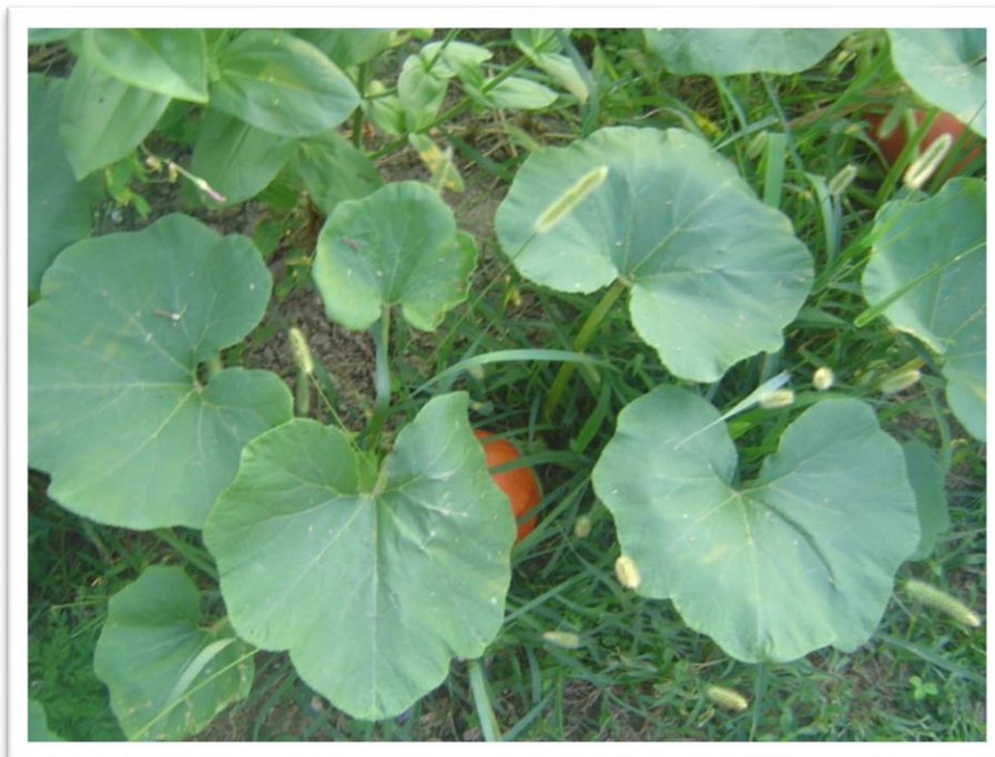
Slika 2. Lisna plojka bundeve

jako veliku lisnu plojku, čija površina može biti gola ili obrasla dlakama (Slika 2.). Zbog velike lisne površine koja ima veliki potencijal za transpiraciju i zbog snažnog korijenovog sustava ima mogućnost usisavanja velike količine vode, a pojedinačna biljka preko ljeta troši oko 30 do 50 litara vode (Pleh i sur., 1998.).