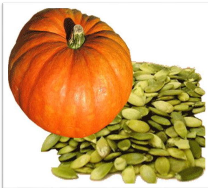
Slika 5. Sjemenke bundeve

pomaže u borbi protiv slobodnih radikala. Vitamin E se nalazi u formama: alpha-tokoferol, gamma-tokoferol, delta-tokoferol, alpha-tokomonoenol i gamma-tokomonoenol (Pleh i sur., 1998.).