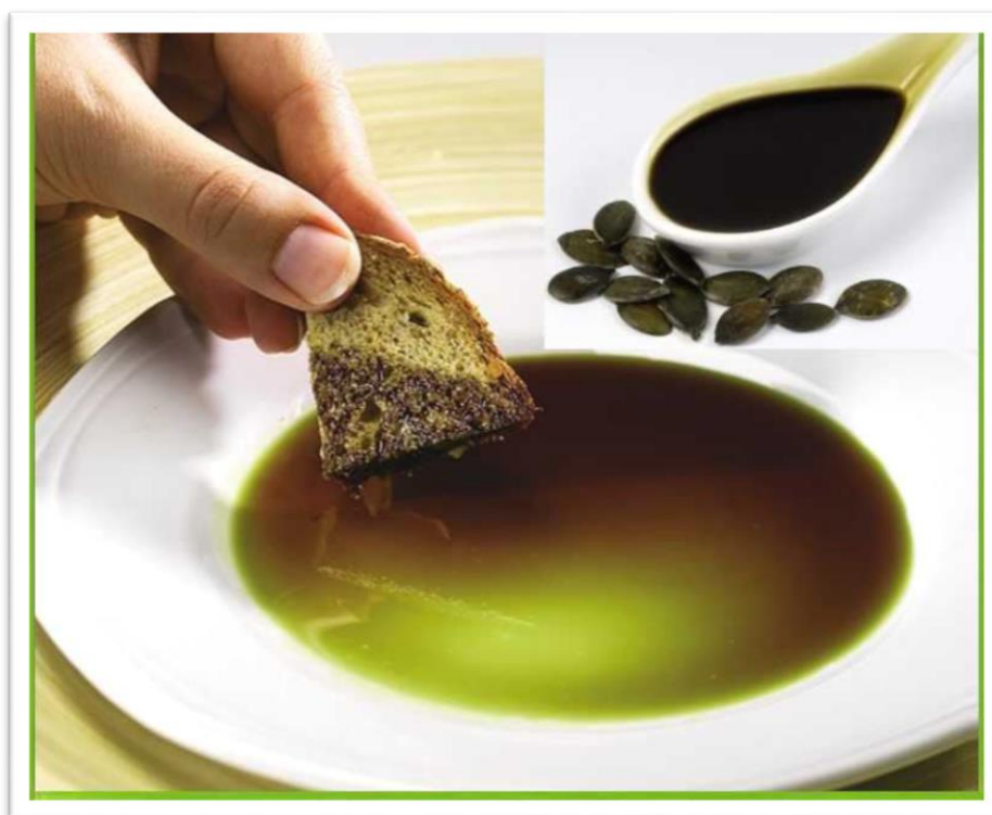
Slika 11. Ulje bundeve

Bundevino ulje kao ljekovito svojstvo do nedavno nije imalo pretežito veliko značenje. Međutim, sve više se spominje njegovo antihelmintičko djelovanje, kakvo imaju i sjemenke bundeve, snažno antioksidativno djelivanje, te preventivno služi kao dobro oruđe u borbi protiv hipertenzije i karcinogenih bolesti (Rezig i sur. 2012., Bardaa i sur., 2016.). Ulje bundeve ima zdravstveni učinak u liječenju hipertrofije prostate i povoljno djeluje na hormonalne regulacije u organizmu (Slika 11.). Uz sve to ulje bundeve sadrži korisne nutritivne komponente kao što su esencijalne masne kiseline, amino kiseline, fitosteroli, \beta -karoteni, lutein (Abbas i sur.2016.). Bistvo ulje ima antimikrobni učinak i učinkovito je protiv velikog broja bakterija, kao i antifugalno djelovanje (Hammer i sur., 1999., Abbas i sur.2016.).