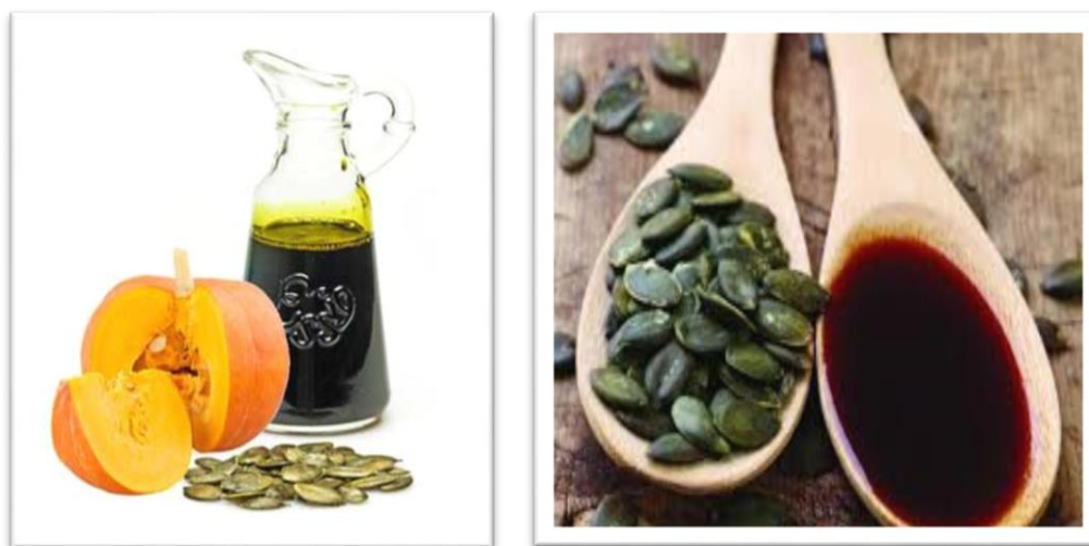
Slika 6. Ulje bundeve