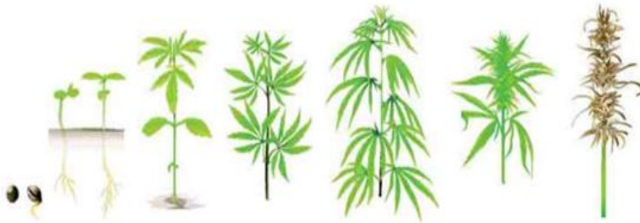
Slika 1: Životni ciklus industrijske konoplje