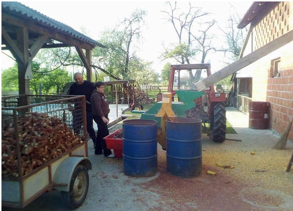
Slika 3. Krunjenje kukuruza

Proces krunjenja kukuruza: Klipovi kukuruza se spuštaju pomoću lijevka u usipni koš krunjača. Unutar krunjača se nalazi nazubljeni valjak koji odvaja zrna kukuruza od oklaska. Zatim se oklasci razdvajaju od zrna, nakon čega se treskanjem prosijava zrna od nečistoća. Na kraju procesa pužni transporter podiže čisto zrna kukuruza do isipnog koša. Krunjač kukuruza pokreće kardanski prijenos u traktoru, a brzina okretaja je 1500 okretaja u minuti.