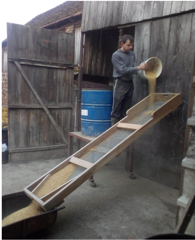
Slika 4. Prosijavanje soje

Prilikom prosijavanja koristi se sito koje je izrađeno za vlastite potrebe. Sastoji se od drvenog okvira i žičane mreže. Kako ne bi došlo do uvijanja mreže prilikom prosijavanja na tri mjesta su postavljene drvene daske.