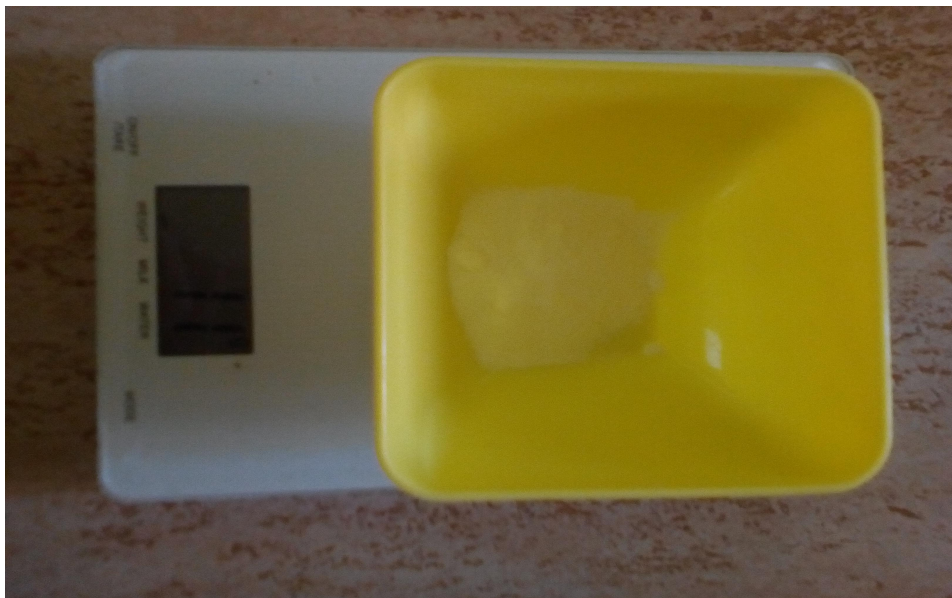
Slika 7. Vaganje arome vanilije

Za vaganje sirovina koristi se opružna vaga, koja važe masu sirovine do 30 kilograma. Prednost opružne vage je u tome što je malena i jednostavna za rukovanje. Ne zauzima puno prostora, a dovoljno je precizna za vaganje većih količina sirovina. Izvagane sirovine žitarica i uljarica ručno se usipavaju u usipni koš mlina čekičara.