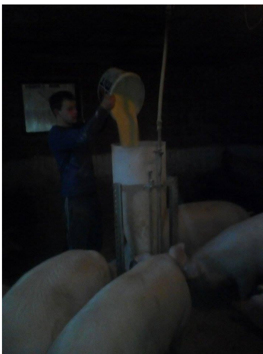
Slika 17. Punjenje automatske hranilice