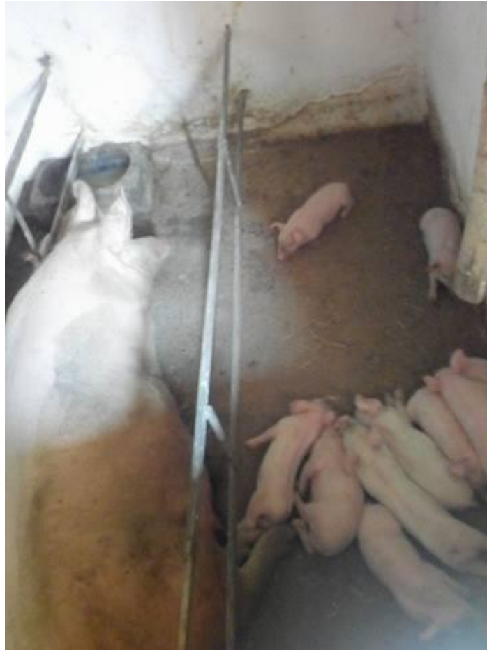
Slika 14. Krmača s prascima starosti 2. tjedna