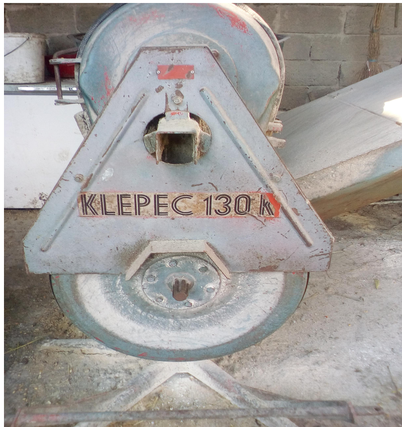
Slika 9. Klepec 130 K

“Slikanjem s ultrabrzim kamerama u mlinu čekičaru potvrđeno je da se sudar čestice i čekića ne ponavlja nakon prvog sraza čekića s česticom. Kada se čestica rasprsnula zbog djelovanja kinetičke energije, preostali dijelovi usitnjene čestice se više ne sudaraju s čekićima, već se daljnje usitnjavanje može prepisati samo trenju i sudarima sa sitom.” (Marić, 2005.)