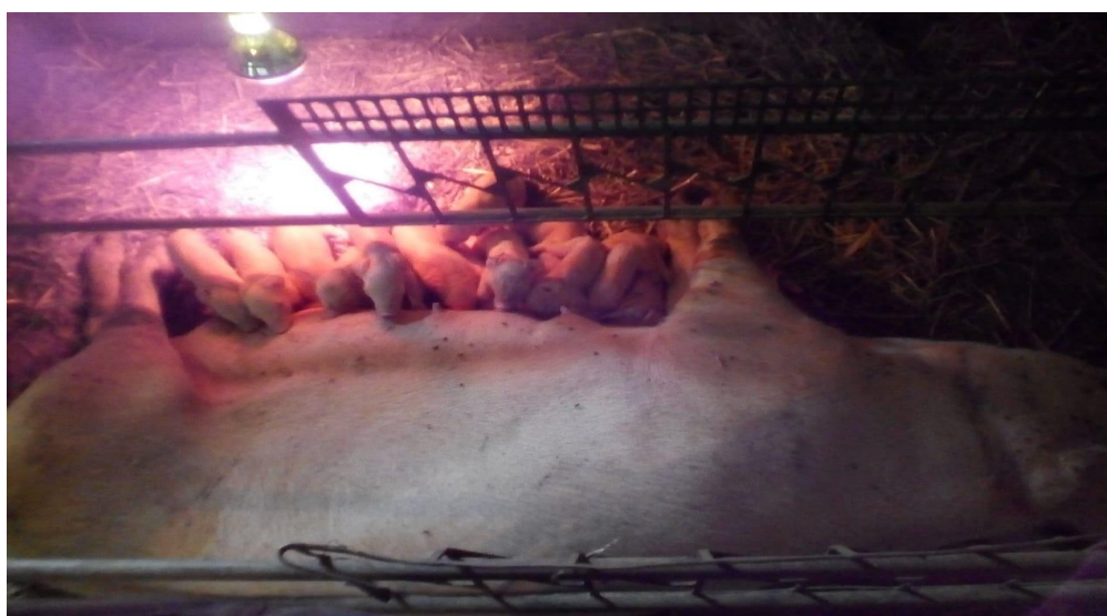
Slika 11. Krmača s prasadi za vrijeme laktacije

Inberg SowMin Lac je proizvod namijenjen krmačama koje su u fazi visoke suprasnosti i kasnije tijekom trajanja faze laktacije. Ovaj premiks sadrži povećan broj aktivnih sastojaka ali i aminokiseline koje omogućavaju proizvodnju veće količine kvalitetnog mlijeka krmače.