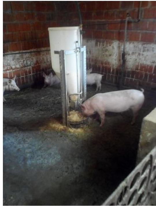
Slika 18. Hranjenje prasadi grover smjesom

Prasad boravi u istom objektu tijekom cijelog razdoblja uzgoja i tova. Za to vrijeme se izmjenjuju smjese za hranidbu. Prilikom prelaska na drugu smjesu uvijek se umiješaju dvije smjese, oko 50 kg hrane, a zatim se počinje hraniti drugom smjesom. Tijekom noći obavezno se ostavlja upaljena žarulja kako bi prasadi mogla pronaći hranu. Ovim načinom hranidbe dobiju se dobri proizvodni rezultati. Zbog mogućnosti konzumacije hrane tijekom 24 sata dolazi do ujednačene tjelesne mase prasadi.