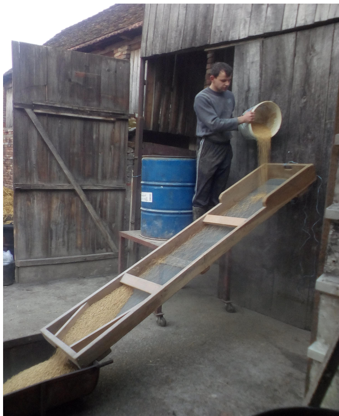
Slika 4. Prosijavanje soje

Prilikom prosijavanja koristi se sito koje je izrađeno za vlastite potrebe. Sastoji se od drvenog okvira i žičane mreže. Kako ne bi došlo do uvijanja mreže prilikom prosijavanja na tri mjesta su postavljene drvene daske.