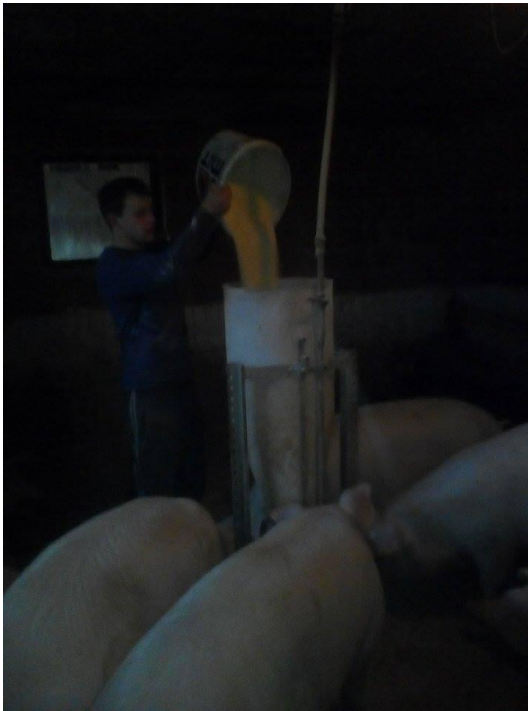
Slika 17. Punjenje automatske hranilice