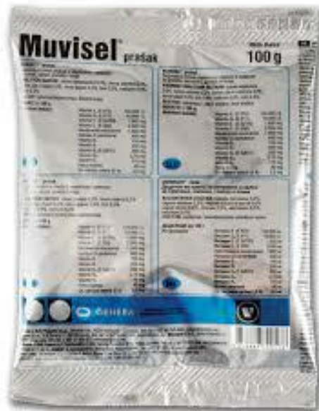
Slika 15. Muvisel prašak