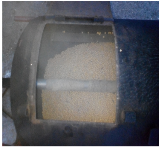
Slika 6. Bubanj za tostiranje soje