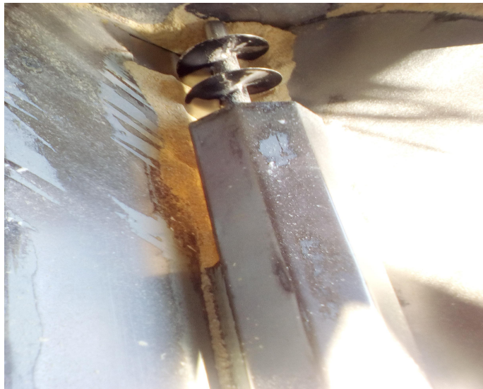
Slika 10. Pužnica mješalice

Usitnjena sirovina iz mlina čekičara pada u usipno grlo kose mješaone. Mješaona je nagnuta pod kutem 45°. Puž mješaone pokreće se centrifugalnom silom uz pomoć elektromotora jačine 3 KW. Princip rada: električna energija pokreće elektromotor koji preko remenice i remenova prenosi silu do pužnice mješaone. Unutar mješaone nalazi se jedna pužnica koja podiže smjesu prema gore. Nakon što dođe do vrha mješaone smjesa se prirodnim padom vraća na početak mješalice.