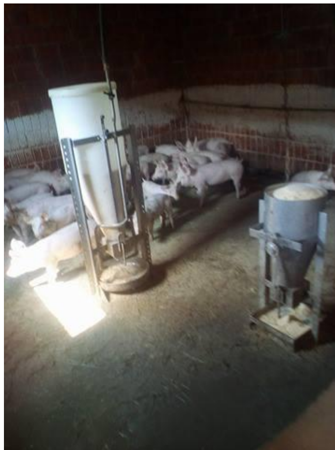
Slika 16. Prasci u uzgajalištu

Prvih nekoliko dana iz hranilica izlazi suha hrana. Zatim, kako bi se smanjio rasip hrane, u hranilice se priključuje se voda koja vlaži hranu. Potrebno je ulaziti u objekt više puta dnevno i provjeravati hranilice da ne bi došlo do začepljenja. Ukoliko dođe do začepljenja hranilica prasadi u hranilice natače vodu te je konzumira umjesto hrane te može doći do pojave proljeva. Starter se prasadi daje od odbića, kada prasadi ima oko 7 – 8 kilograma, pa sve do 15 – 18 kada se počinje hraniti grover smjesom.