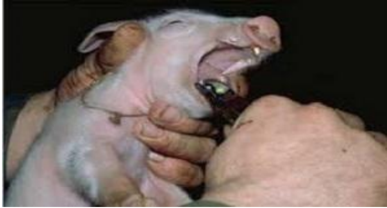
Slika 13. Rezanje mliječnih zubi prasadi

Treći dan nakon prasenja krmača izlazi na ispust. Za to vrijeme prascima se škarama režu mliječni zubi, kako ne bi grizli i ozlijedili majku prilikom sisanja. Poželjno je da se prascima odsjeku repovi kako bi se spriječilo grizenje i pojava kanibalizma u daljnjem uzgoju.