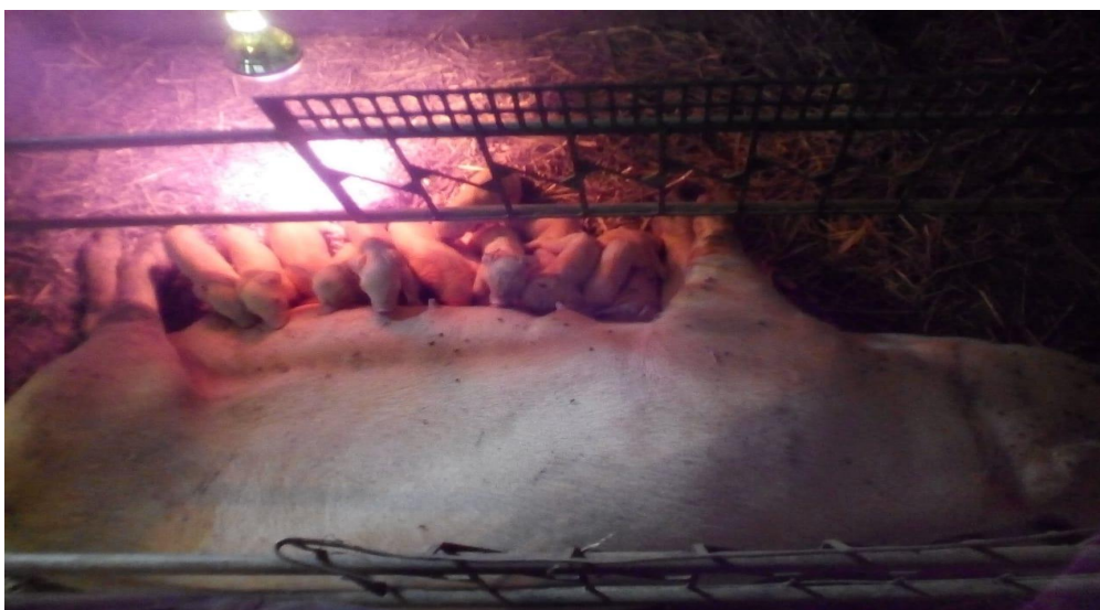
Slika 11. Krmača s prasadi za vrijeme laktacije

Inberg SowMin Lac je proizvod namijenjen krmačama koje su u fazi visoke suprasnosti i kasnije tijekom trajanja faze laktacije. Ovaj premiks sadrži povećan broj aktivnih sastojaka ali i aminokiseline koje omogućavaju proizvodnju veće količine kvalitetnog mlijeka krmače.