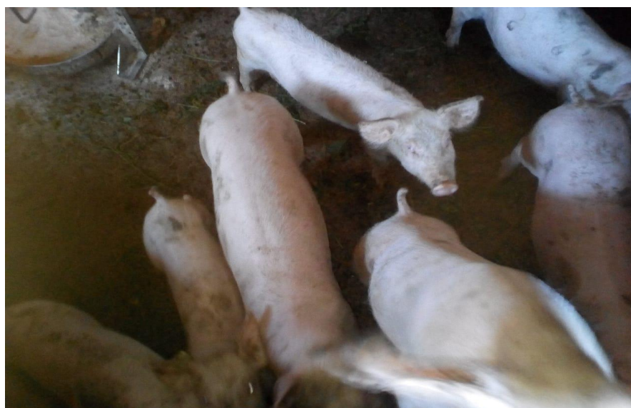
Slika 19. Prasad pokusne skupine 2

Iz podataka navedenih u tablici 11. može zaključiti da su skupine prilikom postavljanja pokusa bile ujednačenih tjelesnih masa, odnosno statističke značajnosti između skupina nije bilo.