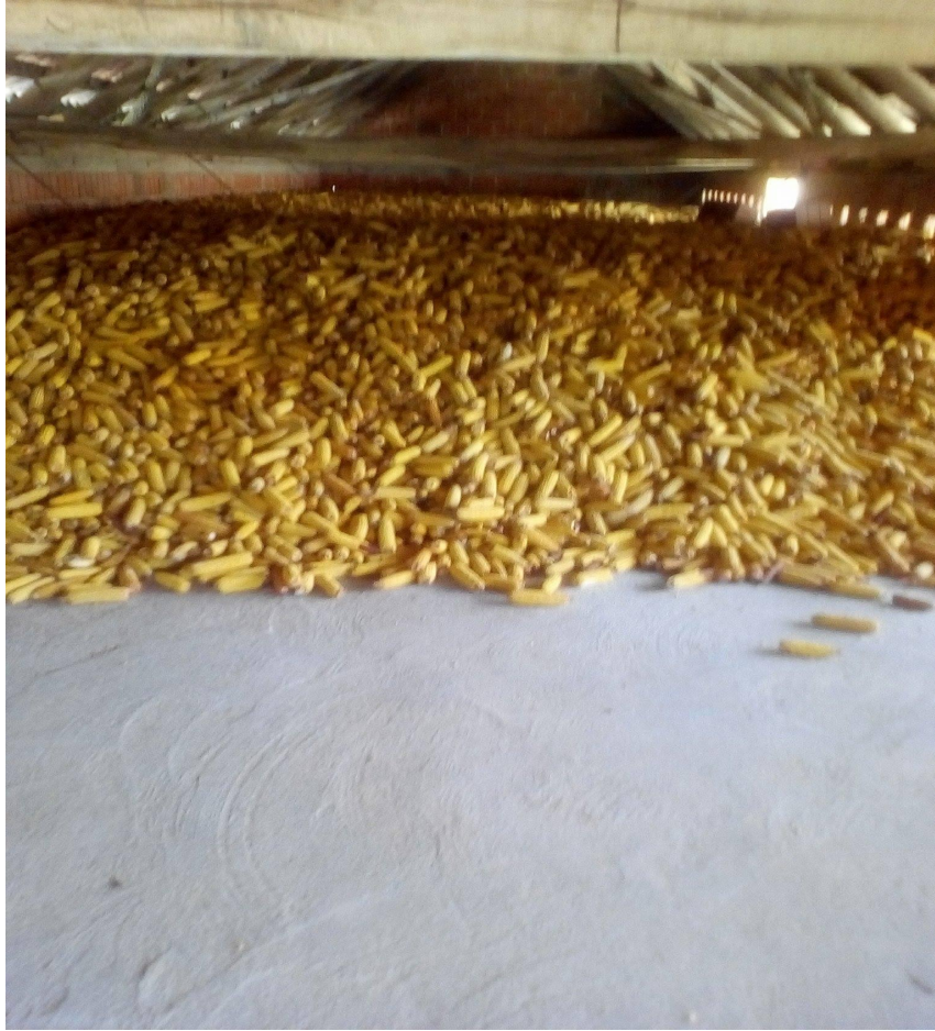
Slika 2. Podno skladište kukuruza s klipom