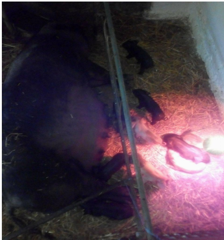
Slika 12. Krmača s prascima na dan prasnjenja

Nakon što krmača oprasi prvo prase pali se infracrvena žarulja te se ogradi dio ispod žarulje kako prasad ne bi mogla ići pod krmaču za vrijeme prasnjenja. Prase se obriše slamom i stavlja pod žarulju. Krmačama se daju 2 internacionalne jedinice oksitocina u vrat, kako bi se ubrzalo prašenje i potaknulo lučenje mlijeka krmače. Krmača se obično oprasi u roku od 2 sata. Svako prase se obriše i stavlja pod grijače tijelo.