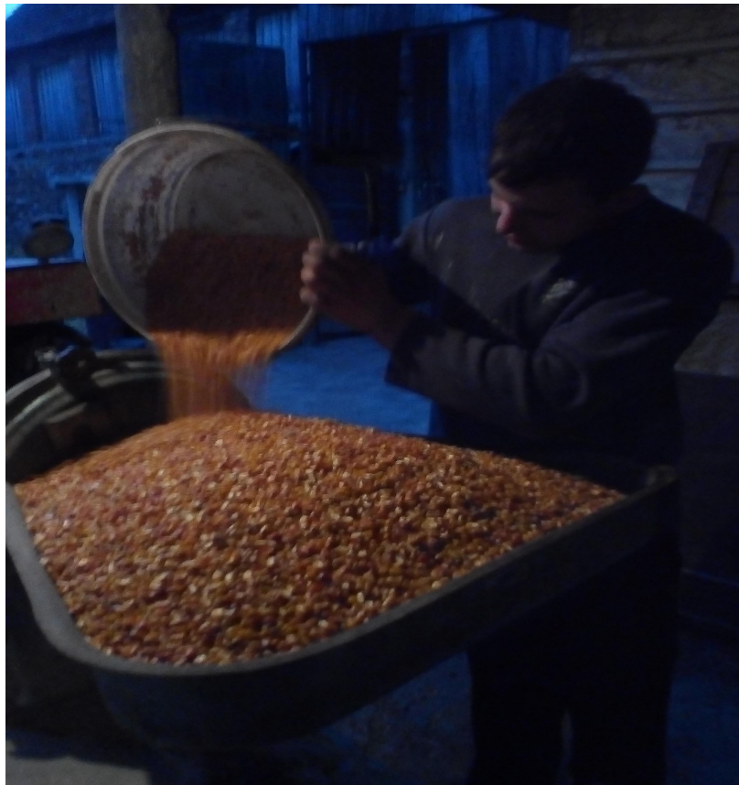
Slika 8. Usipni koš mlina čekičara

Za mljevenje sirovina koristi se mlin čekičar “Klepec 130 K”, na mlin je priključena mješaona koja miješa masu smjese do 400 kilograma. Proces započinje usipom žitarica u koš mlina čekičara. Zrnje žitarica usitnjava se pomoću željeznih noževa mlina čekičara koji su postavljeni u tri reda, unutar jednog reda nalazi se šest noževa, koji centrifugalnom silom razbijaju sirovine i guraju ih prema situ. Noževi su postavljeni na 120°, tako da se ne mogu međusobno dodirivati. Noževi mlina čekičara izrađeni su legure čelika. Sito sprječava da nedovoljno usitnjena sirovina izađe iz bubnja za usitnjavanje. Za proizvodnju krmnih smjesa na OPG-u Mirković koristi se sito promjera 3 milimetra, a za manje kategorije prasadi sito promjera 2,5 milimetra.