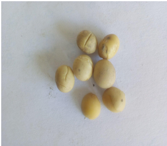
Slika 5. Tostirana soja

Soju se izuzima iz skladišta, zatim ju se prosijava od nečistoća, nakon čega se vrši proces tostiranja. Na OPG-u Mirković imaju razvijen vlastiti mehanizam za tostiranje soje. Proces tostiranja obavlja se u bubnju od bojlera na kojem su naknadno izbušene rupe za zrak. Zapremnina bubnja je 60 kg. Kroz sredinu bubnja prolazi metalna šipka koja omogućava okretanje, vrtnju, bubnja. Unutar bubnja nalaze se peraje koje miješaju soju prilikom tostiranja. Prosijanu soju kroz metalna vrata usipava se u bubanj, koji se zatim zatvara, i bubanj sa sojom se stavlja iznad plamena. Bubanj se cijelo vrijeme tostiranja, oko 30 minuta, vrti uz pomoć elektromotora. Proces tostiranja traje dok ne dođe do pucanja opne. Nakon što soji pukne opna iz bubnja kroz otvore za zrak izlazi bijeli dim (para). Tada se pristupa skidanju soje s izvora topline i njenom skladištenju. Skladišti se u drveno okno ili u papirnate vreće, te se postupno hladi. Hlađenje soje traje 24 sata i tada je spremna za uporabu.