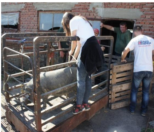
Slika 8. Mjerenje visine križa

Na sljedećim slikama mogu se vidjeti uzimanja tjelesnih mjera na gospodarstvima koja su posjećena na području Slavonije. Mjere su zabilježene te kasnije korištene za analizu u ovome radu.