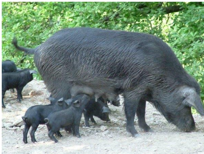
Slika 5. Krmača crne sicilijanske pasmine sa prasadi

prelazi 200 g (Pugliese i sur., 2003., Liotta i sur., 2007.). Udio mišićnog tkiva također varira od 46 do 52 % ovisno o načinu hranidbe (Liotta i sur., 2005.). Intramuskularna mast mjerena kod životinja u otvorenom sustavu iznosi 5,7%, a kod životinja držanih u zatvorenom 6,25 % (Pugliese i sur., 2004.). U svom istraživanju Pugliese i sur. (2003.) su izmjerili debljinu leđne slanine u području torakalnog kralješka kod svinja koje su bile uzgajane na otvorenom 55,51 mm, dok je kod svinja koje su boravile vani bila 49,13.