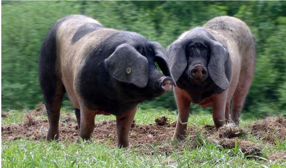
Slika 6. Baskijska svinja