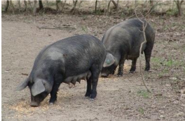
Slika 1. Krmače crne slavonske pasmine svinja