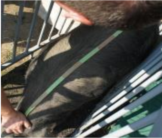
Slika 12. Mjerenje duljine tijela