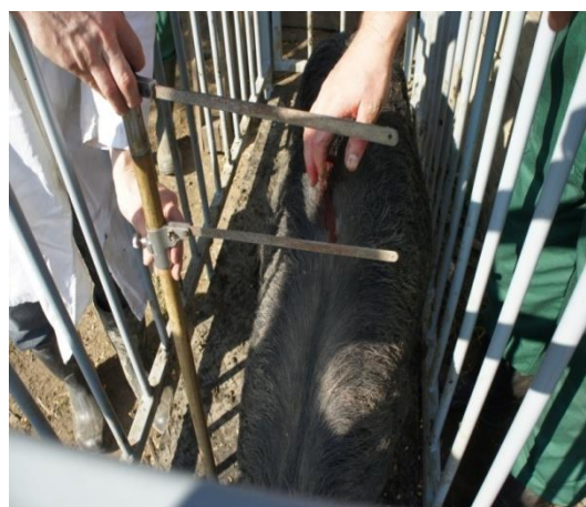
Slika 11. Mjerenje visine grebena