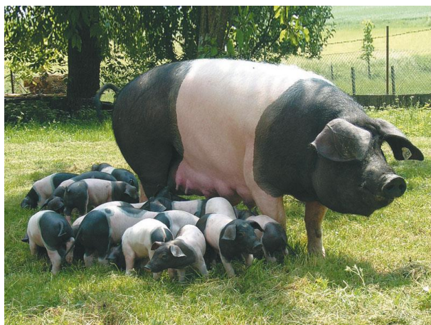
Slika 7. Krmača švapsko-halske svinje sa prasadi