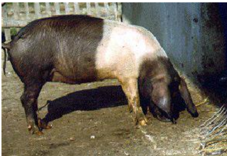
Slika 3. Krškopoljska svinja

Ova pasmina svinja je poznata po odličnoj kvaliteti mesa koje se koristi za tradicionalne svinjske proizvode koje potrošači cijene. S druge strane, sa znanstvenog stajališta, gotovo da ne postoji informacija o nutritivnim potrebama ove pasmine, performans i proizvodna svojstva, kao i kvaliteta proizvoda gotovo su neiskorišteni i nedostaju istraživanja za ovu pasminu (Čandek-Potokar i sur., 2017.). Čandek-Potokar i sur. (2003.) u svojem istraživanju dobili su podatke o debljini leđne slanine mjerene kod zadnjeg rebra 29 mm, te 3% intramuskularne masti. Iz istraživanja koje su proveli Batorek-Lukač i sur. 2016. godine doznajemo podatke o dnevnom prirastu koji iznose 339 – 637 g/danu, te prema njihovim podacima srednja vrijednost debljine leđne slanine je bila 38 mm. Jaritz (2014.) navodi da je udio mišićnog tkiva u polovicama između 40 i 45 %.