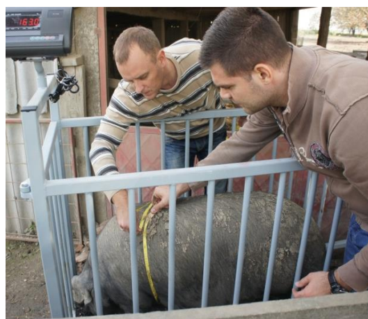
Slika 9. Mjerenje opsega prsa