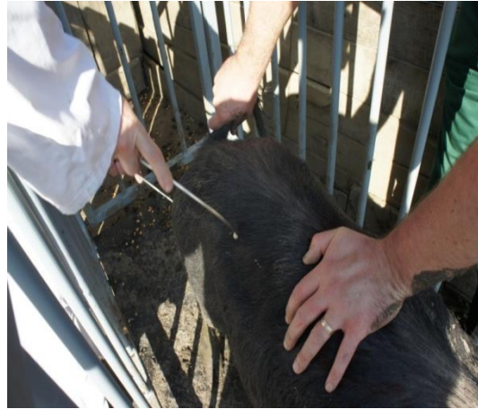
Slika 13. Mjerenje duljine zdjelice