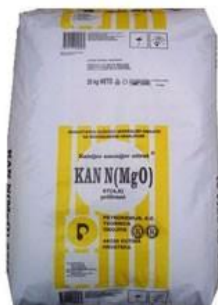
Slika 7: Pojedinačno dušično gnojivo KAN

Miješano gnojivo proizvodi se suhim miješanjem nekoliko gnojiva bez kemijske reakcije. (Lončarić i Karalić, 2015.).