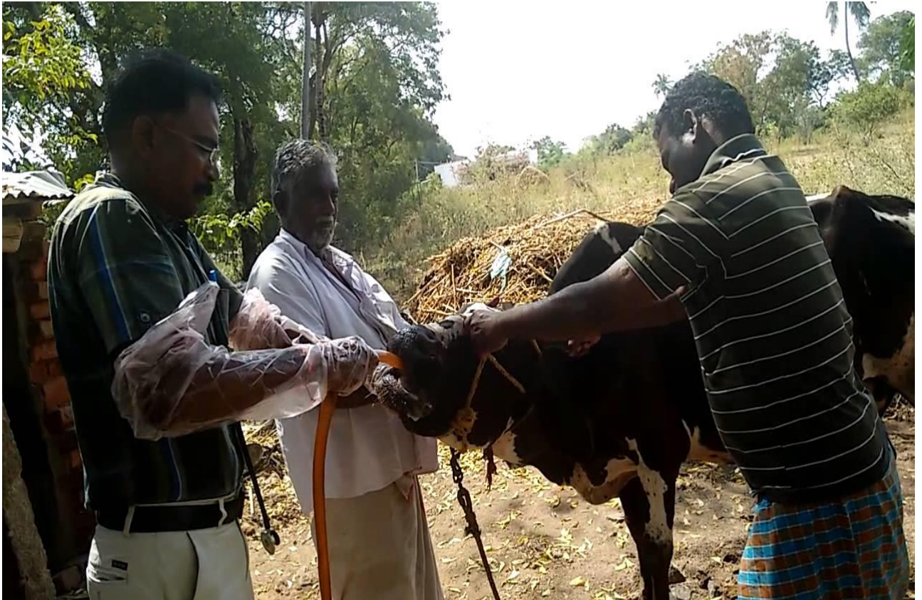
Slika 10. Guranje cijevi kravi kroz usta da bi se pomakao predmet i završio u buragu

Veliki predmeti također cjevčicom mogu biti ugurani u burag radi prestanka gušenja i lakšeg uklanjanja predmeta.