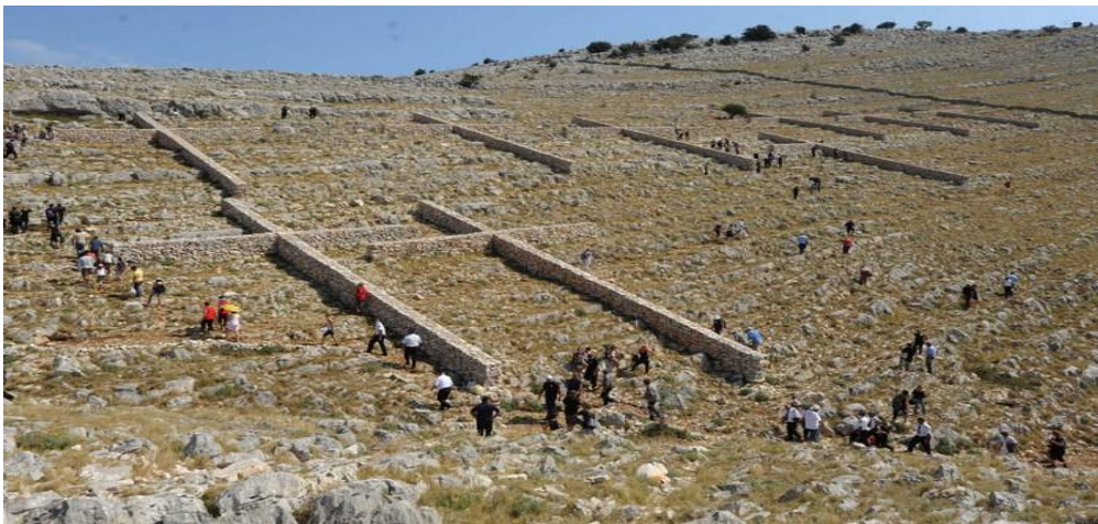
Slika 7. Kornatska tragedija

Privedeno je osam ljudi osumnjičenih za podmetanje požara, a za požar je okrivljen 20-godišnji recepcionar u NP Kornati, koji je navodno opuškom cigarete izazvao požar.