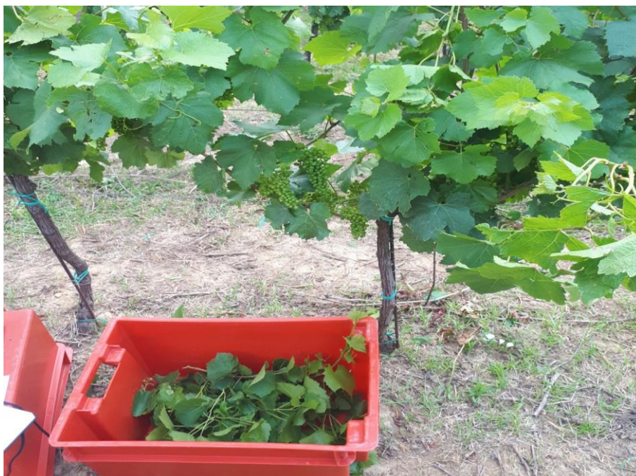
Slika 10. Uklonjeni zaperci u kašetama